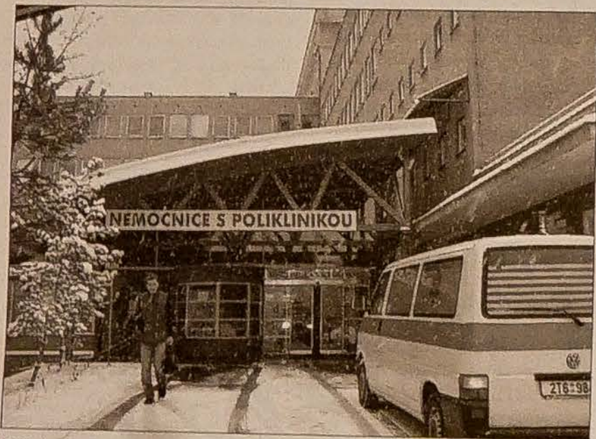
Wejście od strony hali sportowej „Slavil” jest otwarte przez całą dobę.

Problem tkwi w tym, że źle referencje szerzą się ogromnie szybko i są dla mediów ciekawsze. Doniesienia o nieprzyjemnych zajściach figurują zwykle na pierwszych stronach gazet, podczas gdy sprawy pozytywne, np. listy z podziękowaniami, umieszczane bywają gdzieś z tyłu, jako list czytelnika, itp. Dlatego na pierwszy rzut oka wydaje się, że negatywnych informacji jest więcej. Na regularnych naradach ordynatorów, które mamy co miesiąc, podsumowujemy tak skargi, jak i listy pochwalne (czasem są to podziękowania skierowane pod adresem konkretnych lekarzy), i chociaż skarg mogłoby być oczywiście mniej, to można powiedzieć, że liczba jednych i drugich jest mniej więcej taka sama. Staramy się współpracować z mediami, by miały kompleksowy obraz naszego szpitala, zaś z drugiej strony nakładamy lekarzy przede wszystkim do poprawy komunikacji między nimi a pacjentami. Chory ocenia jakość opieki szpitalnej na podstawie stosunku lekarzy do niego, według tego, czy lekarze wytłumaczyli mu na czym polegają wszystkie zabiegi i badania, czy nie było mu w szpitalu chłodno, itp. Kryteria oceny szpitala przez chorego dotyczą bardziej sfery komfortu pacjenta oraz komunikacji niż sfery fachowej, w której się na tyle nie orientuje.