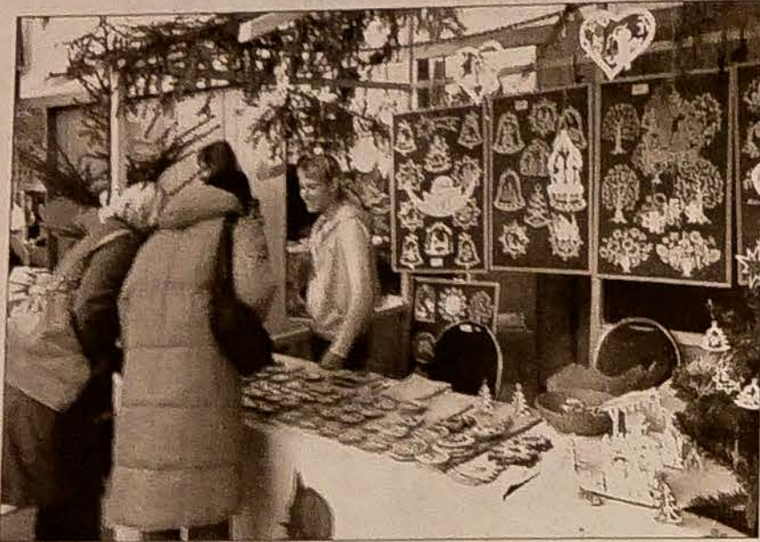
Preludium świątecznego nastroju zafundował zwiedzającym Dom Kultury Trisla, który we współpracy z Muzeum Huty Trzywieńskiej przygotował kolejną edycję Jarmarku Mikołajowego. W piątek Plac Wolności oraz pomieszczenia Trisli (na zdjęciu) opanowali rzemieślnicy ludowi oraz sprzedawcy tradycyjnych wyrobów świątecznych.

Niesygnowane materiały publicystyczne i informacyjne pochodzą z internetowych serwisów informacyjnych.