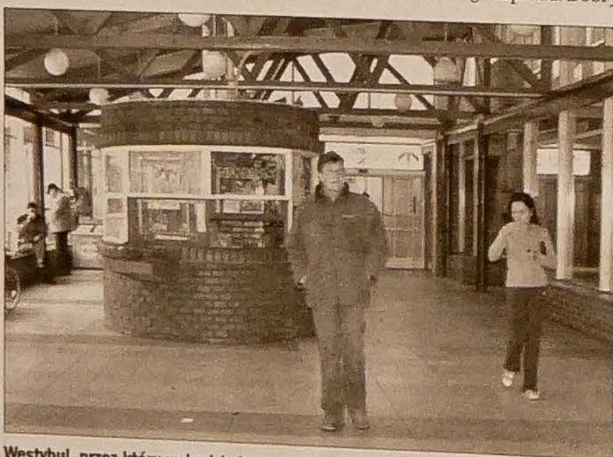
Westybul, przez który wchodzi się do centralnej sali przyjęć.

Lekarze na niektórych oddziałach często się zmieniają, jest tu dużo lekarzy ze Słowacji. Chorzy mogą to