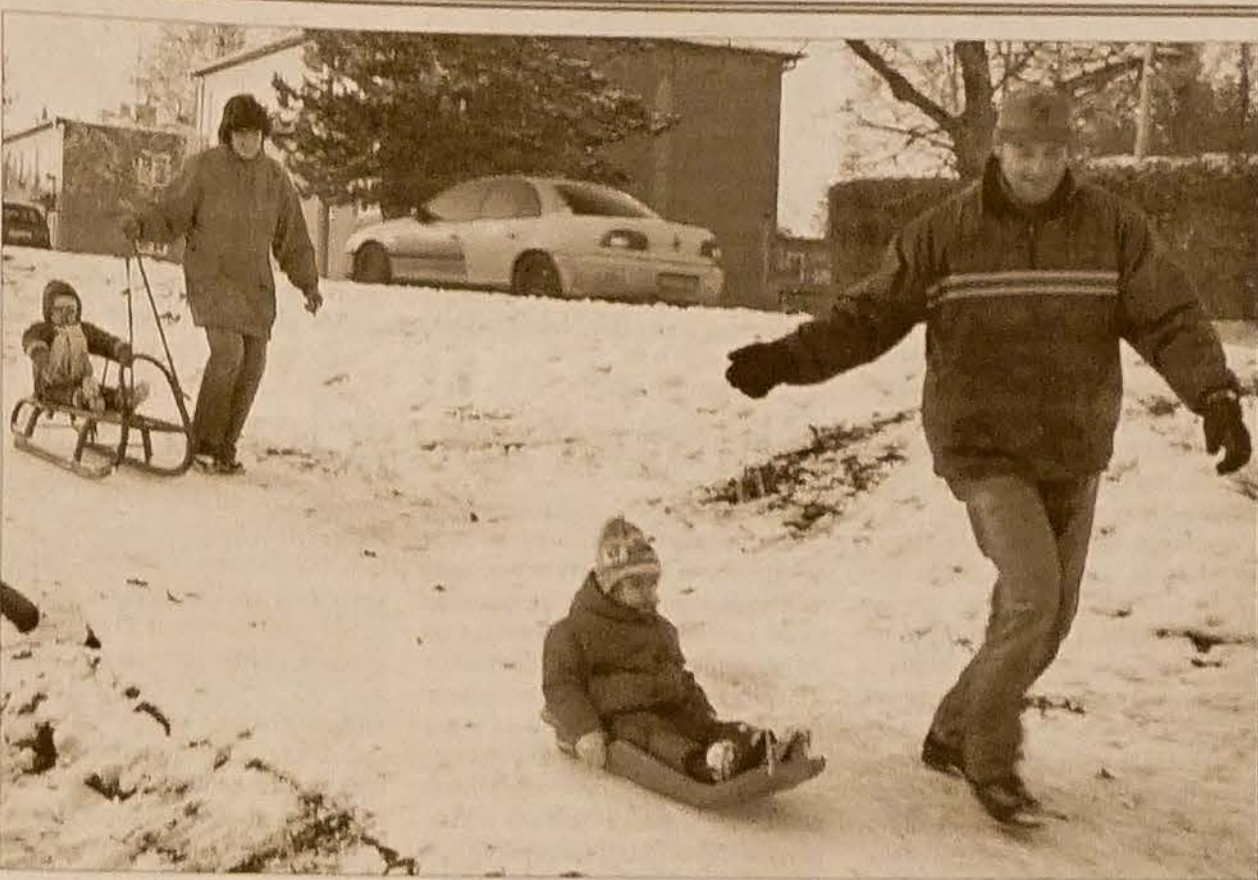
Nie tylko w górach, ale i w mieście można znaleźć skrawek zaśnieżonego zbocza, by pojeździć na sankach.