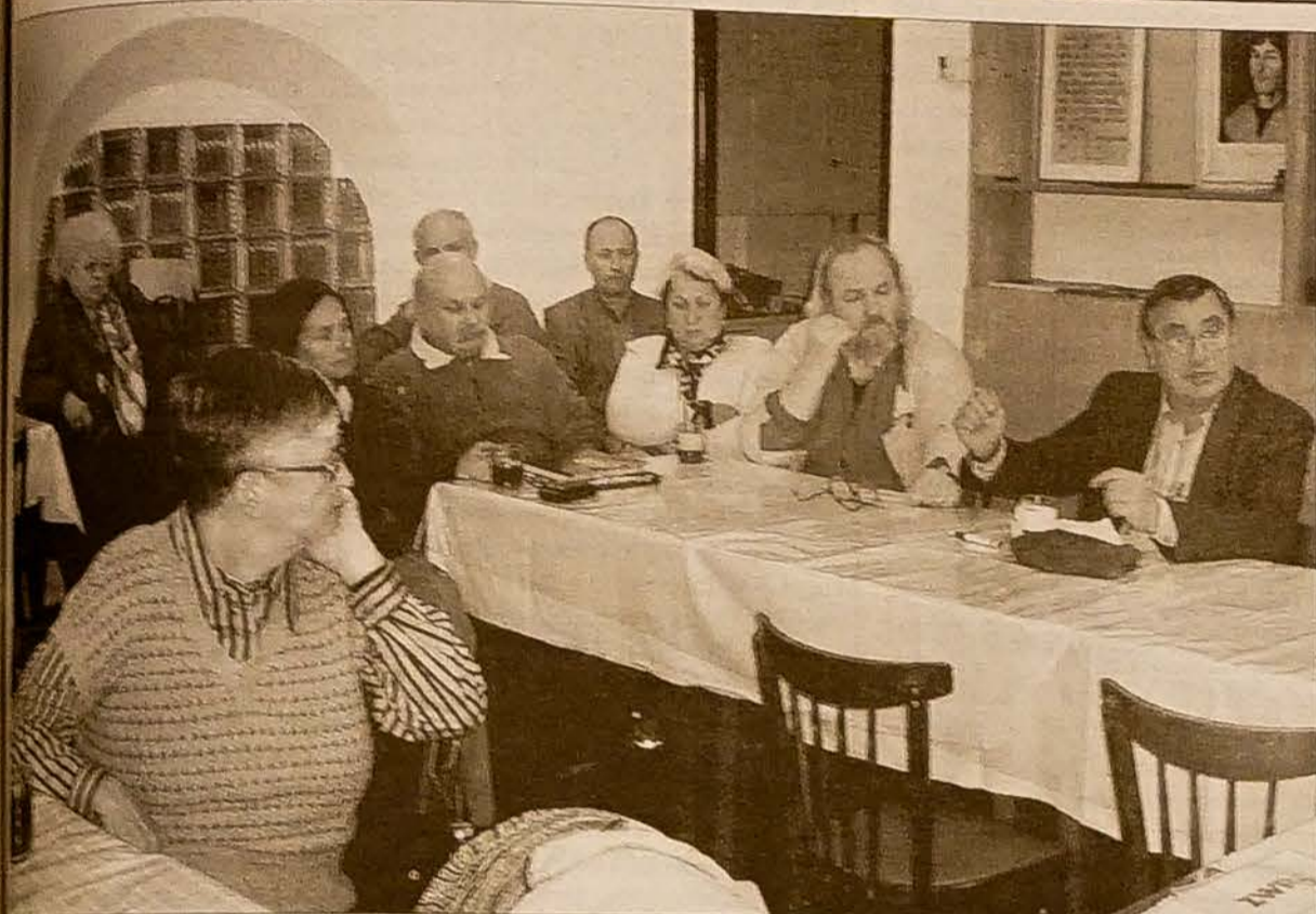
Posesja na październikowej Synydzielni „Zwrotu”.