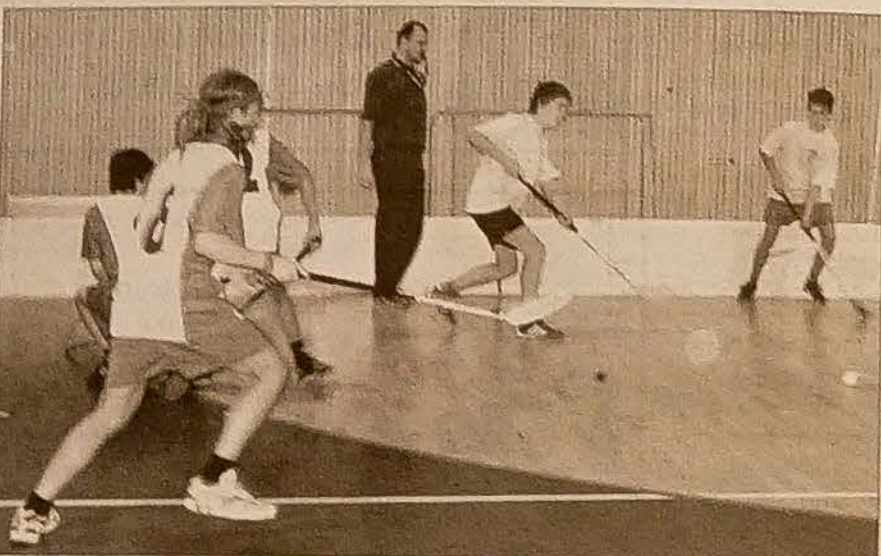
Z meczu Sucha Górna – Trzyniec I w kat. klas 8-9.