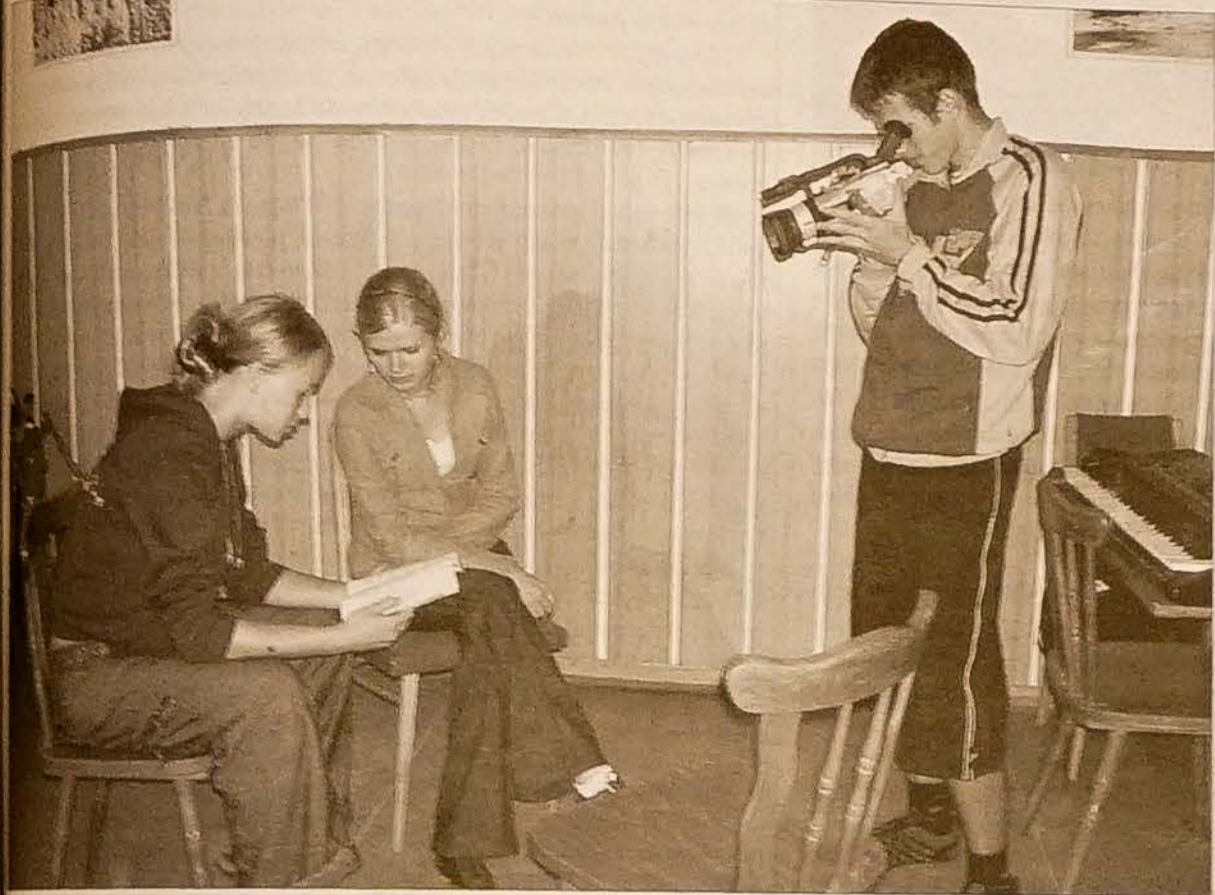
członkowie zgrupowania tworzą m.in. etiudy filmowe.