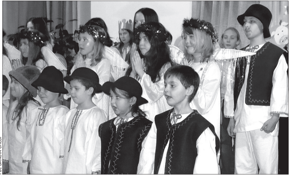
Uczniowie PSP w Suchej Górnej wystawili jasełka dla rodziców i kolegów z zaprzyjaźnionych szkół z Polski.

brała udział w jasełkach, pojedzie na jednodniową wycieczkę do ośrodka narciarskiego w Mostach koło Jabłonkowa.