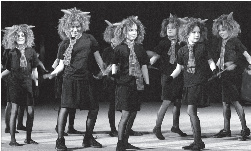
Dzieci, z których wiele pierwszy raz stanęło na tak dużej scenie, przed wypełnioną widownią, nagrodzone zostały gorącymi oklaskami.