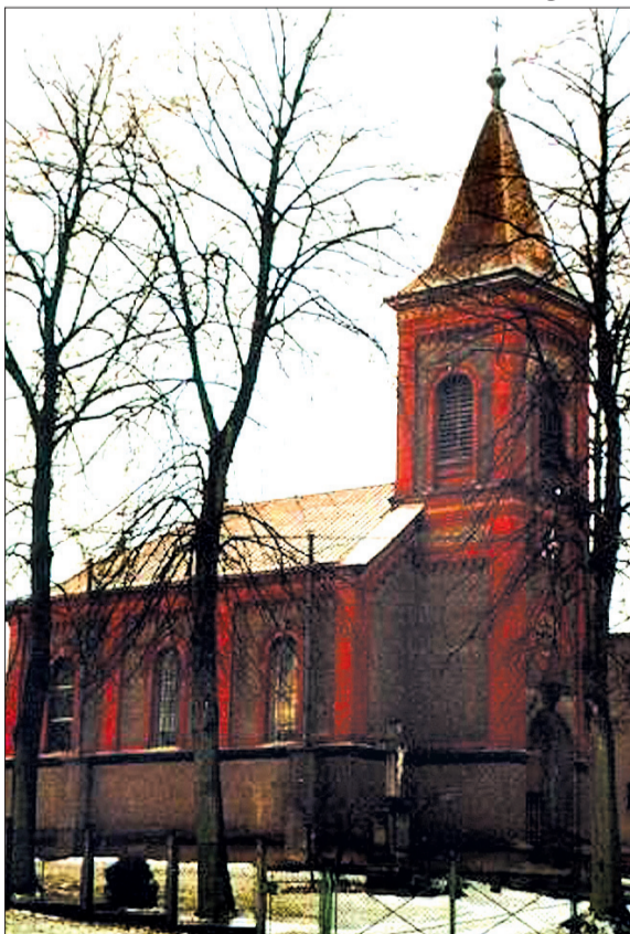
Kościół katolicki p. w. św. Jadwigi, patronki Śląska w Sibicy.