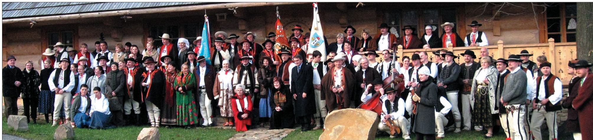
Uczestnicy II Zgromadzenia Górali Śląskich przed mostecką „Drzewionką Na Fojtstwiu”.