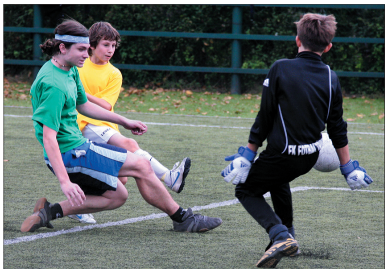
Finałowy mecz pomiędzy Jabłonkowie a Trzyniecem I.