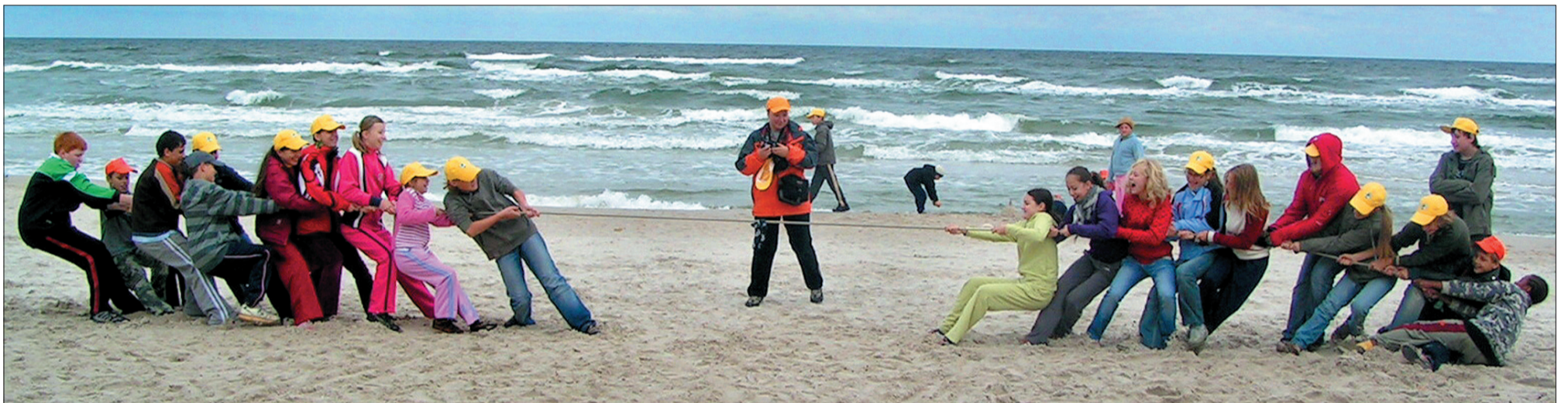
Chociaż pogoda uczestnikom tegorocznej zielonej szkoły nie pozwalała na kąpiel w morzu, zabawy na plaży zdawały się nie mieć końca.