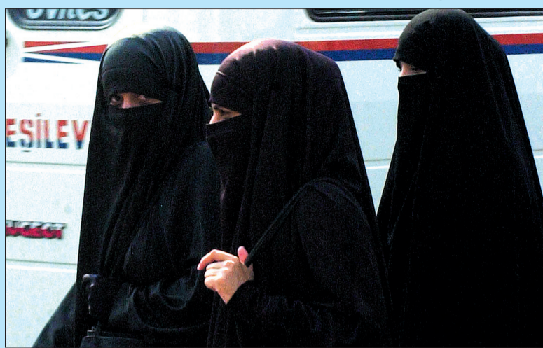
Kobiety ubierające się w tzw. nikab, czyli zasłonę całkowicie zakrywającą twarz, z otworkami na oczy, są w tureckiej metropolii rzadkością.

Islam jest religią dominującą w Turcji. Prawie 99% populacji tureckiej tworzą muzułmanie. Z tego około 75% to sunnici – ortodoksyjni wyznawcy islamu, a 20% wyznawcy odłamu szyickiego. Islam nie jest oficjalną religią państwa. Konstytucja turecka gwarantuje wolność wyznania. Wspólnoty religijne są pod ochroną państwa, nie mogą natomiast brać udziału w życiu politycznym (np. zakładając partię polityczną) lub też zakładać szkoły religijne. Tak samo partiom politycznym nie wolno odwoływać się do religii. Pewna wrażliwość na tradycyjne wartości islamu odczuwalna jest jednak wśród partii konserwatywnych. W Turcji jest także ustawą zabronione noszenie religijnych części garderoby w budynkach władz, szkołach oraz uniwersytetach. Ustawę tę podtrzymał w