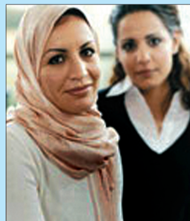
Kobiety w Ankarze, zwłaszcza młode, ubierają się zupełnie normalnie i nie kryją włosów, niektóre dobierają do nowoczesnych ubrań gustowną chustę.

Islam jest religią dominującą w Turcji. Prawie 99% populacji tureckiej tworzą muzułmanie. Z tego około 75% to sunnici – ortodoksyjni wyznawcy islamu, a 20% wyznawcy odłamu szyickiego. Islam nie jest oficjalną religią państwa. Konstytucja turecka gwarantuje wolność wyznania. Wspólnoty religijne są pod ochroną państwa, nie mogą natomiast brać udziału w życiu politycznym (np. zakładając partię polityczną) lub też zakładać szkoły religijne. Tak samo partiom politycznym nie wolno odwoływać się do religii. Pewna wrażliwość na tradycyjne wartości islamu odczuwalna jest jednak wśród partii konserwatywnych. W Turcji jest także ustawą zabronione noszenie religijnych części garderoby w budynkach władz, szkołach oraz uniwersytetach. Ustawę tę podtrzymał w