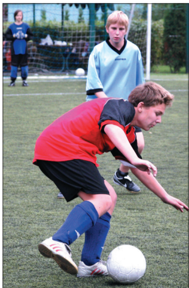
Spotkanie o 3. miejsce: Karwina – Czeski Cieszyn.

W tym roku turniej przeniesiono do Czeskiego Cieszyna i, jak się okazało, był to strzał w dziesiątkę. Do memoriału zgłosiło się dziesięć drużyn podzielonych na dwie grupy. Grupa A (Jabłonków A, Trzyniec I, Wędrynia, Bystrzyca, Gnojnik) zaliczyła swoje spotkania na boisku przy ul. Ostrawskiej, grupa B (Karwina, Cz. Cieszyn, Jabłonków B, Sucha Górna, Mosty) miała swoją bazę na Brandysie. Po dwie najlepsze ekipy z każdej z grup awansowały do fazy pucharowej, którą rozegrało już wyłącznie na boisku obok restauracji Brandys. O sprawny prze-