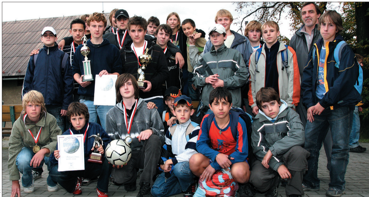
Zwycięska drużyna Jabłonkowa „A” wraz z zespołem „B”.