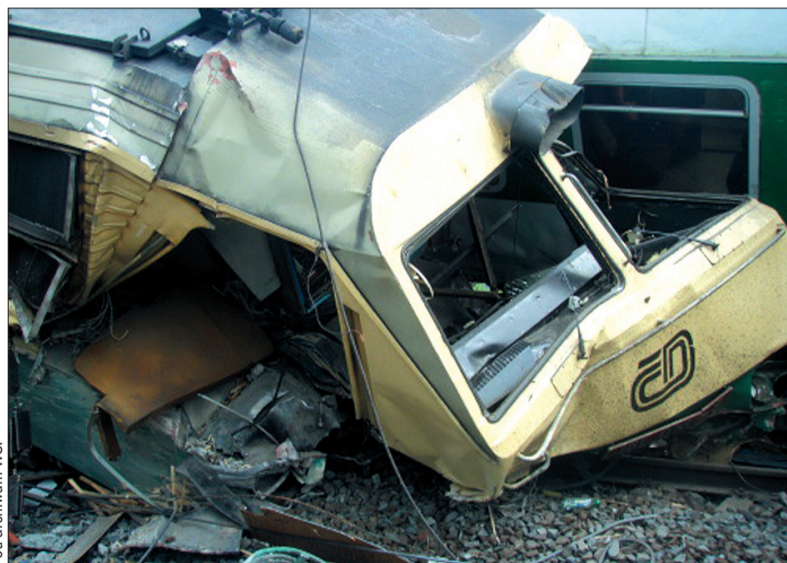
Tyle zostało z ważącej 90 ton lokomotywy ekspresu EuroCity „Comenius”, która z prędkością 90 km na godzinę wjechała w walącą się konstrukcję wiaduktu. Kolejarze musieli usunąć z torów nie tylko ją, ale i dwa mocno zakleszczone wagony, oraz dwa inne, mniej uszkodzone. Na miejscu katastrofy przez weekend pracowały trzy dźwigi o nośności 125 ton i dwa pociągi ratownicze.