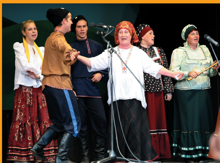
„Kazaczka Piesnia” z Rosji