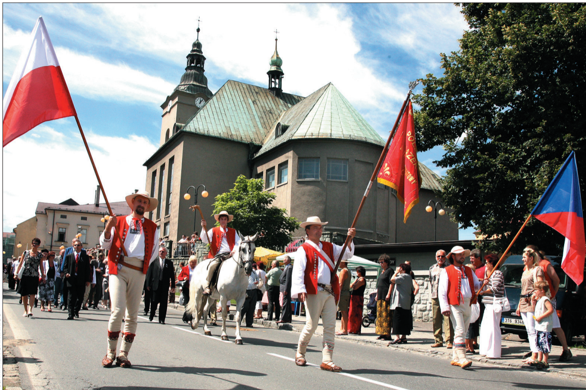
Trzeci dzień Gorolskiego Święta rozpoczął barwny korowód, który wyruszył z jabłonkowskiego rynku do Lasku Miejskiego.

Sobota rozpoczęła się na sportowo – Rajdem „O Kyrpce Macieja” i Biegiem „O Gliniany Dzbanek Mleka”. Popołudnie w Lasku Miejskim należało zaś nie tylko do zespołów folklorystycznych, ale i do rzemieślników – po raz kolejny przybyli pokazać swoje „szikowne gorolski ryncce”. Przy stoiskach zobaczyć można było pokaz rzemiosła i rękodzieła ludowego, najwięcej zaś było twórców, którzy posiadają certyfikat dla produktów regionalnych „Górolsko Swoboda”. Można było kupić m.in. rzeźby, wyroby kowalskie, drutowa-