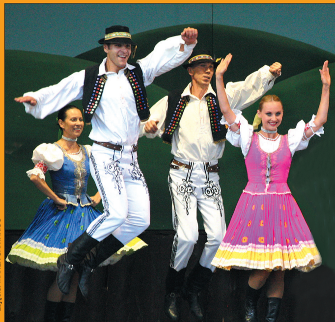
„Sl'uk” ze Słowacji