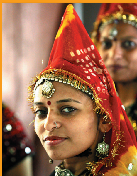
Tancerki zespołu „Kalamandir Sanskritik Trust” z Indii