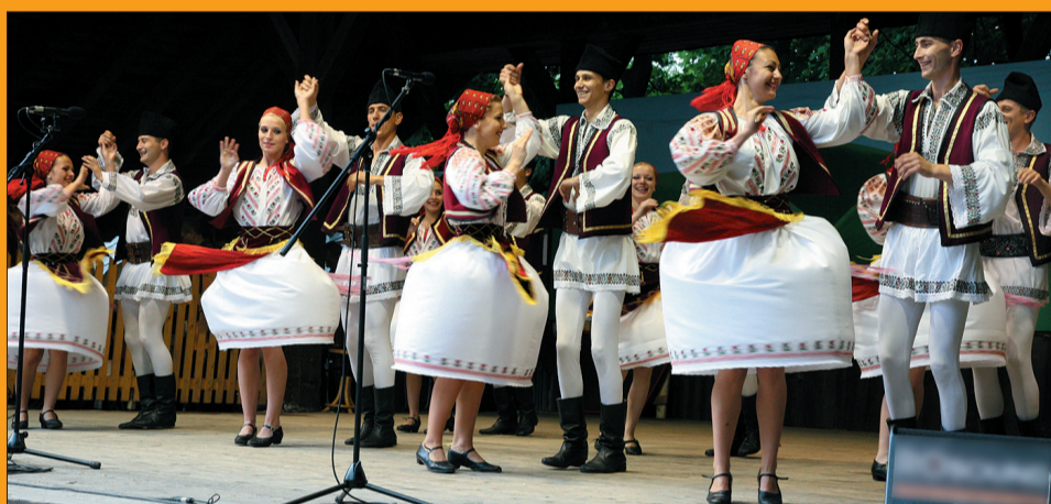
„Transilvania” z Rumunii.