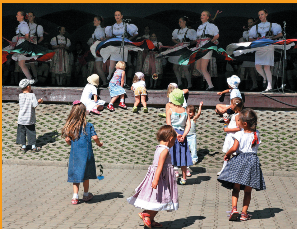
Wirująca „Równica” z Polski roztańczyła najmłodszych pod sceną.