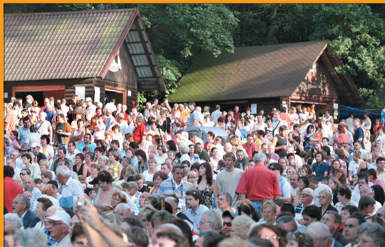
W niedzielę trudno było znaleźć skrawek wolnego miejsca...