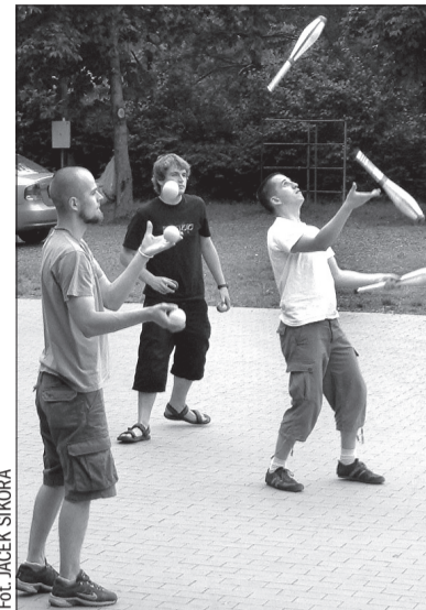
W drugim dniu DKS-u można się było m.in. nauczyć podstaw żonglerki.

Dodajmy, że w ub. tygodniu SMP ogłosiło konkurs, w którym należało odpowiedzieć, jak nazywa się najnowsza płyta grającego w piątek w