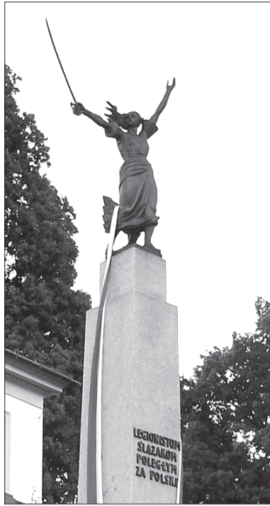
Pomnik Legionistów Śląskich stanął na Wzgórzu Zamkowym w 1934 r., w 20. rocznicę wymarszu z miasta Legionu Śląskiego. W tym roku udało się odbudować zburzony przez hitlerowców monument.