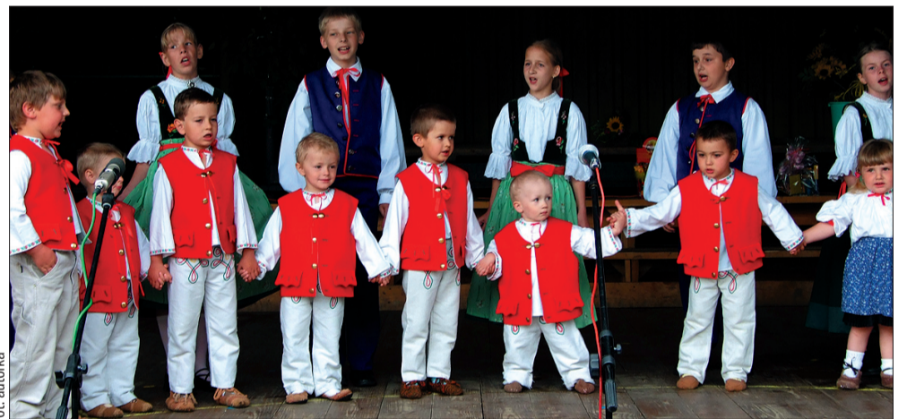
Nieborowskie przedszkolaki wspólnie z uczniami szkoły rozpoczęły obchody jubileuszy swoich placówek wspólnym wykonaniem pieśni „Płyniesz Olzo”.

Starsi koledzy przedszkolaków, czyli uczniowie polskiej nieborowskiej klasy, zaprezentowali na jubileuszu wiankę tańców i pieśni cieszyńskich. Do roku 1978 Niebory posiadały samodzielną szkołę, która od jesieni 1908 roku mieściła się w dziś już stuletnim budynku. Z powodu zmniejszającej się liczby dzieci oraz zmian w koncepcji szkolnictwa doszło w roku 1978 do połączenia ze szkołą w Ropicy. Do prawnego połączenia jednoklasówki z Nieborów i jednoklasówki z Ropicy w jedną szkołę doszło w 1981 r. W 2003 r. w wyniku kolejnej transformacji szkolnictwa nieborowska placówka połączyła się w jeden podmiot prawny z czeską szkołą w Ropicy.