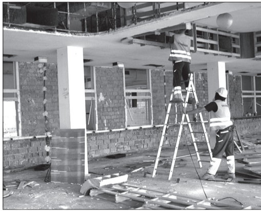
Robotnicy demontują w domu hotelowym instalację wentylacyjną.

BOGUMIN (mro) – Części gospodarstwa cieszącego się złą sławą domu hotelowego w Boguminie znikają z powierzchni ziemi. Wraz z początkiem czerwca przystąpiono bowiem do wyburzenia tej części obiektu. Rzemieślnicy rozpoczęli od demontażu centralnego ogrzewania, wentylacji oraz sieci inżynierskich. Prace są prowadzone z góry na dół. – Ze względu na unoszenie się pyłu robotnicy będą skrapiać teren rozbiórki wodą, tak by obniżyło się zapylenie w okolicy – powiedziała redakcji Hana Kaspárková z Wydziału Inwestycji bogumińskiego Urzędu Miasta. Rozbiórkę obiektu i niwelację terenu zaplanowano do końca miesiąca. Prace zostaną zakończone wraz z wybudowaniem nowego wejścia do części mieszkalnej odnowionej rezydencji, nazywanej „Słoneczniki”. Całość prac jest szacowana na 8,3 mln kc.