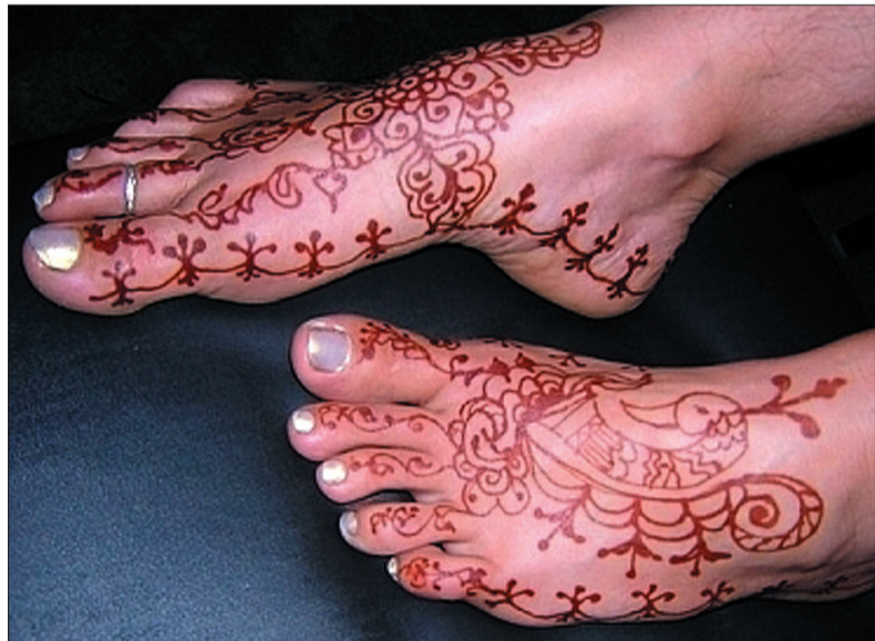
Tatuaż malowany henną naturalną, bez dodatku szkodliwych barwników, ma kasztanowo-czerwony kolor.

UWAGA, RODZICE! Zachęcamy do nadsyłania zdjęć Waszych pociec, które przysłyły na świat w ostatnich miesiącach. Prócz zdjęcia prosimy o informacje na temat imion i nazwisk(a) rodziców, daty i miejsca urodzenia dziecka oraz jego wagę urodzeniową i wzrost, ewent. dane nt. rodzeństwa. Interesuje nas też, w jaki sposób wybieraliście imię dla dziecka. Zdjęcia prosimy przysyłać na adres: chlupova@glosludu.cz lub klasyczną pocztą na adres Redakcji. (jb)