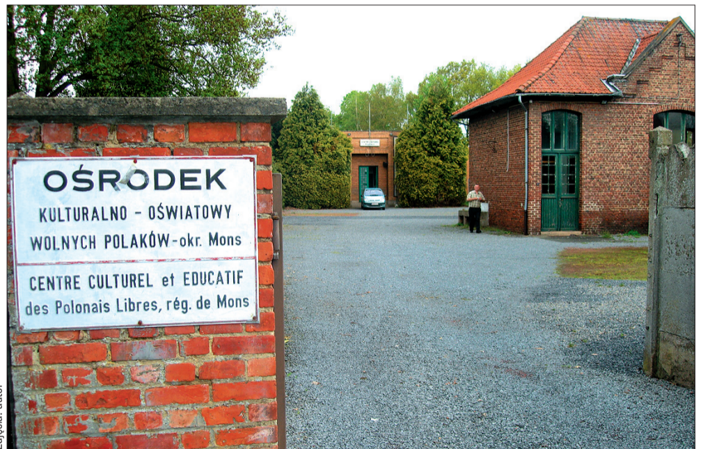
Wejście na teren Ośrodka Kulturalno-Oświatowego Wolnych Polaków w Hautrage stoi otworem. W budynku na prawo mieści się szkoła polska, w głębi – siedziba ośrodka.