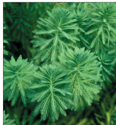
Myriophyllum: Wywłócznik pełny ( myriophyllum aquaticum ) oczyszcza i dotlenia wodę.

Informacje na temat różnych odmian roślin wodnych i ich uprawiania znajdziemy np. w „Wielkiej Encyklopedii Ogrodnictwa” C. Brickella oraz w internetowym „Poradniku Ogrodniczym”. Opr. (dc)