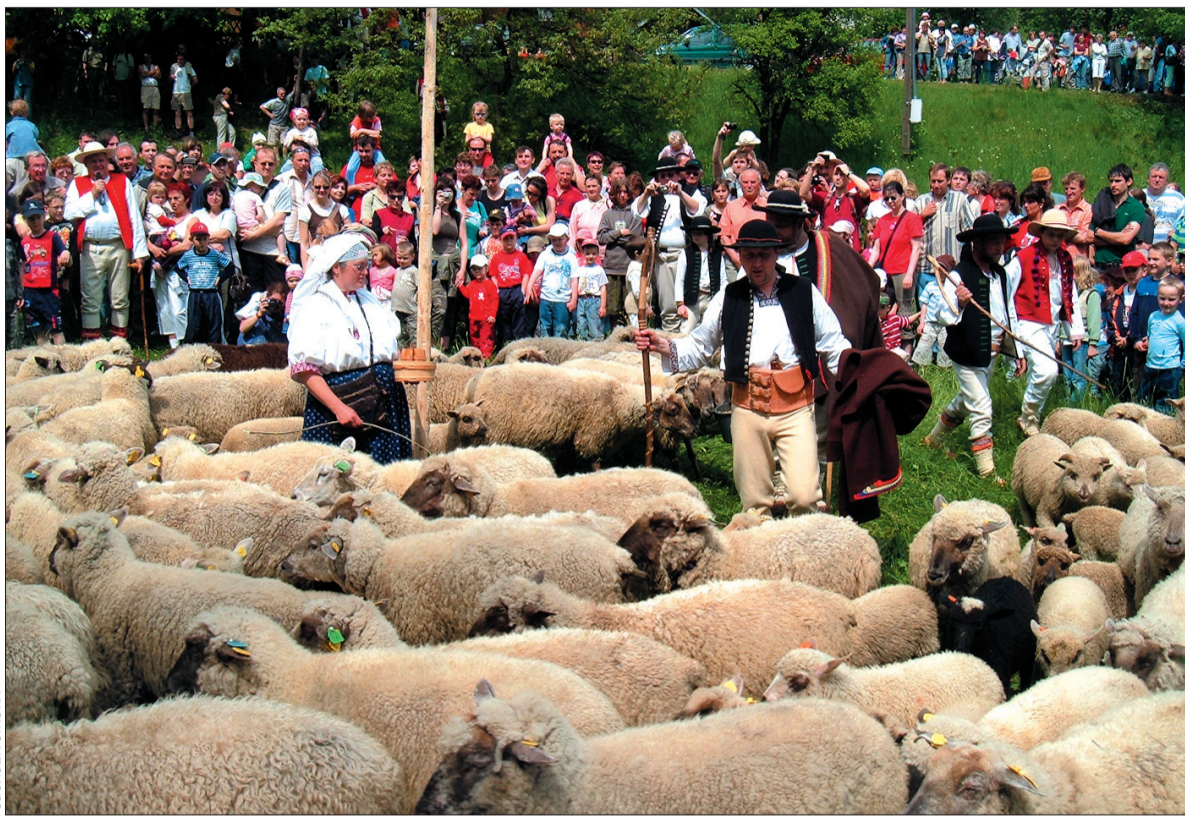
W Koszarzyskach w sobotę „miyszano łowce” już po raz czwarty.

A można się było rzeczywiście, jak zwykle, sporo dowiedzieć o zwy-