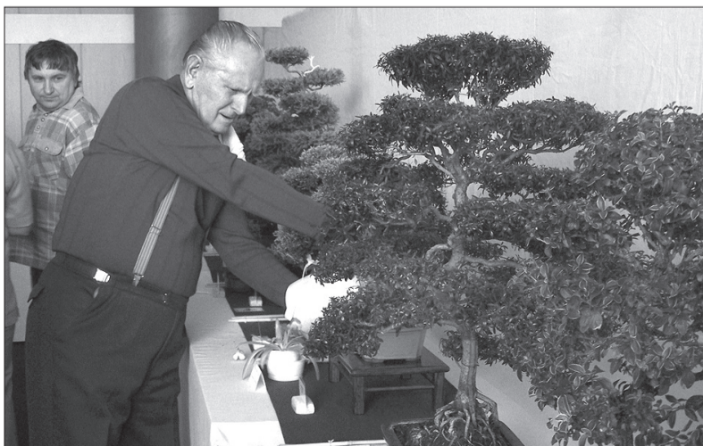
Na wystawie zaprezentowano różne gatunki drzew i roślin pokojowych hodowanych w zminiaturyzowanej formie.

Również w tym roku 66 uczniów z Zaolzia może pojechać na kolonie do Polski, które od lat organizuje Stowarzyszenie „Wspólnota Polska” oraz Kongres Polaków w RC. Tym razem w dniach 7-20 lipca br. dzieci spędzą wakacje w Gronowie koło Torunia. W związku z trwającymi ustaleniami co do kosztów przejazdu, Kancelaria KP nie zna jeszcze dokładnej ceny pobytu, ale stara się, by cena była jak najniższa. Szczegółowe informacje mogą rodzice uzyskać w szkołach, które przeprowadzą rekrutację lub w Kancelarii KP, dzwoniąc na nr 558 711 453 lub pisząc e-maila na adres: kongres@polonica.cz . Kancelaria KP poszukuje również opiekunów, dlatego prosi o zgłaszanie swoich propozycji na powyższy adres. (r)