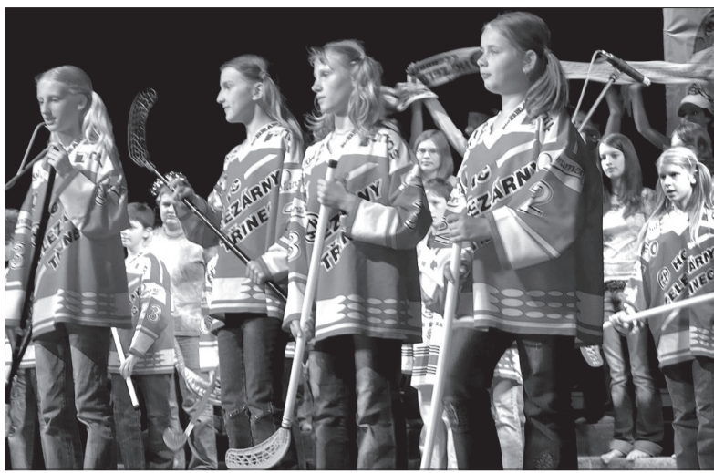
Na koncercie zabrzmiała nawet piosenka kibiców trzynieckiego klubu hokejowego pt. „Ajdu-alajne”.

Scenariusz widowiska obmyślony był tak misternie, że nie trzeba było żadnego słowa wiążącego, by słuchacze zrozumieli, skąd wziął się