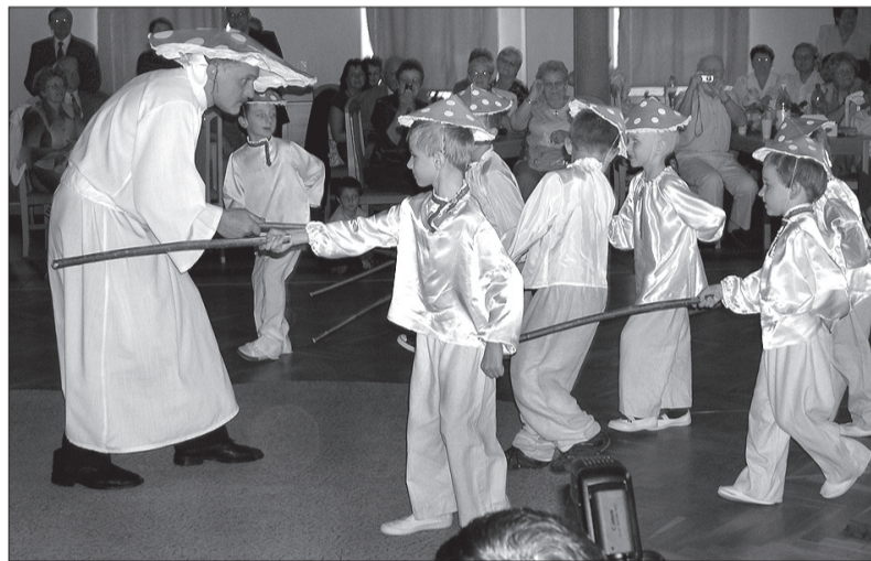
W rytmie jednego z przebojów muzyki klasycznej - „Tańca z szablami” Adama Chacaturiana – „muchomor” i „muchomorki” z karwińskiego przedszkola przedstawiały jesienne zmagania przyrody.