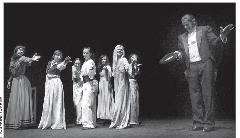
„W 80 dni dookoła świata” w Scenie Polskiej TC.

„W 80 dni dookoła świata” na motywach powieści Juliusza Verne'a. Scenariusz: Petr Markov. Muzyka: Zdeněk Barták. Reżyseria, adaptacja: Miloslav Čížek. Tłumaczenie: Hanna Rybicka. Choreografia: Jaroslav Moravčík. Scenografia: Michał Wyszowski. Aranżacja muzyczna: Daniel Barták. Korepetycje muzyczne: Zbigniew Siwek. Prapremiera: 18 maja 2008 r.