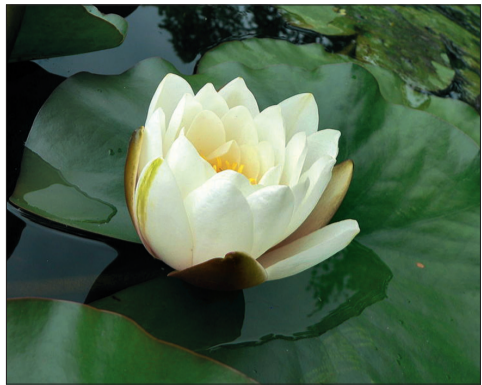
Lilia wodna: Lilie wodne należą do najpopularniejszych roślin pływających.

Ostatnio pisaliśmy o zakładaniu oczka wodnego. Było ono prawdziwą ozdobą ogrodu, powinniśmy poświęcić należyta uwagę doborowi odpowiednich roślin – zarówno otaczających oczko, jak i rosnących wprost w wodzie. Zwracamy przy tym uwagę nie tylko na ich dekoracyjność, ale również na możliwość stworzenia zrównoważonego ekosystemu. Dlatego kombinujemy rośliny rosnące na różnych głębokościach oraz rośliny pełniące praktyczne funkcje w utrzymaniu eko-