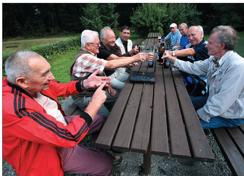
Do następnego meczu! – wznoszą toast piłkarze z Klubu 99.