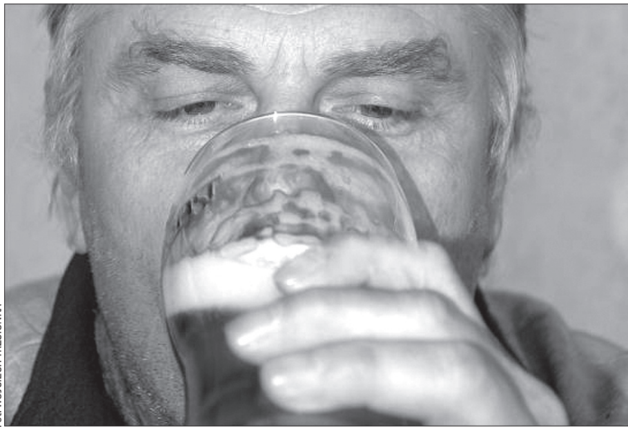
Kufel piwa może być droższy o 50 halerzy.

Wszystko wskazuje na to, że głębiej do kieszeni będzie musiał sięgnąć przeciętny zjadacz chleba. Akcyza na benzynę i olej napędowy wzrośnie o 1 koronę. Pudełko papierosów będzie droższe co najmniej o 2,50 korony, a kilogram tytoniu kupimy o 70 koron drożej.