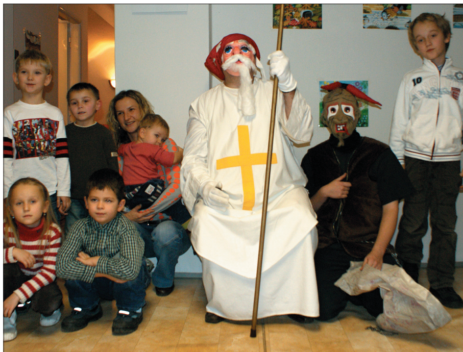
Do świetlicy MK PZKO w Hawierzowie-Szumbarku przychodzi co roku św. Mikołaj.

W następnym sobotnim numerze zaprezentujemy Miejscowe Koło PZKO w Nawsiu.