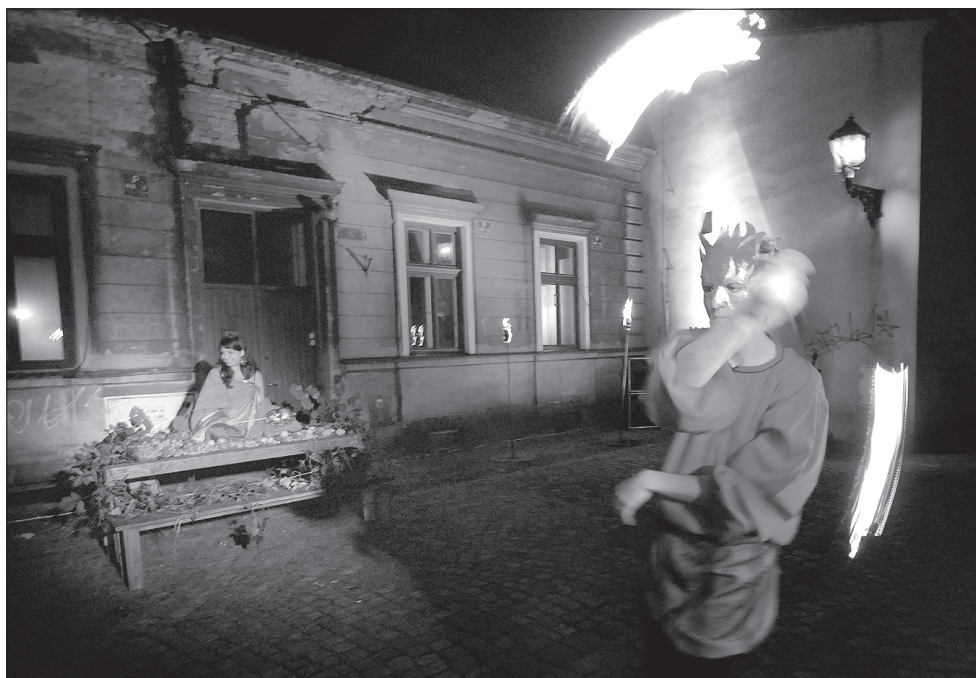
„Karnawał Wenecki” Teatru Gry i Ludzie z Katowic w Cieszyńskiej Wenecji.