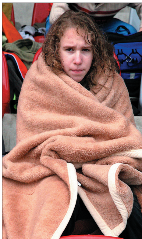
Deszcz i chłód dawały się wszystkim we znaki.