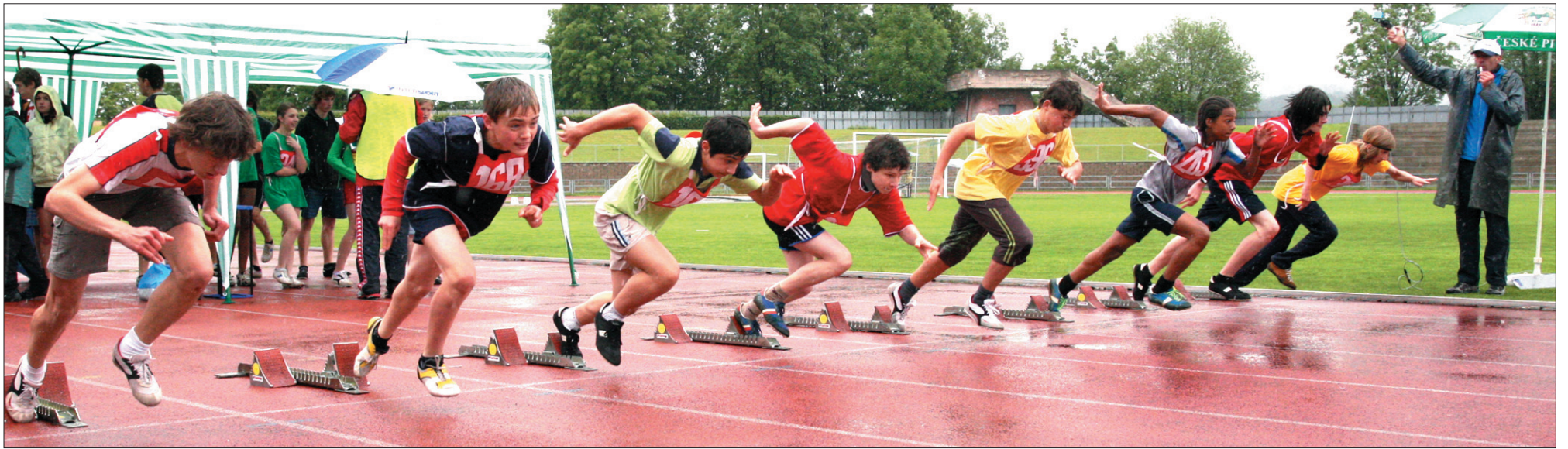
Start w biegu chłopców z klas 6-7 na 60 m.