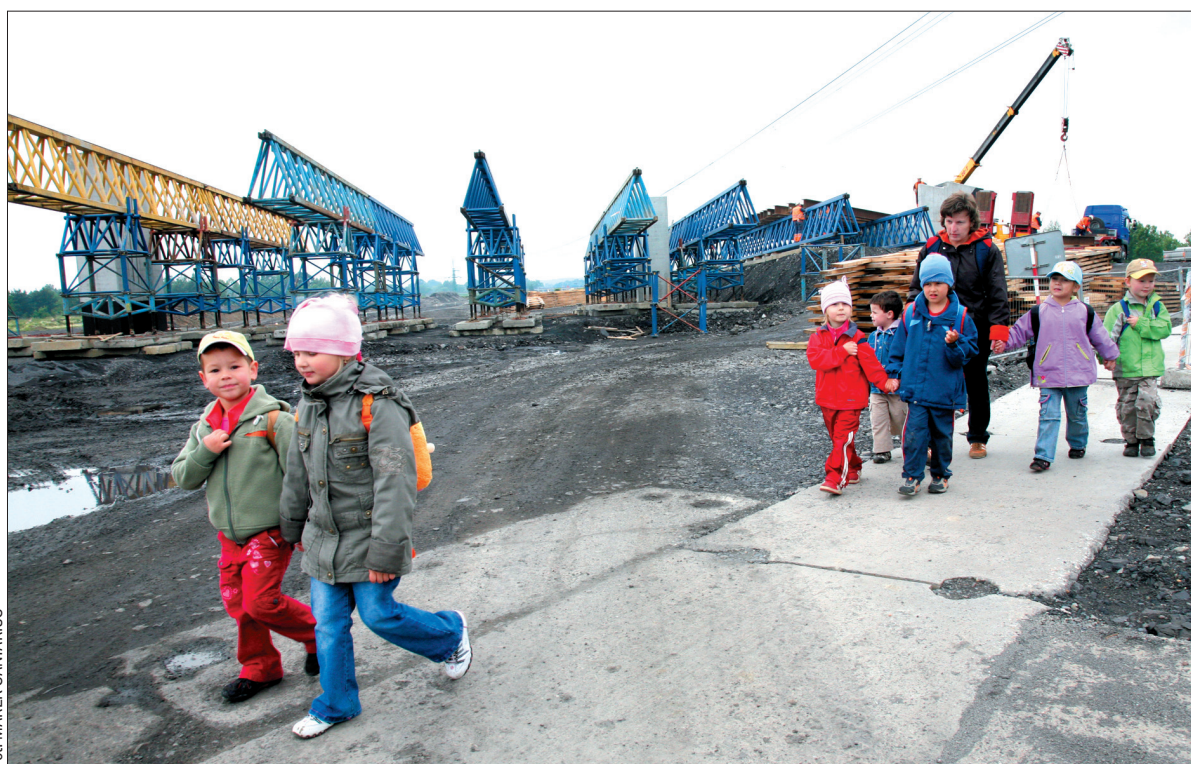
Przedшкоlaki przechodzą prowizoryczną ścieżką, łączącą Stary Bogumín z Nowym. Z obu stron rozciąga się plac budowy autostrady D47. Końca prac na razie nie widać.

Politycy regionalni związani z Czeską Partią Socjal-Demokratyczną zwołali wczoraj w Ostrawie konferencję prasową, której tematem było przerwanie prac na budowie autostrady. Na pytania dziennikarzy odpowiadali m.in. wiceprzewodniczący Izby Poselskiej Parlamentu RC Lubomír Zaorálek, het-