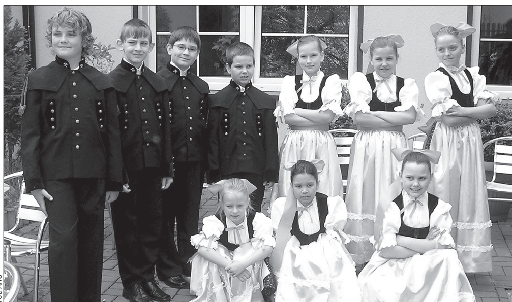
Zespół „Gizdy” z PSP w Karwinie.