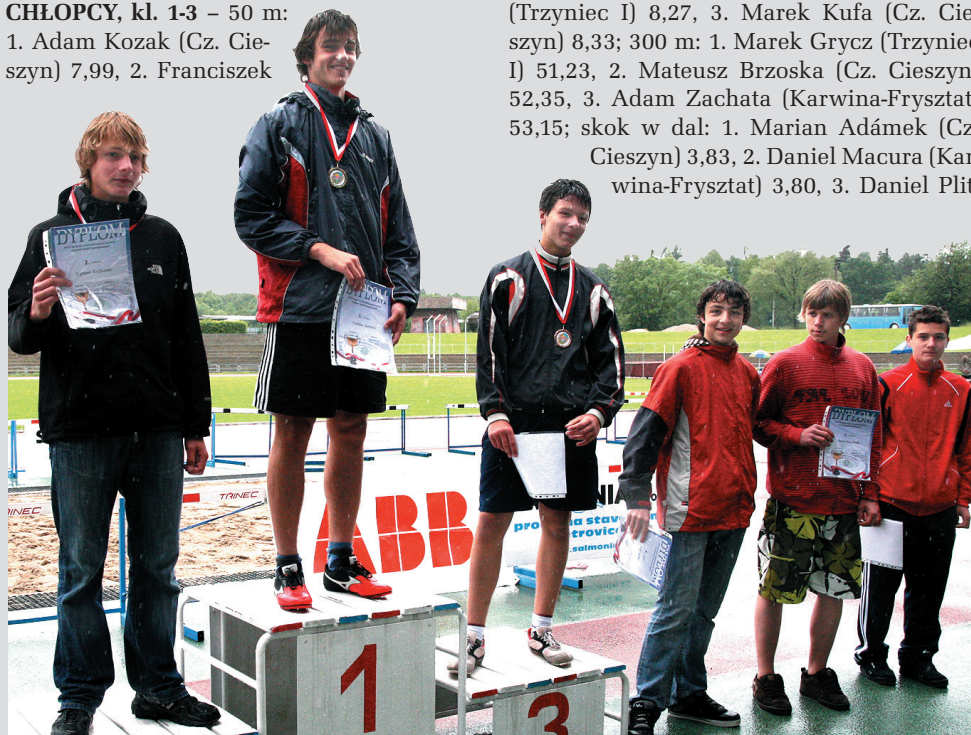
Dekoracja zwycięzców w pchnięciu kulą, chłopcy z klas 8-9.

PUCCHAR PRZECHODNI ZG PZKO (dla najlepszej szkoły w kategoriach I i II): 1. Czeski Cieszyń 112, 2. Jabłonków 95, 3. Karwina-Frysztat 83, 4. Trzyniec I 81, 5. Bystrzyca 64, 6. Gnojnik 57,5, 7. Sucha Górna 51,5, 8. Mosty koło Jabłonkowa 51, 9. Trzyniec VI 49, 10. Oldrzychowice 35, 11. Bukowiec 29, 12. Czeski Cieszyń-Sibica 26, 13. Miliów 25, 14. Wędrynia 23, 15. Olbrachcice 18, 16. Cierlicko 17, 17. Koszarzyńska 17, 18. Stonawa 17, 19. Łomna Dolna 16, 20. Hawierzów-Błędowice 9, 21. Gródek 7 pkt. (jb)