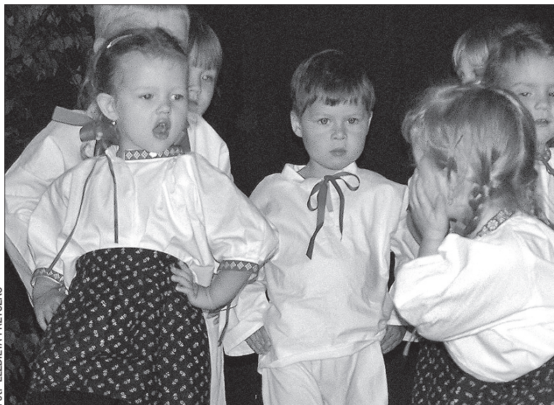
Przedszkolaki z Nawsia wystąpili w jubileuszowym programie.