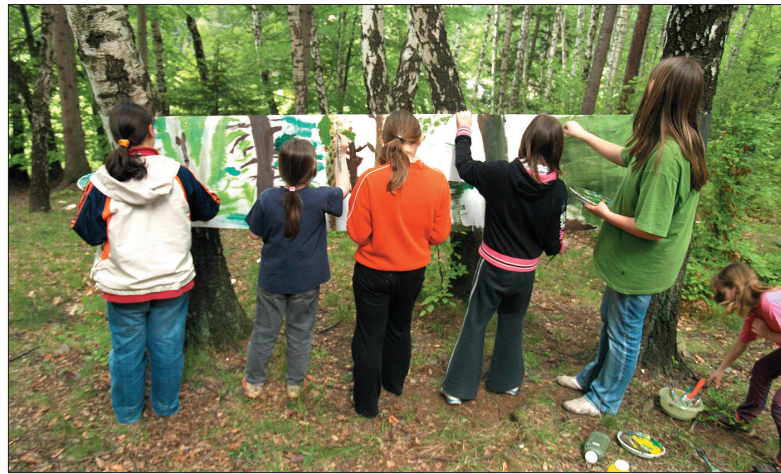
Wiosną zajęcia z plastyki odbywają się w plenerze.

Z doświadczeń Renaty Wdówki, która uczy właśnie gry na skrzypcach, wynika, że to, iż 5- czy 6-letnie dziecko nie umie śpiewać, wcale nie musi oznaczać, że nie ma słuchu muzycznego. – Dziś w domach