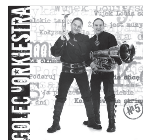
Okładka najnowszej płyty braci Golców.

„Golec uOrkiestra nr 5” zawiera 13 utworów. Autorem tekstów jest Rafał Golec, muzykę napisali bracia bliźniacy oraz bielski kompozytor – Krzysztof Maciejowski. Ten ostatni zagrał także na skrzypcach oraz wystąpił w chórkach. Zgodnie