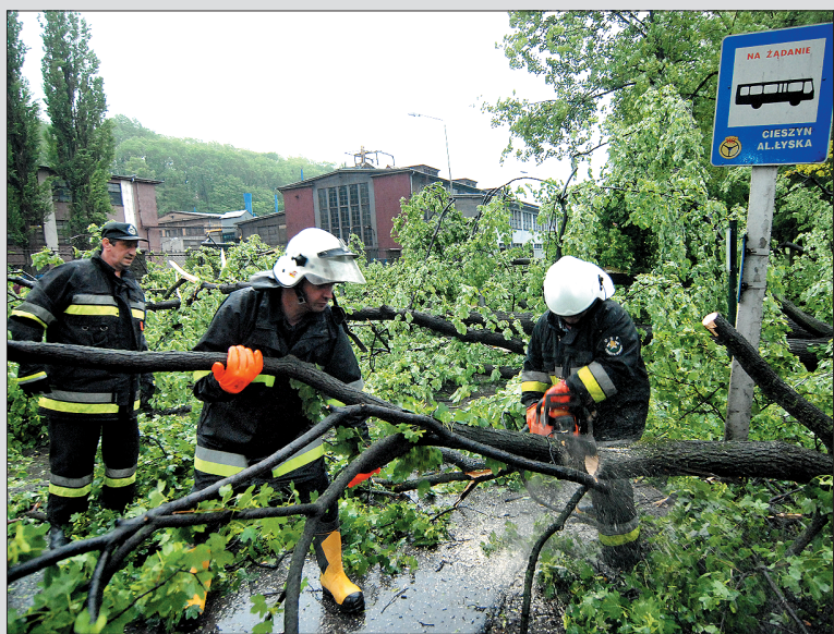
Strażacy usuwali mnóstwo połamanych drzew, m.in. przy al. Tyska w Cieszynie.

W Cieszynie podczas piątkowej nawałnicy zginął 33-letni kierowca. Mężczyzna w czasie burzy przejeżdżał ul. Hażlaską. Drogę jego daewoo zatarasował spadający konar kasztanowca. Kierowca postanowił usunąć go z jezdni. Gdy wyszedł z samochodu, w głowę uderzyła go spadająca gałąź. Poszkodowany trafił do Szpitala Śląskiego. Lekarzom nie udało się go jednak uratować. Obrażenia były zbyt rozległe. (Gazetacodzienna.pl)