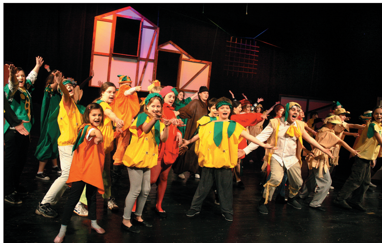
Dzieci obcując ze sceną nabywają pewności siebie.

Fortepian, keyboard, skrzypce, gitara, flet i trąbka to najczęściej wybierane instrumenty muzyczne. Istnieją jednak szkoły, które są w stanie zapewnić nauczyciela do nauki gry również na bardziej wyszukanych instrumentach. Podstawowa Szkoła Artystyczna im. Bedřicha Smetany w Karwinie ma w swojej ofercie również grę na organach klasycznych, czeskokocieszyńska szkoła wprowadziła harfę i fagot.