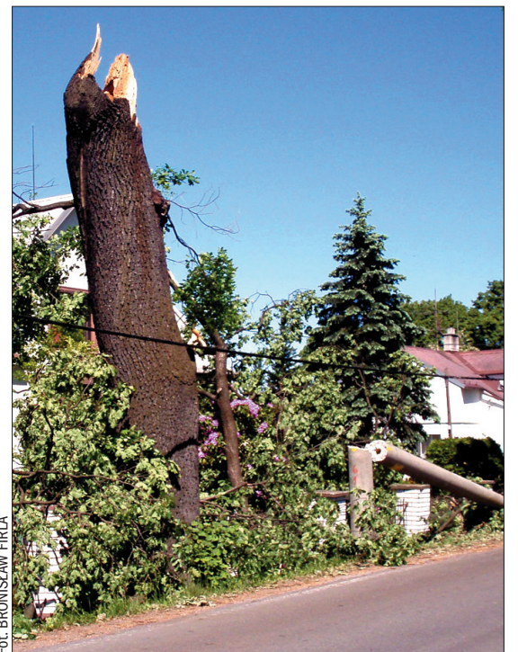
Złamane drzewo i stęp w Suchej Górnej.