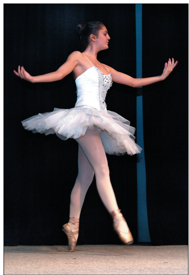
Marzenie, aby zostać baletnicą, może stać się rzeczywistością.

Czerwiec to czas zapisów do podstawowych szkół artystycznych. Nie muzycznych, ale właśnie artystycznych, bo większość oferuje aż cztery kierunki: oprócz muzycznego również plastyczny, taneczny oraz