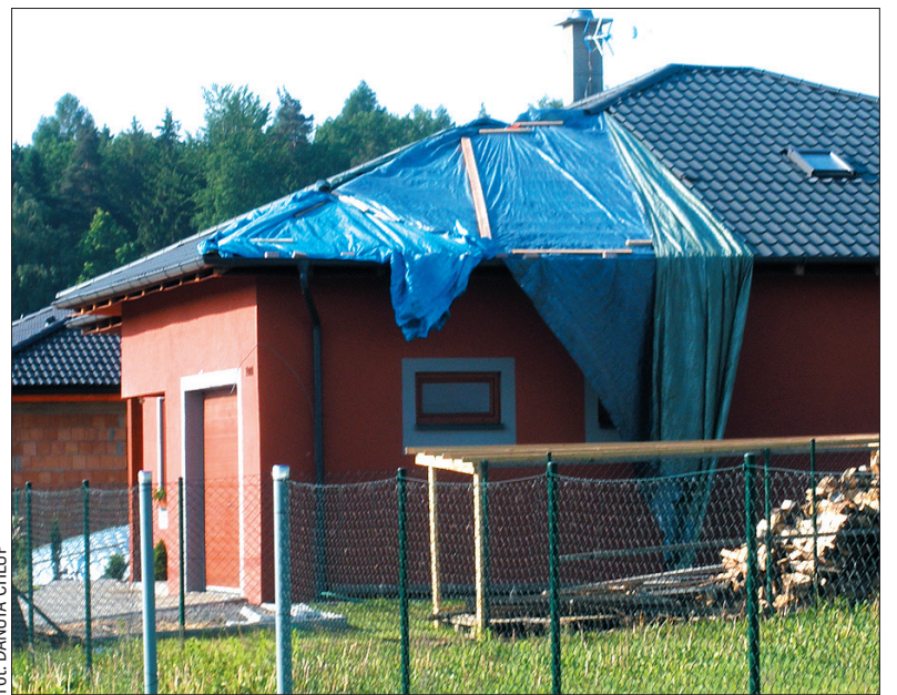
W Suchej Górnej wichura zerwała część dachu na niedawno dokończonym domu.

Na wtorek i środę meteorolodzy zapowiadają kolejne silne burze. – Do regionu cieszyńskiego dotrą one najprawdopodobniej w środę nad ranem. W nocy burze jednak zwykle słabną, więc w tym regionie nie spodziewam się katastrofalnych następstw – uspokaja meteorolog Eva Koblíhová. (dc)