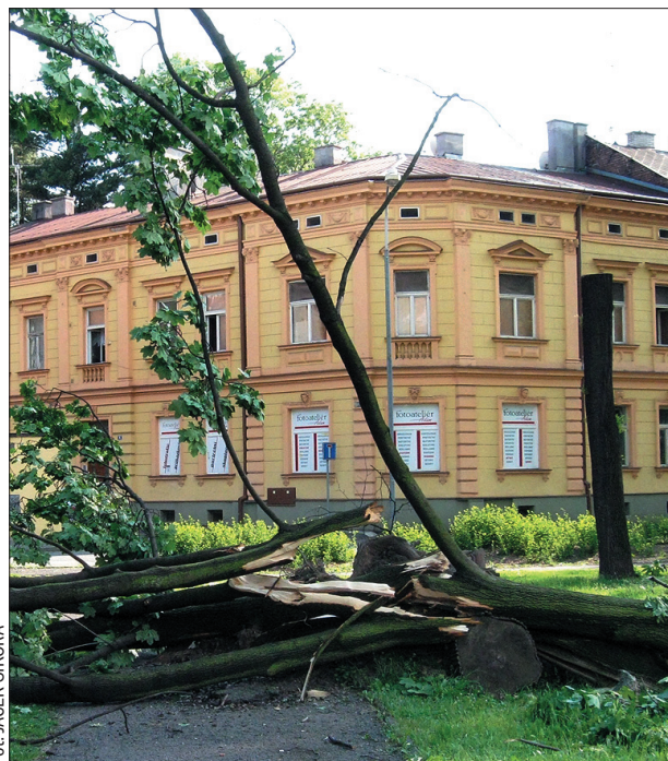
Zniszczenia w Alejach Masaryka w Czeskim Cieszynie.

Najbardziej narażone na ataki wiatru są blaszane dachy. – Widzia-