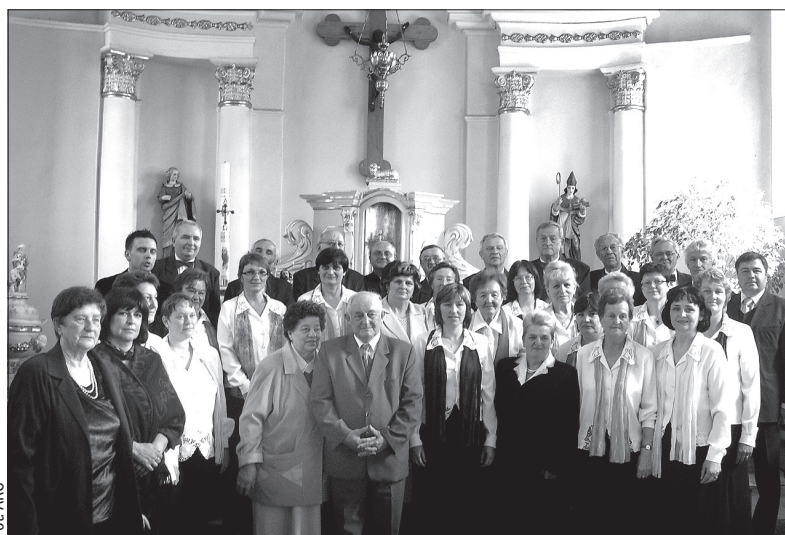
Chór „Przełęcz” ma za sobą występ w Polsce.

MUZEUM ZIEMI CIESZYŃSKIEJ, SALA WYSTAW w Cz. Cieszynie, Praska 14/3: do 31. 12. stała ekspozycja „Ratusz w Cz. Cieszynie”. Czynna wt-pt: 9-17, so: 9-13, nie: 13-17.