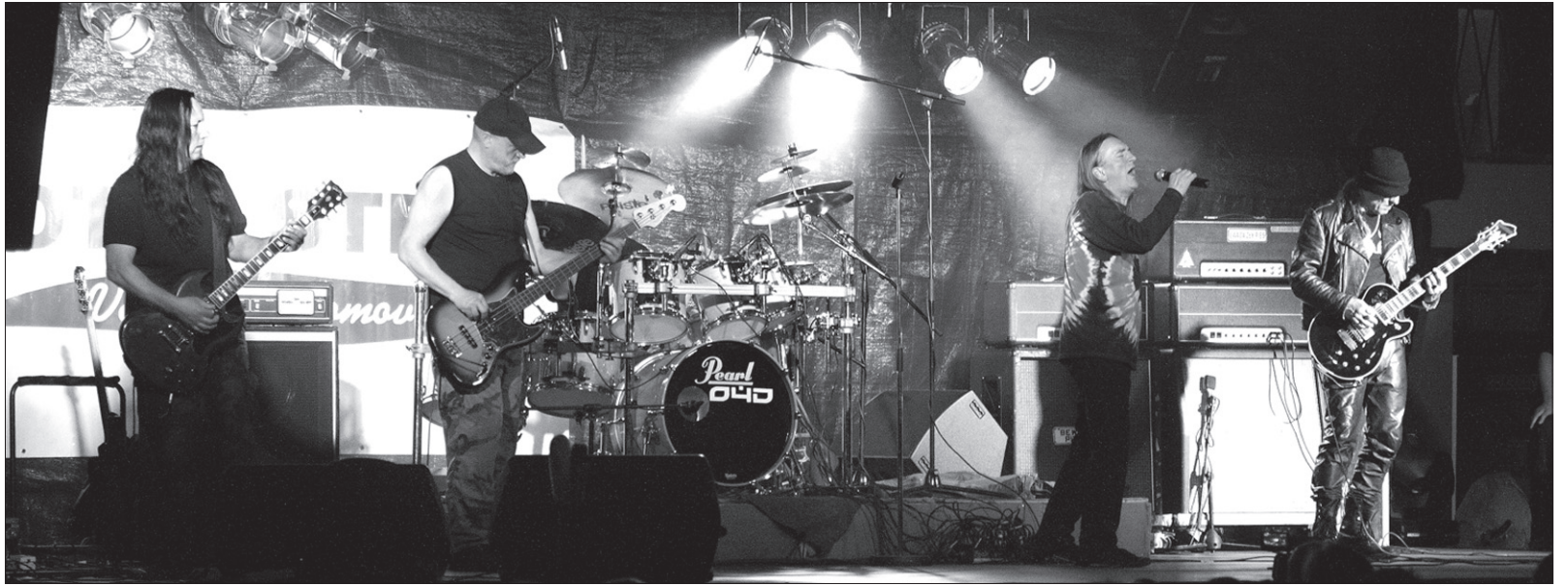
Zespół TSA – legenda polskiego rocka – zagrał na Bystrzyckim Zlocie już po raz trzeci.

O Ewie bardzo pozytywnie wyrażali się też muzycy kolejnej rockowej legendy, która przyjechała zagrać w piątek w bystrzyckim Parku PZKO, ostrawskiej kapeli Citron, która podobnie jak TSA zadebiutowała jeszcze w latach 70. ub. wieku. – Słyszałem kiedyś może dwa utwory Ewy, które komercyjne radio puszczają na okrągło. Tu, w Bystrzycy, mile mnie zaskoczyła. Wi-