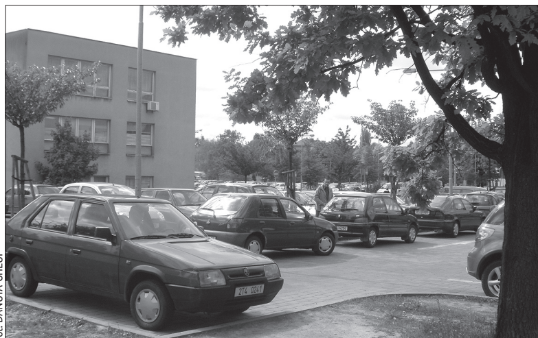
Parking przy szpitalu w Hawierzowie w godzinach porannych – jak zwykle pełny.

śnie. Kierowcy stawiają tam często wozy poza parkingiem, w miejscach, gdzie obowiązuje zakaz zatrzymywania. – W zeszłym tygodniu zdarzyło się nawet, że auta stały w dwóch szeregach przed centralną izbą przyjęć. Karetka pogotowia z trudem przedzierała się między nimi – mówi rzeczniczka szpitala, Lenka Franková. By kierowcy nie mogli się wykręcać, że nie zauważyli znaku zakazu zatrzymywania, przed izbą przyjęć zostaną namalowane znaki poziome. Kierownictwo szpitala apeluje do kierowców, by zostawiali samochody na centralnym parkingu nad szpitalem. Tam miejsc jest pod dostatkiem. Parking w kompleksie szpitalnym jest mały i służy przede wszystkim chorym, którzy ze względu na swój stan zdrowia mieliby trudności z dojeżdżeniem do parkingu centralnego. (dc)