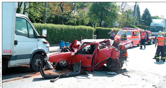
Do takiego wypadku trzeba już wzywać policję.

Kierowcy obu pojazdów powinni wzajemnie sobie pokazać dowody tożsamości i prawa jazdy, a następnie razem spisać protokół z wypadku drogowego. Ważne jest, by obaj się pod nim podpisali. – Jeżeli któryś z kierowców odmówi podania swych danych lub nie współpracuje przy sporządzeniu zapisu, należy wzywać policję. Dopuszcza się bowiem wykroczenia – mówi Vladimír Řepka. Zapis musi zawierać da-