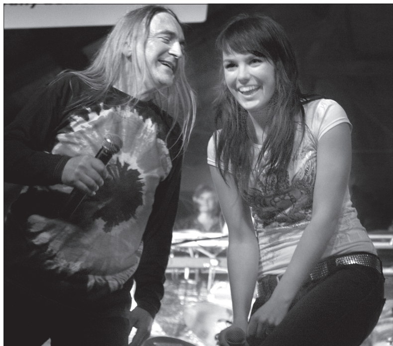
Ewa Farna zaśpiewała z liderem TSA, Markiem Piekarczykiem, utwór „Proceder”.