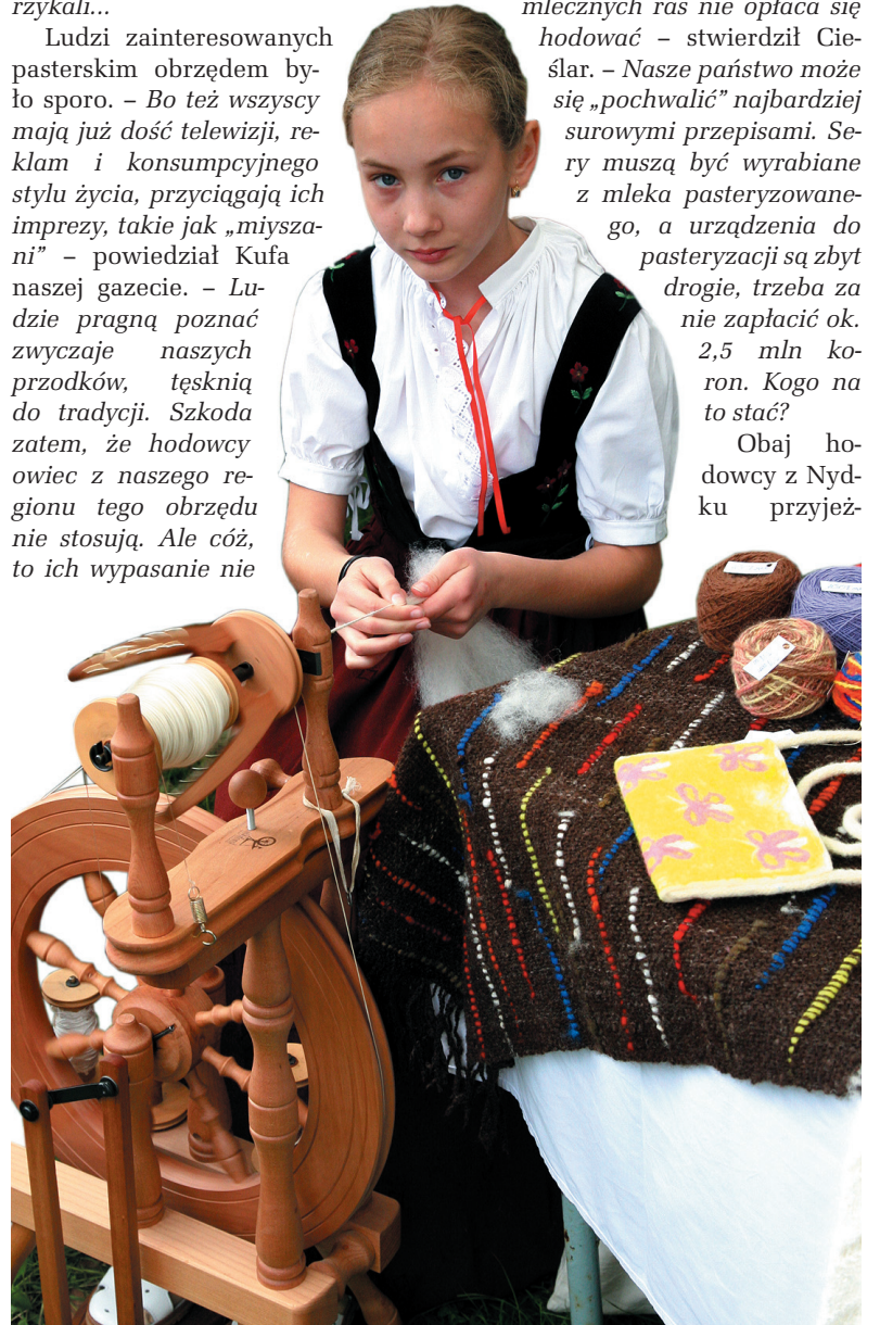
Do koszarzyckiego „Dołka” przyjeżdżają zawsze rzemieślnicy ludowi – i starzy, i młodzi.

ma już nic wspólnego z kulturą pasterską, to jest już raczej produkcja przemysłowa mięsa.