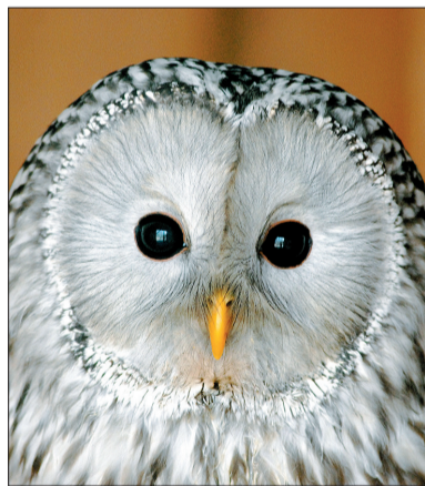
Piękny puszczyk uralski...