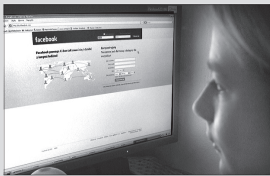
Facebook – nowy fenomen internetu.

Na koniec, w odpowiedzi na globalny wymiar omawianego tematu, wymiar lokalny. Pewnego razu rozwiązywałem quiz pt. „Jak dobrze mówisz po naszymu?”. Ku mej niezmierniej satysfakcji otrzymałem odpowiedź: „Je żeś bity gorol!”. TR