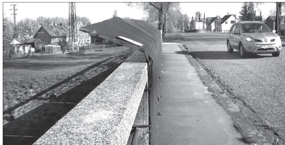
Wiadukt nad torami w Suchej Górnej pilnie wymaga remontu. Gmina będzie musiała zapłacić Zarządowi Kolejowych Dróg Transportowych kilka milionów koron za ograniczenia w ruchu.