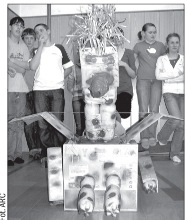
Tak wygląda „recyklosmok”, złożony z materiałów przeznaczonych do recyklingu.

Specjalna komisja wybierała najlepszego spośród wszystkich „recyklosmoków”, które stworzyły poszczególne klasy. Smok miał być zbudowany z materiałów nadających się do recyklingu, które nazbierali w domu uczniowie. Wśród klas młodszych najlepszym „recyklosmokiem” mogła pochwalić się klasa 4., a w kategorii klas drugiego stopnia zwyciężyła klasa 9 b. (ep)