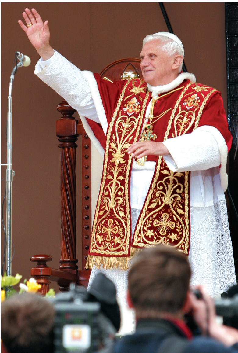
Papież Benedykt XVI odwiedził już Polskę, teraz czas na Czechy i Morawy.

Republika Czeska uważana jest za jeden z najbardziej ateistycznych krajów nie tylko Europy, ale i całego świata. Ostatni spis ludności wykazał, że ponad 58,3 proc. społeczeństwa określa siebie w kategorii agnostyków lub ateistów. Jako „wierzący” określa się 31,7 proc. społeczeństwa. Do Kościoła rzymskokatolickiego należy ok. 2 749 tys. obywateli. Z badań opublikowanych w 2003 roku wynika, że procentowa liczba katolików w RC wynosi 26,86 proc. całego społeczeństwa. W kraju istnieje 6 diecezji i 2 archidiecezje rzymskokatolickie oraz 1 greckokatolicki egzarchat. Posługę pełni: 19 biskupów, 1793 księży diecezjalnych, 520 zakonnych księży oraz 147 stałych diakonów. W seminariach międzydiecezjalnych (Ołomuniec i Praga) studiuje 143 kleryków. W domach zakonnych żyje 860 zakonników i 2123 zakonnice. (kor)