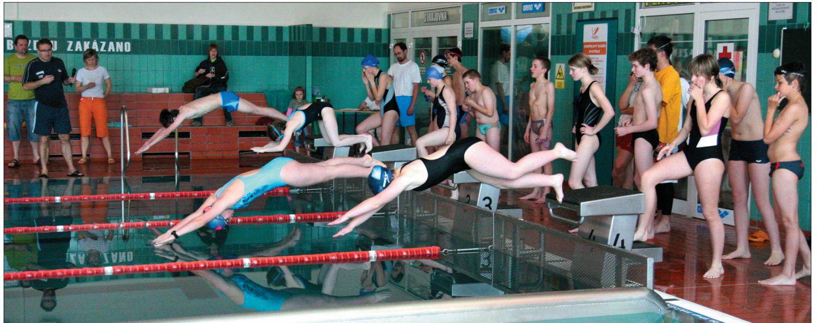
Start sztafet. Tu emocje sięgały zenitu.