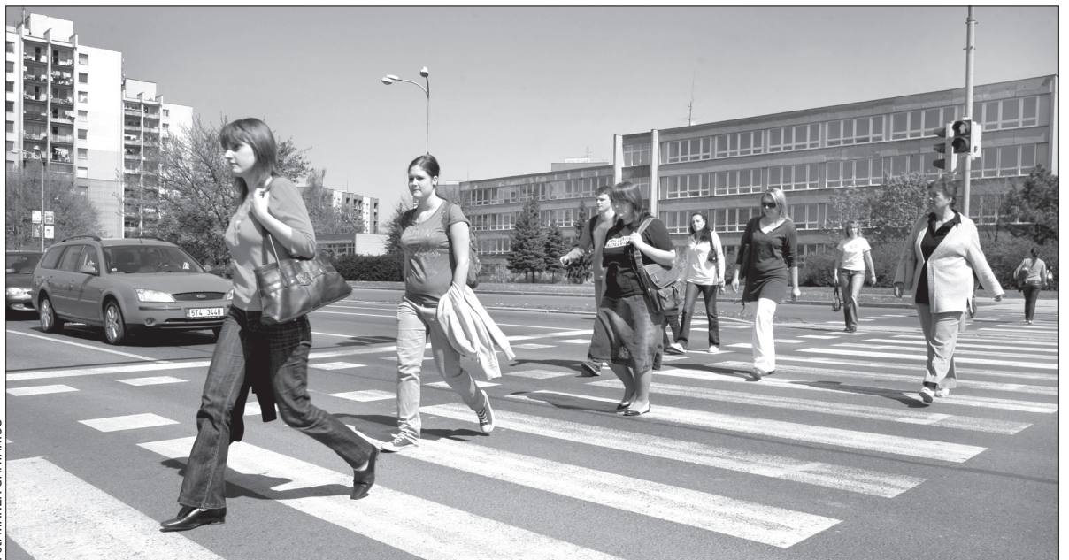
Na karwińskich skrzyżowaniach i przejściach dla pieszych będzie bezpieczniej.

dziesięciu przejść dla pieszych. W ciągu ostatnich kilku lat Karwina zainwestowała pieniądze w poprawę bezpieczeństwa na kilkunastu najbardziej niebezpiecznych przejściach. (ep)