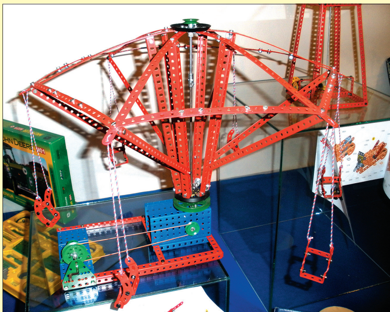
Ta karuzela naprawdę się kręci – w ruch wprawia się ją za pomocą korbki.

li dziećmi, lubili zestawy „Merkur” tak samo, jak wy uwielbiacie klocki „Lego”. Sprzedawane są zresztą również dziś. W muzeum będziecie mogli nie tylko obejrzeć pociąg, karuzelę, dźwig, wiatrak, samoloty, łodzie czy śmigłowce wykonane z „Merkura”, ale też sami spróbować coś sobie poskręcać. Panie z muzeum przygotowały dla