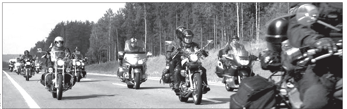
Motocykliści na historycznym szlaku.

We wtorek uczestnicy rajdu zawitają na południe Zaolzia. Obejrzą tunel w Mostach koło Jabłonkowa, gdzie padły pierwsze strzały II wojny światowej – już 25 sierpnia 1939