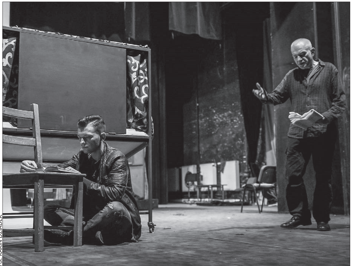
Ostatnie próby przed sobotnią premierą.