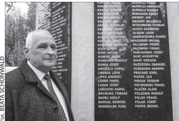
Na tablicach ofiar pierwszej wojny światowej widnieje wiele polskich nazwisk.

Karwiński pomnik ofiar z lat 1914-1918 stoi obok głównej drogi na Ostrawę. Zaledwie kilkadziesiąt metrów dalej znajduje się pomnik ofiar faszyzmu. Połączone chodnikami stanowią teraz spójną całość. – To miejsce