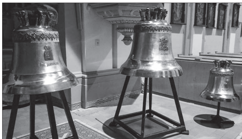
Nowe dzwony dla Suchej Górnjej dotarły we wtorek po południu do miejscowego kościoła katolickiego. Ich imiona to: św. Józef, św. Jadwiga i św. Jan Paweł II. W sobotę o godz. 10.00 zostaną uroczystie poświęcone. (sch)