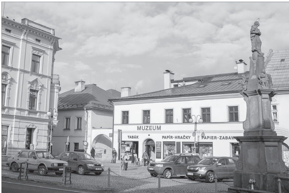
Jest szansa, że w Jablonkowie powstanie Muzeum Trójstyku (kamienica w środku).

– Dotychczasowa ekspozycja mieści się w wynajmowanych ciasnych pomieszczeniach. Jeżeli tzw. dom książęcy stanie się własnością naszego muzeum, filia w Jablonkowie