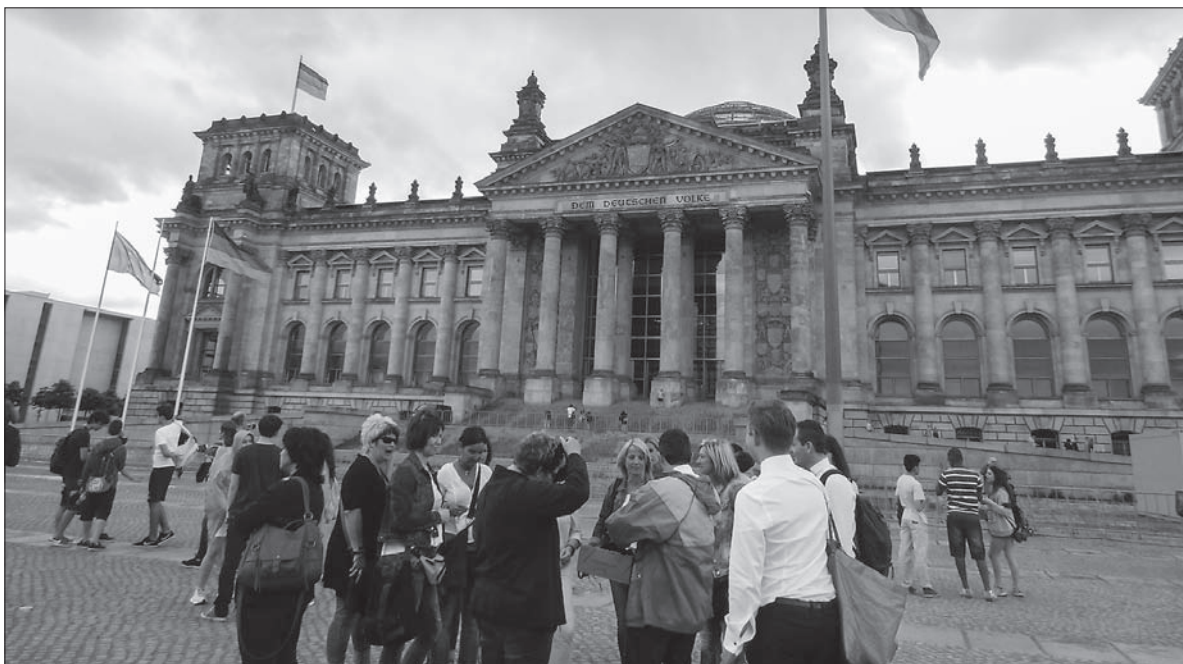
Siedziba Bundestagu w Berlinie.

Polonię interesował stosunek polityków do różnych grup budujących regionalną współpracę europejską, takich jak Czwórka Wyszehradzka czy Trójkąt Weimarski. Przede wszystkim jednak pytali o sprawy bezpośrednio rzutujące na życie Polonii. Czy migracja zarobkowa w ramach UE ma być ograniczona do tych zawodów, których nie chcą wykonywać mieszkańcy danego kraju, czy też migranci mają mieć dostęp także do zawodów z „wyższej półki”? – Oto jedno z pytań. Partie na ogół podkreślały, że swobodny dostęp do pracy w ramach EU jest jednym z podstawowych praw mieszkańców krajów członkowskich Unii i nie można tego zmieniać. Co nie znaczy, że można zamykać oczy na związane z tym problemy. Socjaldemokraci uważają, że trzeba zwalczać „dumping socjalny”, polegający na tym, że pracodawcy przyjmują chętniej zagranicznych pracowników, ponieważ ci zgadzają się na niższe wynagrodzenia. Dlatego SPD uważa, że ważny jest pewien stopień regulacji płac. Lewica podkreśliła konieczność reformy gospodarczej i społecznej w UE, dzięki której poprawiłyby się wa-