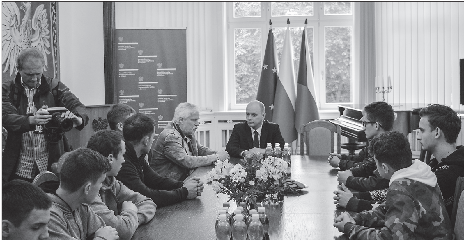
Wtorkowe spotkanie w konsulacie RP w Ostrawie.