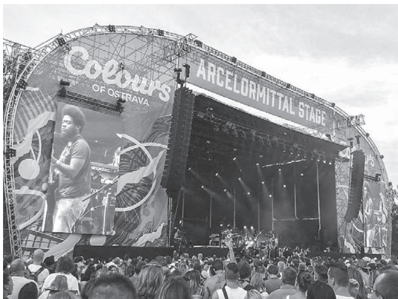
Jeden z najlepszych koncertów w tegorocznych Coloursach, Michael Kiwanuka.