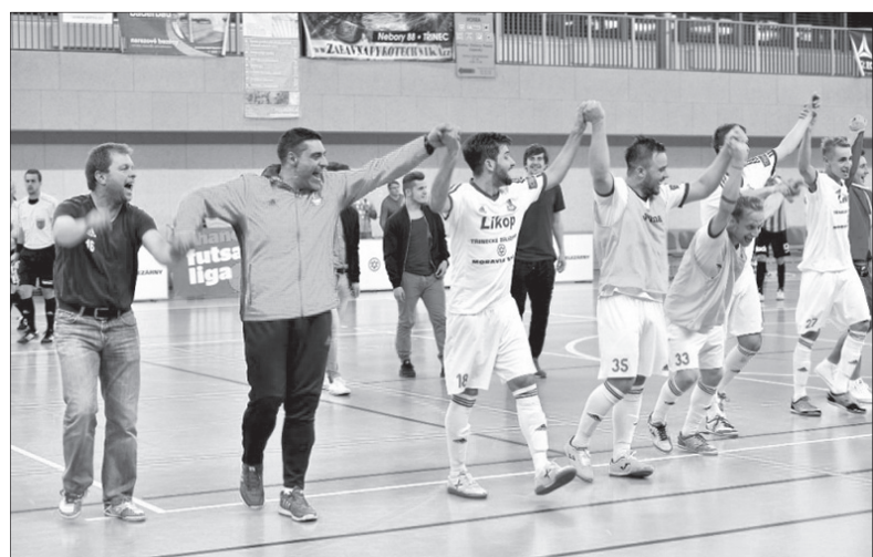
Euforia w trzynieckim zespole po uzyskaniu awansu do play off.