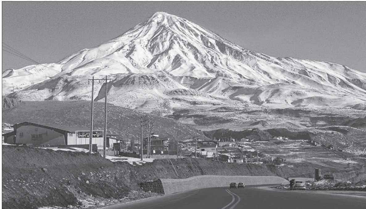
Demawend, najwyższa góra Iranu.