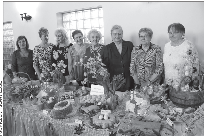
Reprezentantki PZKO Karwinia-Frysztat zdobyły jedną z konkursowych nagród.

– Stanowisko sąsiadek zza Olzy było naprawdę rewelacyjne. Wszystko nam smakowało, a hitem okazała