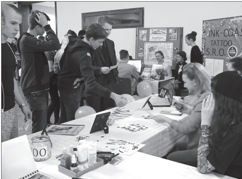
Targi uczą młodzież kreatywności.

Podczas targów uczniowie nie tylko prezentują swoje produkty rówieśnikom, ale są także oceniani przez profesjonalnych jurorów. – Ci oceniają prezentacje na stoiskach przedstawicieli firm symulacyjnych, katalog firmowy, a także prezentację stoiska. Ocenie podlega także aktywność przedstawicieli oraz sposób kontaktu z klientem. W jury zasiadają przedsiębiorcy z realnych firm, a także osoby, z którymi współpra-