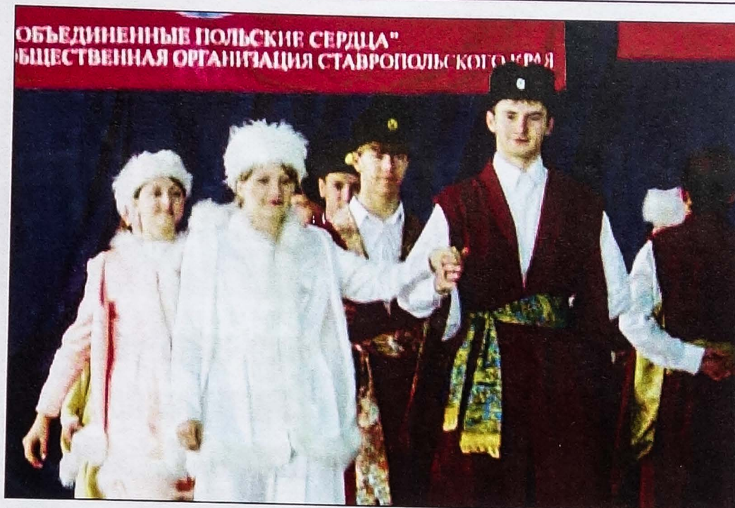
Polonez Agińskiego, kołysanki Chopina – chity Edyty Pjechi. W Żeleznowodsku "Zjednoczone Polskie Serca" obchodzili Dzień Polonii.

choreografy, którzy prowadzą polskie tańce ludowe i narodowe.