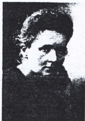
MARIA CURIE SKŁODOWSKA

EN EL CAMPO DE LA FISICA recibió premio Nóbel en el año 1903 por los trabajos sobre la radiactividad.