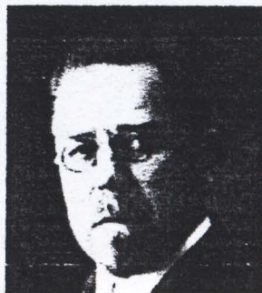
WŁADYSŁAW STANISŁAW REYMONT

(1846 – 1916) en el año 1905, por sus destacados logros en el campo de la epopeya, por su obra "Quo Vadis" – manuscrito en idioma polaco se encuentra en la Biblioteca Nacional en Varsovia.