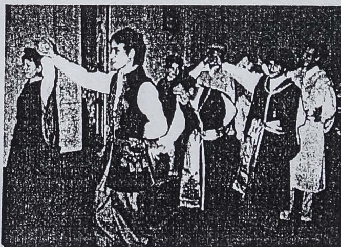
Фото: танцевальный ансамбль «Strumyk»

Как хор «Висла», так и наши гости в первой части программы исполнили польские патриотические песни, ансамбль «Струмык» – с величайшим блеском Полонез Огинского, дети – танец польских горцев. В перерывах между выступлениями Председатель Союза пан Эугениуш Суперсон