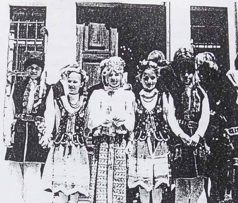
Nasi artyści po koncercie 3 Maja 1999r.