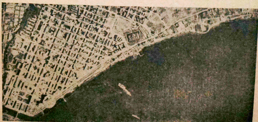
Okręt wojenny typu Cavour, który został odsunięty od brzegu, aby w ten sposób zabezpieczyć go od zatonięcia.