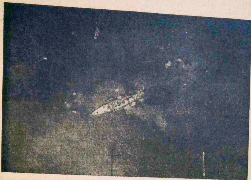
To był najlepszy włoski okręt wojenny klasy Littorio — jeden z dwóch — które wogóle były w służbie floty włoskiej, a który został poważnie uszkodzony pod Taranto. — Okręt jest otoczony mniejszymi statkami, widocznie w tym celu, aby zabezpieczyć go od zatonięcia.