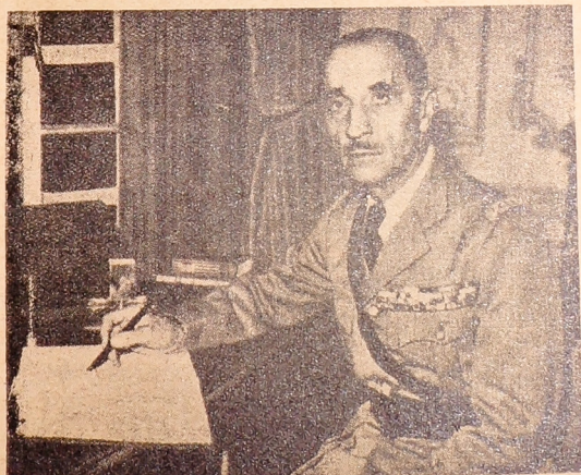
Generał Catroux, przedstawiciel Wolnej Francji na bliskim Wschodzie. (Zdjęcie ukazuje się poraz pierwszy w Palestynie w naszej gazecie.)