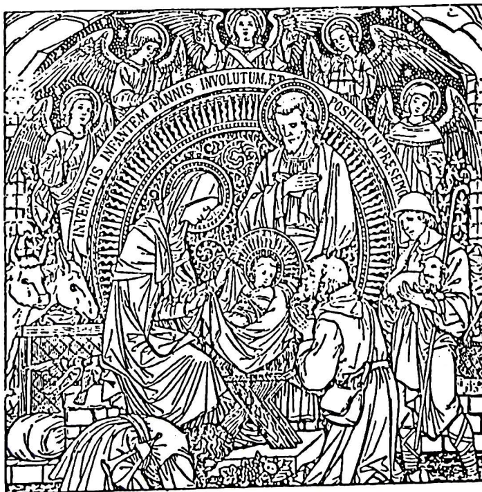
Boże Narodzenie - sztych z drugiej połowy XIX w.