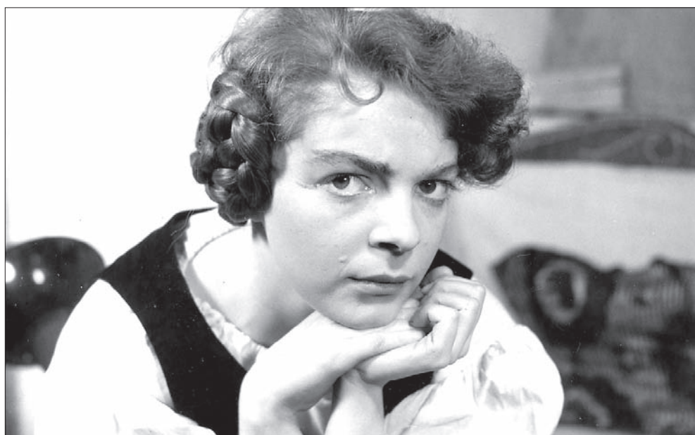
A.Fredro DAMY I HUZARY