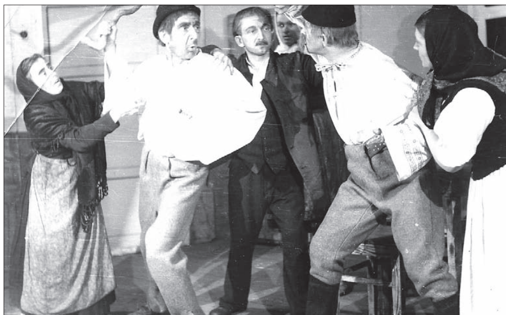
Š.Králík BUKI PODPOLAŃSKIE

22.12.1951 / REŻ. J.JANÍK W.Łysek, J.Gawlas, J.Bobek, R.Urbański