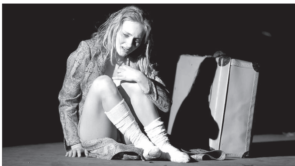
K.Čapek SPRAWA MAKROPULOS

J.Nohavica, R.Putzlacher, R.Lipus, T.Kočko TĚŠÍŇSKÉ NIEBO - CIESZYŇSKIE NEBE 16.05.2004 REŻ. R.LIPUS