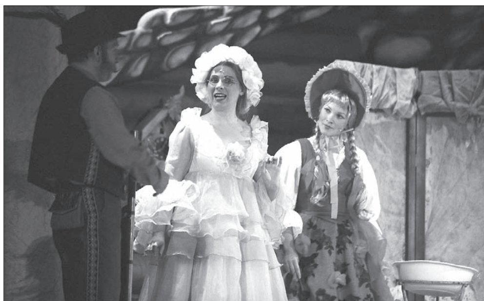
A.S.-Dobrzański POWTÓRKA Z CZERWONEGO KAPTURKA

14.10.1979 / REŻ. W. RYBICKI A.Polarczyk, E.Bobek