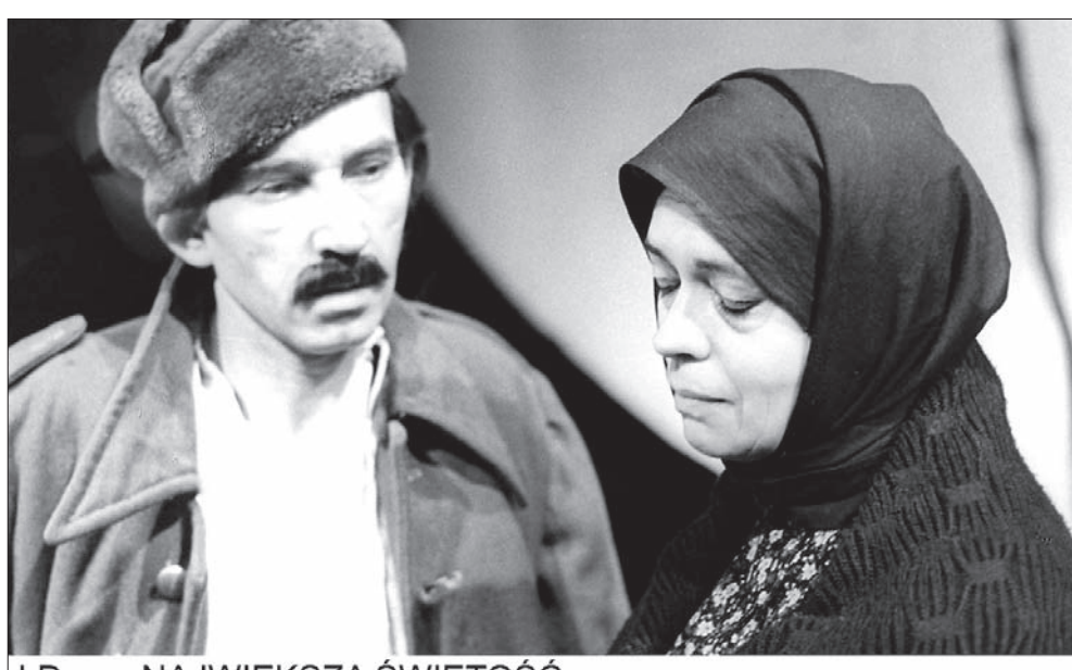
I.Druce NAJWIĘKSZA ŚWIĘTOŚĆ

2.7.1961 / REŻ. F.CHMIEL M.Szymczyk, W.Spinka