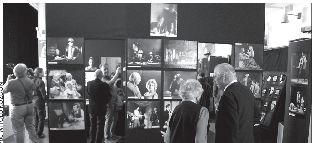
Wernisaż rocznicowej wystawy zainaugurował sobotnie obchody 65-lecia Sceny Polskiej Teatru Cieszyńskiego.

Na wystawie zaprezentowano także zdjęcia zza kulis wykonane przez Wiesława Przeczka. Fotografie powstały podczas prób do spektaklu „Rajska jabłonka”. – Aktorzy są na nich jeszcze bez kostiumów, dlatego można powiedzieć, że podpatrywałem ich w momencie, gdy nie czuli na sobie wzroku publiczności – tłumaczył Wiesław Przeczka. (wik)