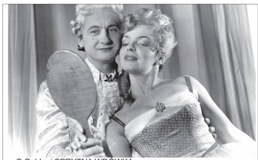
C.Goldoni SPRYTNA WDÓWKA

2.7.1961 / REŻ. F.CHMIEL M.Szymczyk, W.Spinka