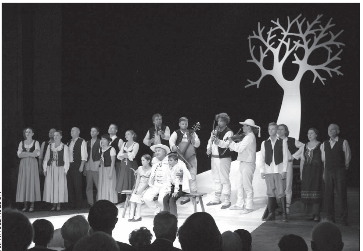
Świętowano w gronie przyjaciół.

– Jabłonka zaolziańskiej polskości wrosła swymi korzeniami w polską kulturę. Nitką naszej tożsamości narodowej, tu na Zaolziu, nie jest ani polityka, ani pieniąż. Korzeniami naszej tożsamości jest kultura polska, a wy jesteście jej głównymi no-