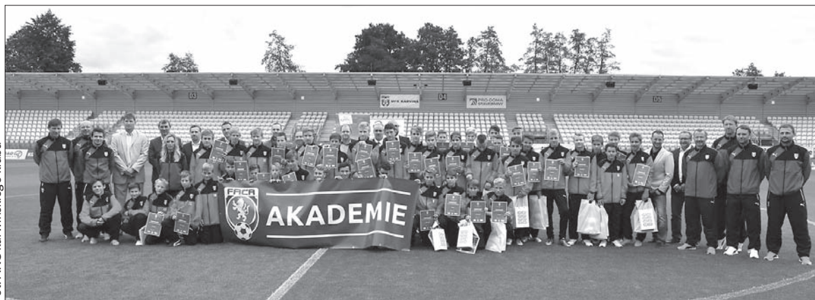
Czy wśród tych młodych piłkarzy znajdują się następcy Marka Jankulovskiego czy Milana Baroša? Przekonamy się o tym już za kilka lat.