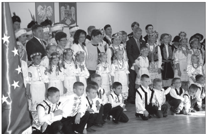
Beata Szydło spotkała się z polskimi organizacjami działającymi w Rumunii.