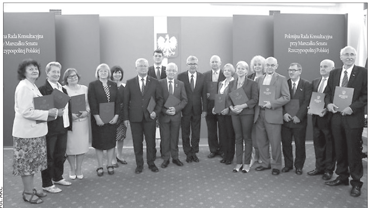
Członkowie Polonijnej Rady Konsultacyjnej.

Marszałek Senatu wyjaśnił, na czym polegać będzie budowanie wspólnoty narodowej. Będzie to wielopłaszczyznowa współpraca w wielu dziedzinach – w nauczaniu języka polskiego, kultywowaniu polskiej tradycji, oświacie, nauce, kulturze. Wyraził on zadowolenie, iż została zrealizowana obietnica wyborcza Prawa i Sprawiedliwości, a mianowicie do Senatu wróciły środki na finansowanie Polonii. Zdaniem marszałka Karczewskiego, zmiana formy finansowania była złą decyzją poprzedniego rządu, teraz jednak, kiedy te pieniądze w Senacie będą, zostaną właściwie rozdysponowane dla wspólnego dobra. Stanisław Karczewski podkreślił, że żywi wobec Rady i Polonii nadzieję, iż będą oni ambasadorami Polski i będą pra-