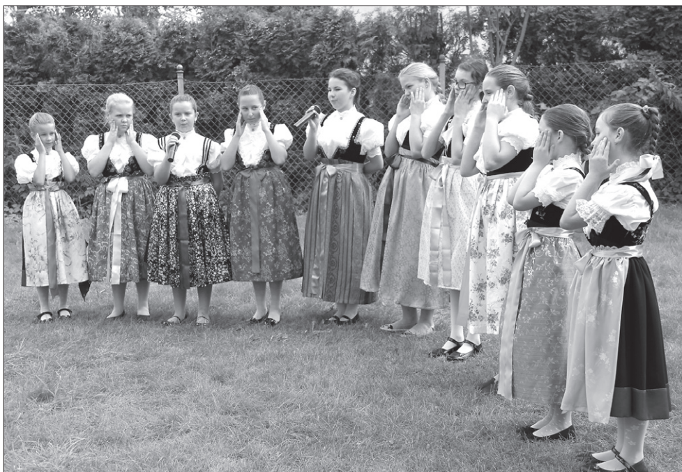
W Suchej Średniej wystąpiły „Kończaneczki” z Polski.