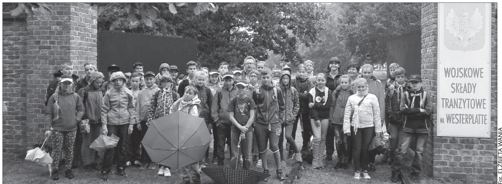
Młodzież zwiedziła Westerplatte.

W sobotę zaczęła się kolejna edycja Zielonej Szkoły nad polskim morzem. Bałtyk powitał siódmoklasistów z Zaolzia piękną, upalną pogodą. – Pomimo że poprzednią noc spędziliśmy w autokarze, to cała grupa pilnie pracowała zgodnie z zaplanowanym harmonogramem dnia. Po przyjeździe szybko rozlokowaliśmy się w pokojach, uczniowie sporządzili specjalne wizytówki na drzwi. Niektórzy „zaliczyli” już pierwszą kąpiel w morzu. Po południu wszyscy bawili się w zwia-