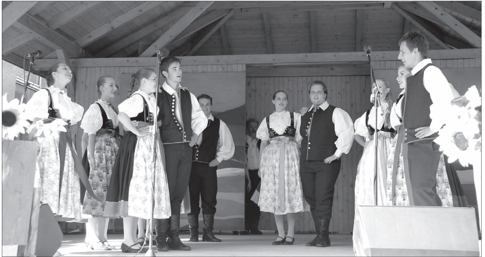
W Lesznej Zespół Regionalny „Błędowice” zatańczył i zaśpiewał.

PZKO w Lesznej Dolnej wracają co roku nie tylko miejscowi, ale także goście z bliższa i dalsza Dowodem na to byli goście związani z Gminnym Ośrodkiem Kultu-