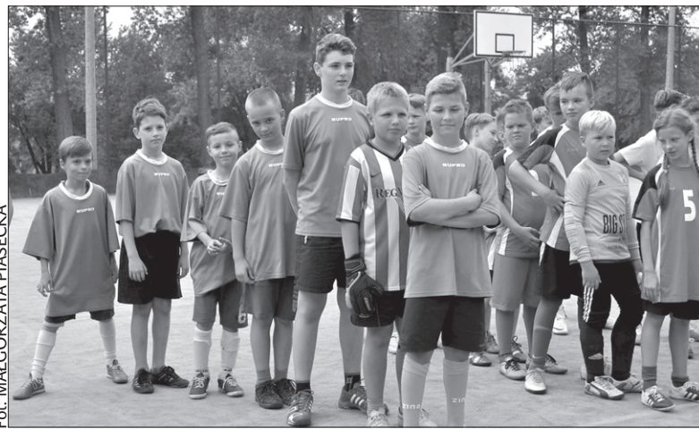
Piłkarze PSP w Cz. Cieszynie (na pierwszym planie).