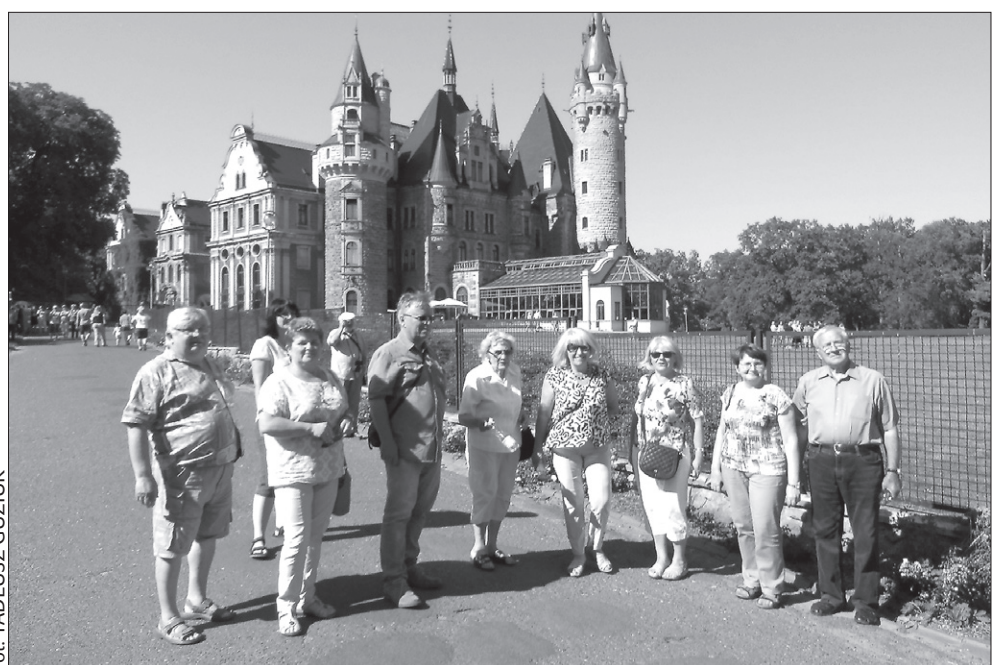
Skrzeczoniacy i grodkowianie na tle zamku Moszna.

W ramach kontynuacji współpracy pezetkaowcy zaprosili delegację TMZG na obchody 90-lecia istnienia skrzeczńskiego chóru mieszanego „Hasło”, które zaplanowano na 12 listopada w Boguminie. (D.G.)