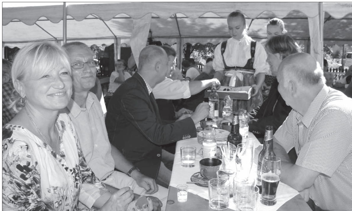
Gości częstowano chlebem i solą.