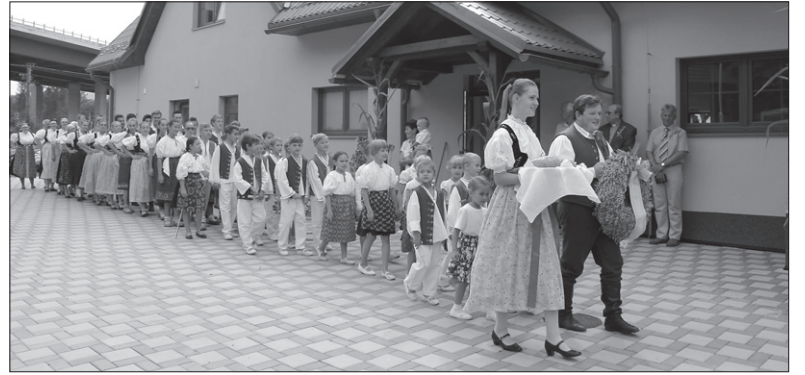
Na czele pochodu członkowie zespołu „Trzanowice” nieśli chleb i wieniec dożynkowy.

roli podjęli się z mężem już po raz drugi. – Cieszymy się, że cała wioska świętuje dziś razem, że swoje stoiska mają tutaj również inne organizacje społeczne, jak np. związek myśliwski oraz strażacy – dodała gospodyni imprezy, precyzując, że miejscowi pezetkaowcy przygotowali oprócz bogatego programu kulturalnego również pyszne placiki domowej roboty ze „szpyrkóm” i śmietaną.