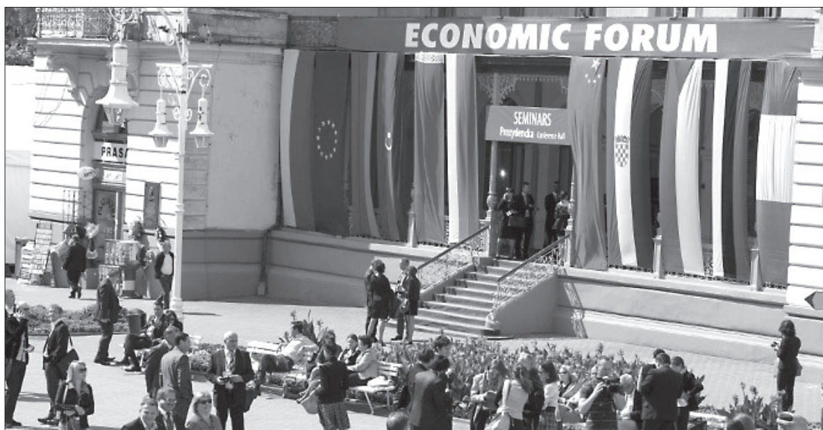
Polacy z całego świata spotykają się w Krynicy-Zdroju.

Kilkanaście tematów do omówienia stoi również przed uczestnikami Forum Polonijnego. Wychodząc