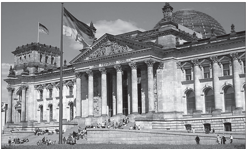
W 2015 roku Niemcy były najpopularniejszym celem imigrantów.