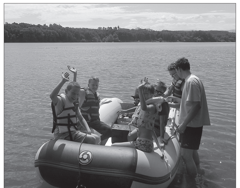
Program Małego Obozu Szkolnego zawsze jest atrakcyjny i ciekawy.