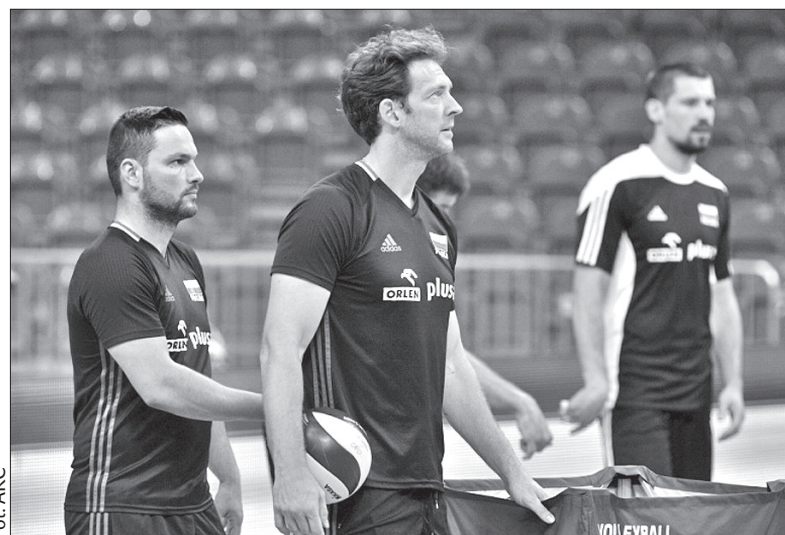
Trener Polaków Stephane Antiga uważa za faworytów turnieju Brazylię, Francję i Polskę.

Złoty medal zdobyła Brazylija. Zespół trenera Bernardo Rezende wygrał rok później Mistrzostwa Świata, a szkoleniowiec ten wielokrotnie podkreślał, że właśnie w Katowicach rozpoczął z reprezentacją serię sukcesów.