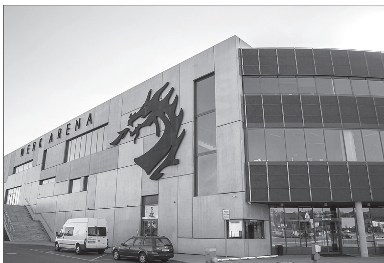
Trzynieccy kibice liczą, że WerkArena okaże się szczęśliwa dla czeskich tenisistów.

Nadchodzący ćwierćfinał będzie mogło obejrzeć w trzynieckiej Werk Arenie pięć tysięcy kibiców. W piątek mecze rozpoczną się o godz. 14.00. Sobotni debel zaplanowano na godz. 12.00, natomiast niedzielne pojedynki odbędą się od godz. 13.00. (wik)