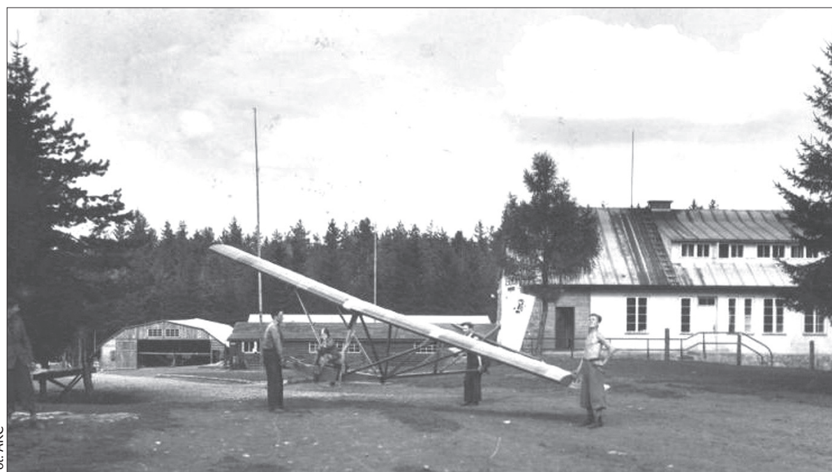
Szkoła szybowcowa na Chełmie rozpoczęła działalność 15 lipca 1934 roku.