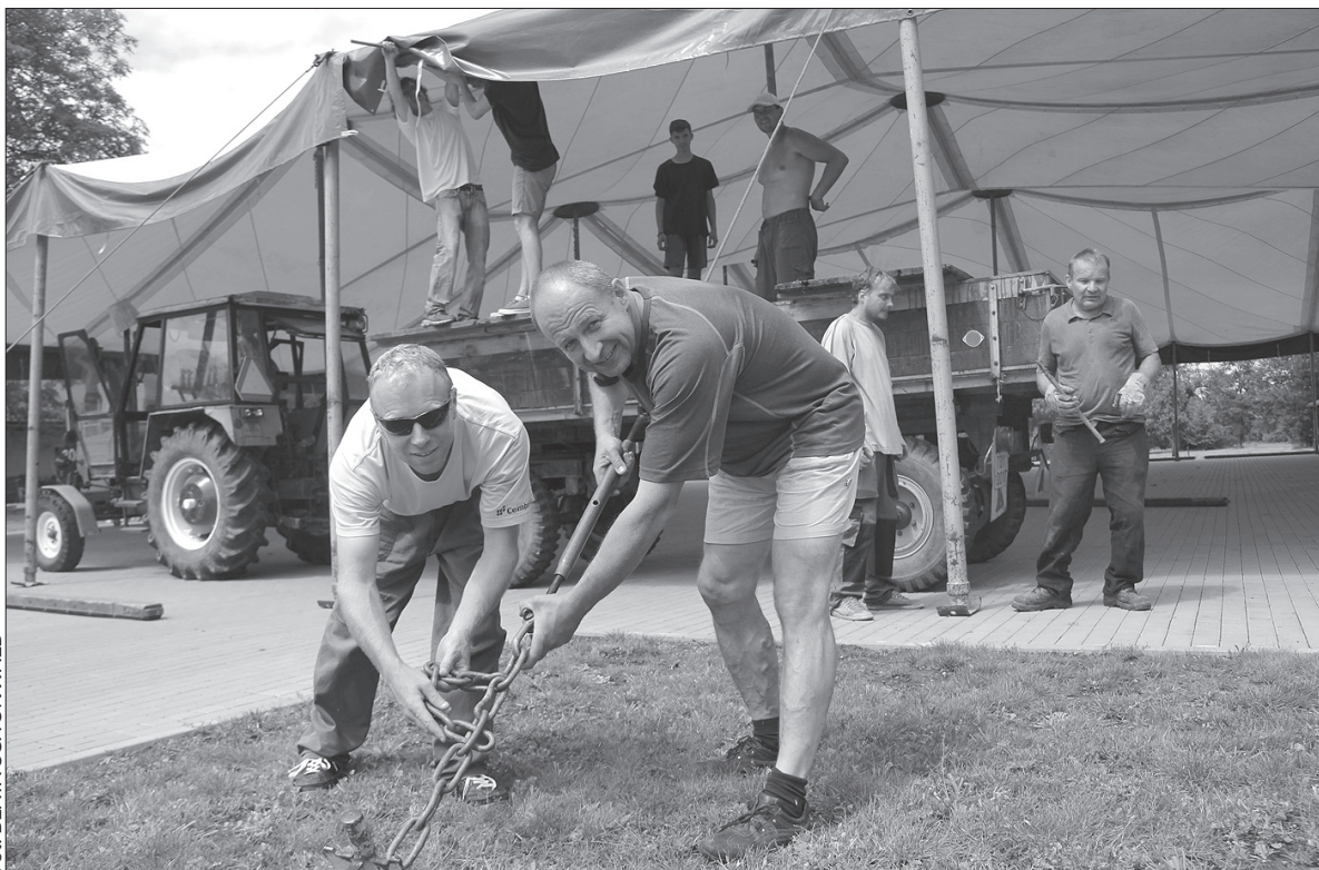
We wtorek zbudowano w Śmiłowicach namiot dla uczestników XcamP-u.

Organizatorzy, aby przyciągnąć młodzież, wybrali najlepszą z moż-