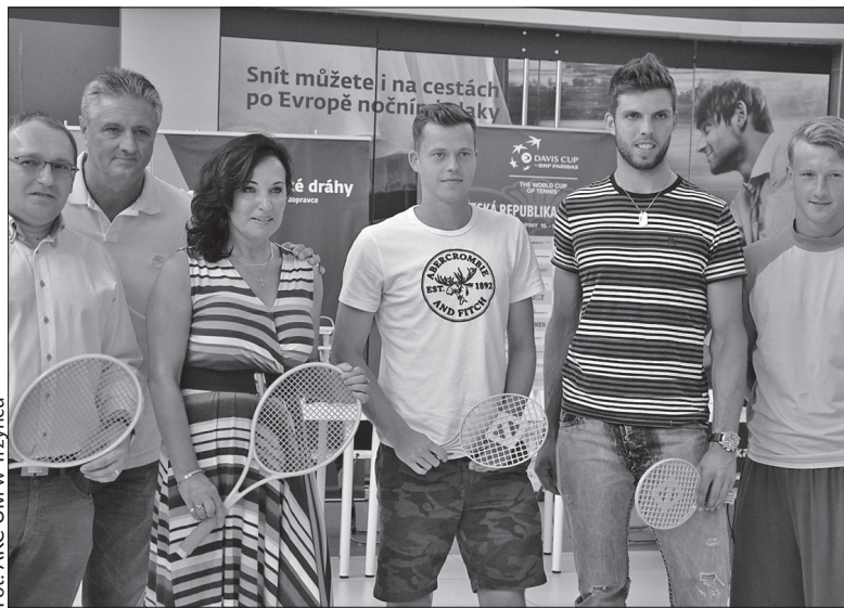
W Trzyniecu czeskich reprezentantów czekało gorące przyjęcie.

– Czekamy na występ przeciwko Francji, zwłaszcza że mamy się za co zrewanżować rywalom – stwierdził Navrátil, przypominając przegraną w