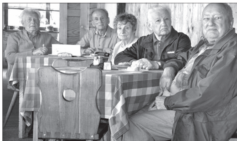
W spotkaniu na Jaworowym wzięli udział 85-latkowie.