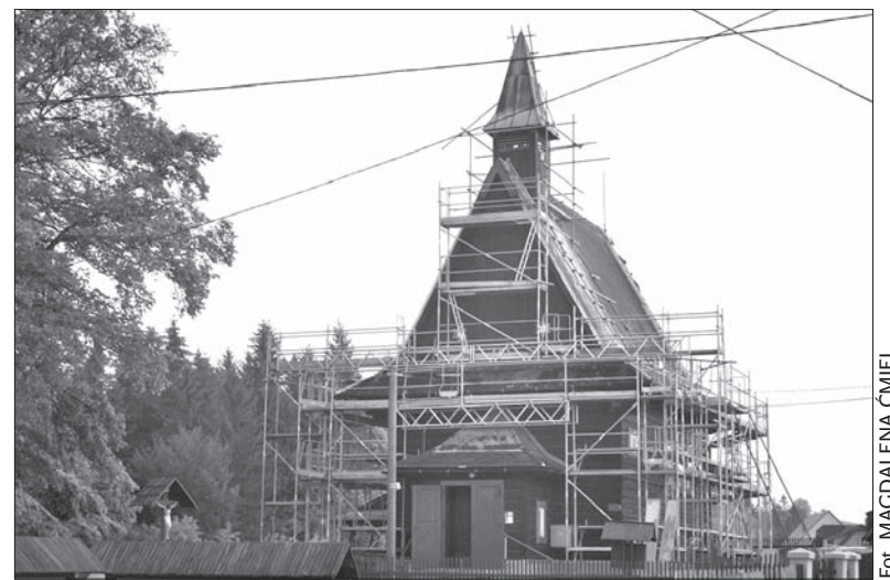
Herczawski kościół przechodzi gruntowny remont.