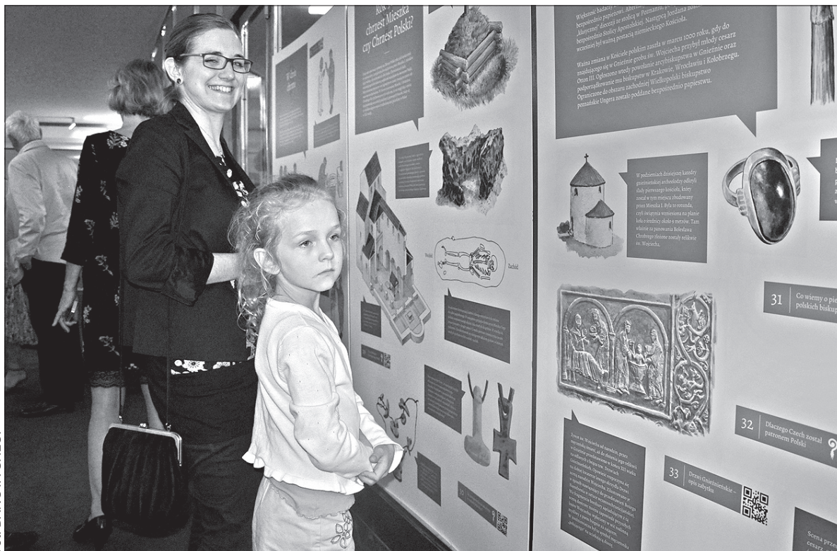
Wystawa tak została przygotowana, by zainteresowała także dzieci.