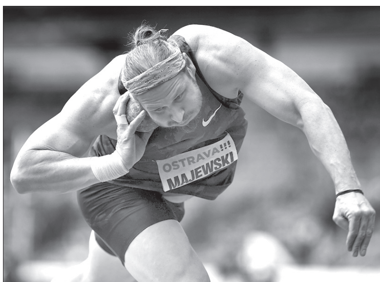
Tomasz Majewski podczas tegorocznych Złotych Kolców w Ostrawie.

skrupulatnie szlifuje formę do sierpniowych igrzysk w Rio de Janeiro, zanotował w Ostrawie lepszy wynik, niż podczas Ligi Diamentowej w Szanghaju. Rezultat 20,84 dobrze wróży przed kolejnymi startami, ale dla Majewskiego przełomem w olimpijskim sezonie będą dopiero pchnięcia powyżej 21 metrów. – Jest coraz lepiej. Czuję progresję, spokojnie nastawiam się na ostatnie w karierze igrzyska, bo dopiero tam znacznie się prawdziwa rywalizacja – powiedział „Głosowi Ludu”. Wielki miłośnik kawy i literatury fantastycznej potrafi połączyć życie sportowego koczownika z życiem prywatnym jak mało który polski sportowiec. – W kawiarni potrafię się szybko wyciszyć, zapomnieć o problemach. Tak samo podczas lektu-