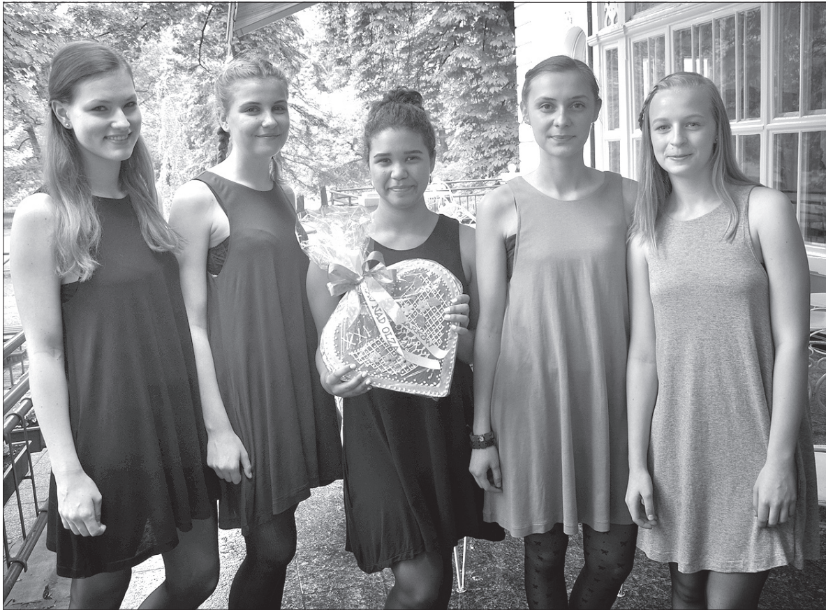
Zespół dziewczęcy „NO NET” z festiwalowym sercem z piernika.

Ostatni koncert był przeglądem różnych gatunków muzycznych. W pierwszej części popołudniowego programu koncertował „Salónni orchester” z Ostrawy, zaproszony przez dyrekcję uzdrawiska. Zespół, który w dużej mierze tworzą młodzi muzycy, zaoferował słuchaczom wiele znanych kompozycji, a swój występ zakończył polką i „Marszem Radetzkiego”. W drugiej części programu, przygotowanej przez PZKO, wystąpiły polskie zespoły z Karwiny. Najpierw zaprezentował się dziecięcy zespół folklorystyczny „Gizdy”, działający w Polskiej Szkole Podstawowej we Frysztacie. Po folklorze przyszła kolej na inny rodzaj muzyki w wykonaniu dziewczęcego zespołu wokalnego „NO NET”. Tworzą go przeważnie nastolatki z Karwiny, uczennice podstawówki i czeskokieszyńskiego gimnazjum. W ich repertuarze piosenki polskie przeplatają się z angielskimi. Finał należał z kolei do połączonych karwińskich chórów PZKO. Chór męski „Hejnał-Echo”, żeński „Kalina” i mieszany „Lira” zaśpiewały razem „Walczyk karwiński”, „Hej tam, w dolinie”, a swój występ i cały tegoroczny festiwal zakończyły „Ojcowskim domem”.