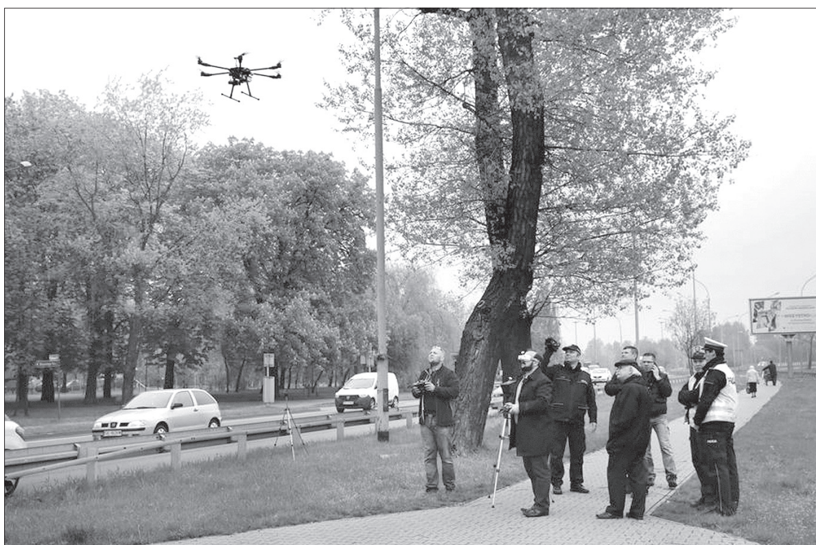
Taki dron już wkrótce będzie postrachem na Śląsku Cieszyńskim.

W czasie, gdy nad głowami pieszych i kierowców latał dron, policyjny patrol oddalony od miejsca