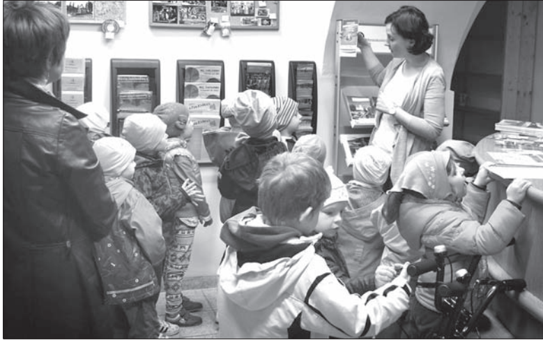
Fot. MAGDALENA ĆMIEL

Każdy chyba lubi podróżować i doświadczać nowych przeżyć. Wycho- dzimy w góry, zwiedzamy zabytko- we miasta lub odwiedzamy muzeum. Te miejsca położone są nieraz setki, a nawet tysiące kilometrów od naszego domu. Warto jednak nie zapominać o skarbach znajdujących się w najbliż- szej okolicy. Uważacie, że znacie swo- ją gminę lub miasto doskonale? Że w naszym regionie nie ma ciekawych miejsc? Jeśli chodzą wam po głowie takie myśli, to wybierzcie się do naj- bliższego Centrum Informacji Tur- ystycznej, tak jak dzieci z przedszko- la w Jabłonkowie. W ubiegły czwar- tek, wraz ze swoimi nauczycielkami, grupka przedszkolaków odwiedzi- ła Jabłonkowskie Centrum Informa- cji, mieszczące się niedaleko miejsc- owego rynku. Każdą tego typu placów- kę bardzo łatwo znaleźć, gdyż ozna- kowana jest najczęściej białą literką „i” na zielonym lub niebieskim tle. Do takiej placówki z całą pewnością war- to wejść, ponieważ każdy, bez wzglę- du na wiek, znajdzie tu coś ciekawego. – Witam was serdecznie miłe dzieci. Cieszę się, że nas odwiedziliście. Za- wsze, kiedy będziecie szukać informa- cji na temat interesujących miejsc w Jabłonkowie i jego okolicy, to zapu- kajcie do naszych drzwi. Naszym ce- lem jest m.in. wskazywać turystom i