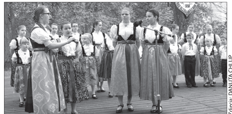
Dziecięcy zespół „Kończaneczki” z Zebrzydowic zaprezentował folklor cieszyński.

– Kiedyś mieszkałam w Darkowie, po drugiej stronie Olzy. Już bardzo dawno, jeszcze nim zaczęto organizować „Maj nad Olzą”, w parku przy uzdrowisku odbywały się koncerty. Pamiętam, że mój dziadek lubił na nie przychodzić. Teraz przyjeżdżamy z mężem na koncerty na rowe-