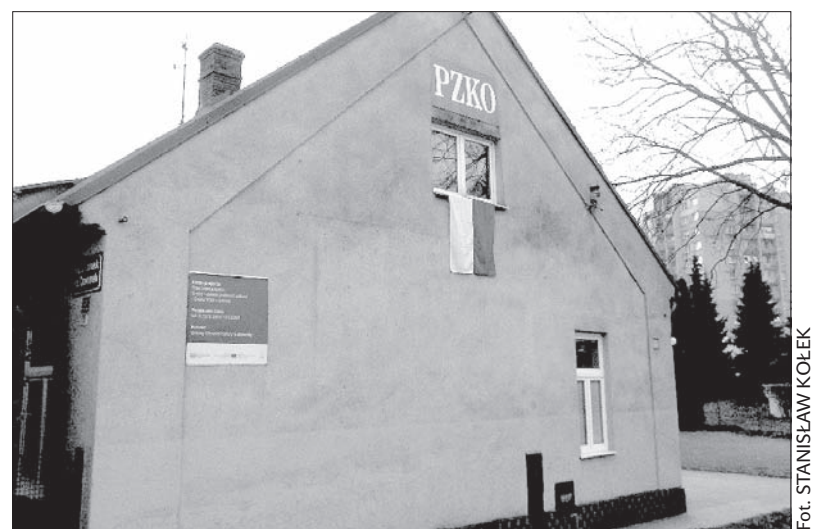
Tak wczoraj wyglądał Dom PZKO w Sibicy.