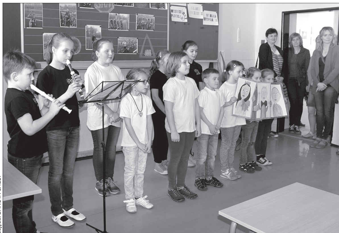
Impreza połączona była z Dniem Otwartym szkoły.

Ciekawość obecnych wzbudzał sportowy punkt programu, zapowiadany jako mecz unihokeja pomiędzy drużyną uczniów a reprezentacją Papui Nowej Gwincei. Mało kto chyba wierzył, że prawdziwi Papuanecy przyjadą do Błędowic, wobec czego każdy był ciekaw, kto tak naprawdę stanie w szranki z uczniami? Okazało się, że za groźnych ludożerców przebrali się panowie z Błędowic. Dzieci nie przelękły się mocnych rywali i pokonały ich wynikiem 17:12. (dc)