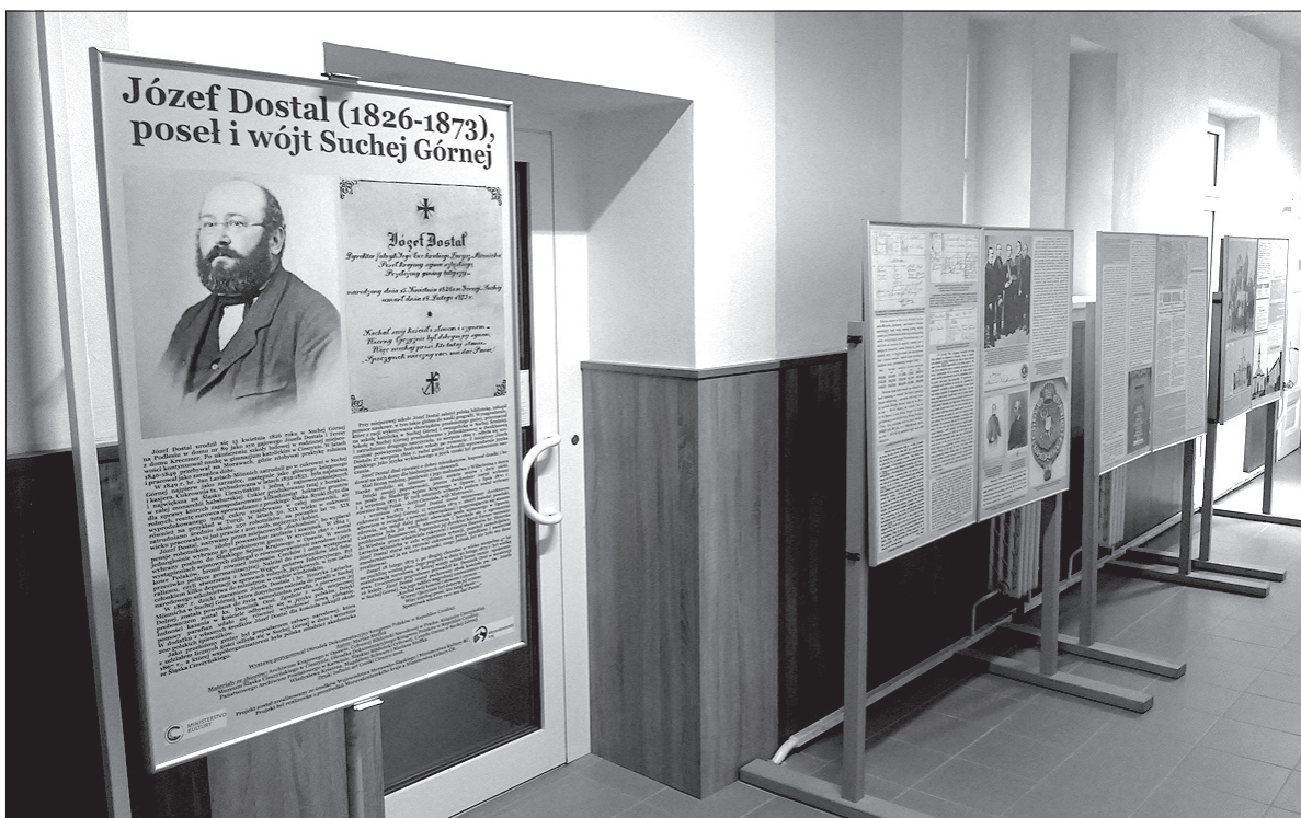
Wystawę o Józefie Dostalu można zwiedzać do 6 czerwca.