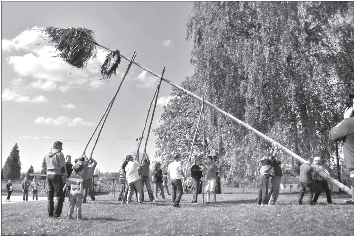
Koło polskiej szkoły w Błędowicach postawiono Moja.

W ogrodzie szkolnym przy polskiej podstawówce w Hawierzowie-Błędowicach spotkali się w sobotę po południu uczniowie wraz z rodzicami, nauczycielami i sympatykami szkoły. Okazją było „stawiani Moja” połączone z Dniem Otwartym.