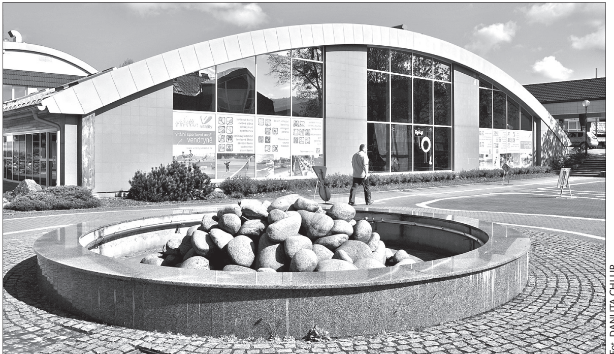
Bystrzycki basen stał się przedmiotem sporu pomiędzy byłym wójtem a aktualnym kierownictwem gminy.