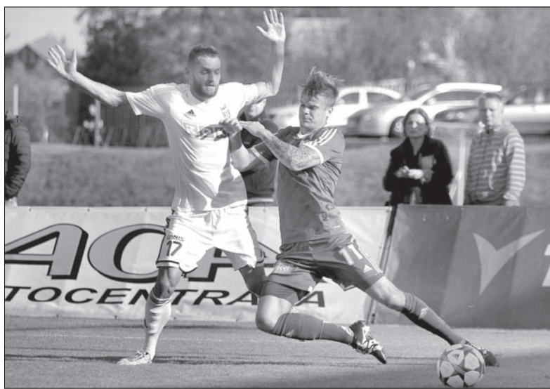
Karwina uporata się z rezerwami Sigmy.

Jedni płaczą, inni świętują. Pilzno, które w sobotę pokonało Ostrawę 2:0, może świętować zdobycie mistrzowskiego tytułu. Dla zachodnioczeskiego klubu to czwarty złoty medal w historii. Banik przegrał na boisku mistrza z podniesionym