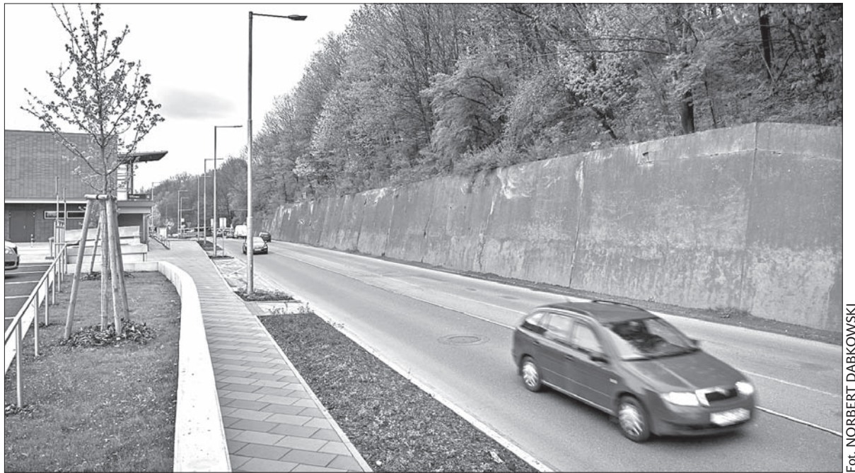
Szpecący mur doczeka się remontu.