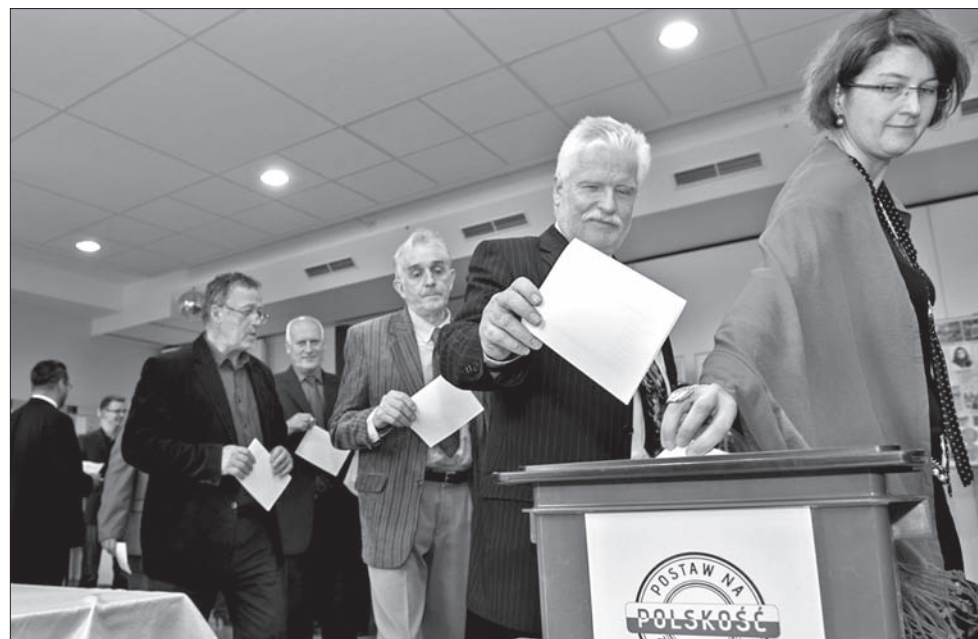
Jeden z ważniejszych punktów obrad – wybór Rady Kongresu.