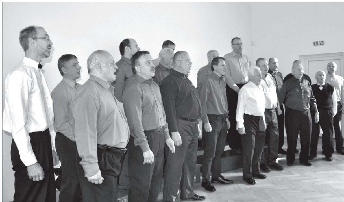
Panowie z „Hejnał-Echo” zaśpiewali w kolorowych koszulach.