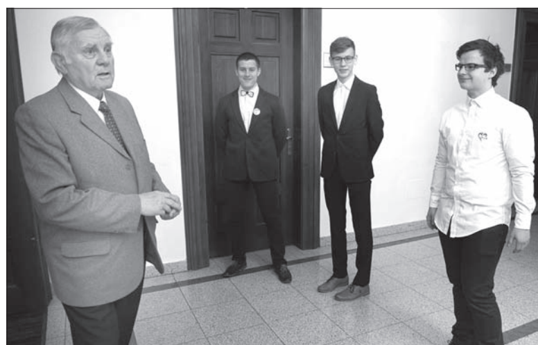
Pomocą podczas Zgromadzenia Ogólnego służyli delegatom uczniowie Polskiego Gimnazjum im. Juliusza Słowackiego w Czeskim Cieszynie.