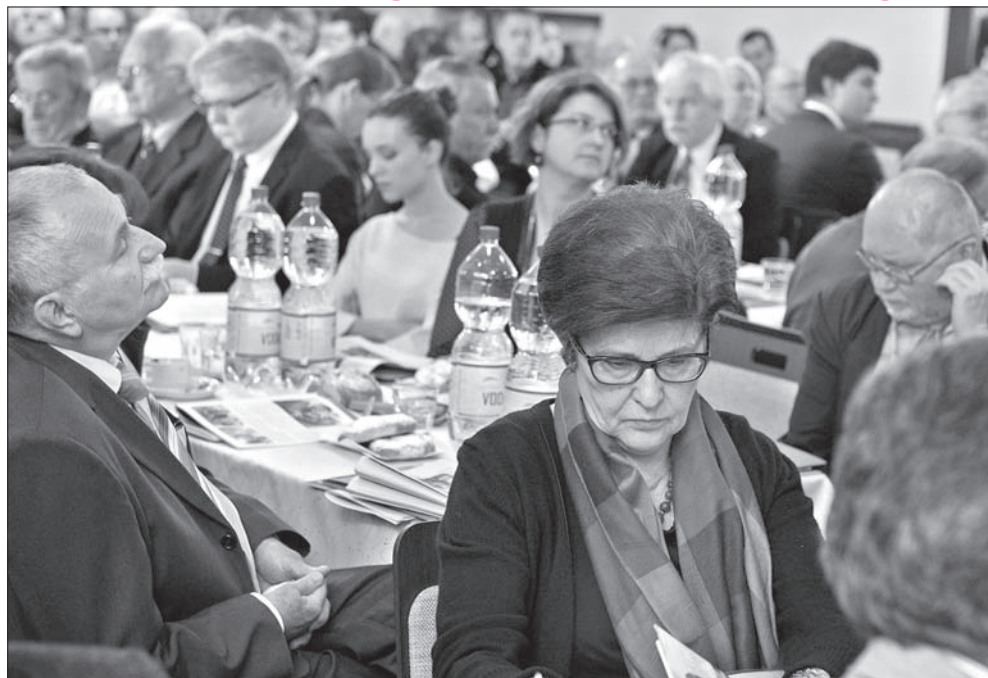
Na Zgromadzenie Ogólne przyjechało wielu ważnych gości, m.in. Grażyna Bernatowicz, ambasador RP w Pradze.