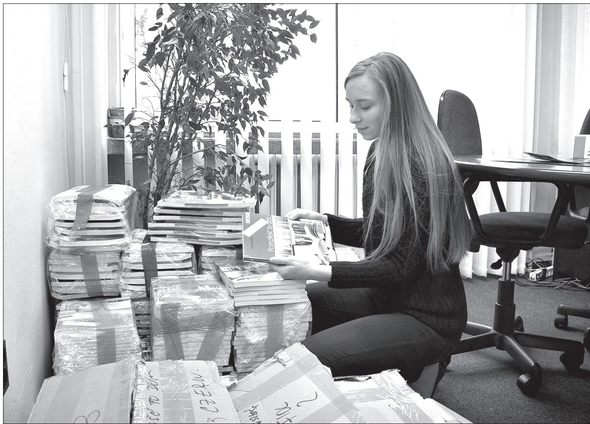
Dostawa podręczników z Polski dotarła we wtorek do Polskiego Gimnazjum w Czeskim Cieszynie.