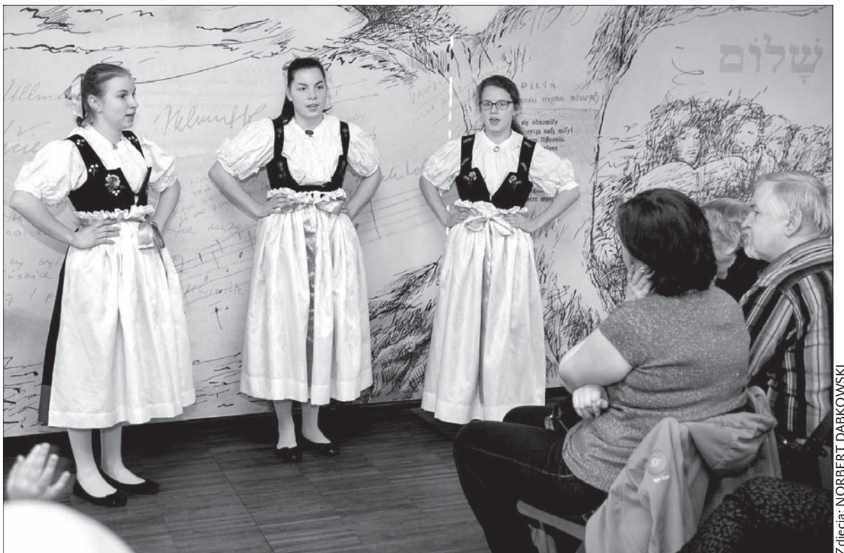
Uczennice polskiej podstawówki w Czeskim Cieszynie pokazały klasę.

z polskich i czeskich podstawówek z Czeskiego Cieszyna. Uczestnicy zmierzli siły w sześciu kategoriach wiekowych, śpiewali po dwa utwory, każdy z nich miał dwie zwrotki. – Pierwszy utwór ma być wykonany a capella, drugi może być zaśpiewany przy akompaniamentie – mówiła Sárka Klimoszová z DDM, prowadząca imprezę. Poza tym istniała możliwość występu nie tylko solo-