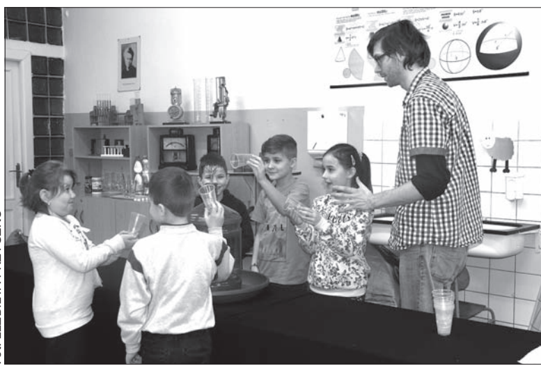
Balon w domowych warunkach? To całkiem proste!

– Chcicie zobaczyć sztuczkę? – pytali przed każdym eksperymentem młodzi fizycy. Szybko okazało się jednak, że to nie żadne magiczne sztuczki, ale... zdumiewające prawa fizyki. Dzieciaki mogły wspólnie z prowadzącymi wprawić w ruch rakiety, skonstruować własną fontannę czy nadmuchać balon. – Czy rakietę z plastikowej butelki polecą w niebo tak samo jak rakietę kosmiczną? – zastanawiano się w trakcie pokazu. Mechanizm działania w zasadzie jest taki sam, ale oczywiście prawdziwa rakietę musi dostać o wiele większego „kopa”. A czy wiecie, jak zrobić balon w domowych warunkach? W Lutyni widzieliśmy to na własne oczy, więc teraz podpowiadamy: wystarczy worek na śmieci, kawałek rurki i porządna suszarka do włosów.