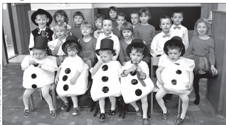
Występ gródeckich dzieci podczas Spóźnionego Koncertu Życzeń.

Starsze dzieci zaprezentowały wierszyki podkreślające, jak ważną rolę w ich życiu odgrywają babcie i dziadkowie. Usłyszeć można było m.in. o tym, że babcie lubią dzieciom śpiewać, chłodzą im głowę podczas gorączki i zawsze czekają na nie z otwartymi ramionami. Opisując dzieciństwo dziadków, dzieci wypukliły, że pomimo braku komputerów czy klocków Lego, dawne zabawy ich dziadków były wesołe. Uśmiech oraz gorące brawa były dowodem na to, że widownia była zachwycona. Występy małych recytatorów przeplatane były tańcem i śpiewem, do którego