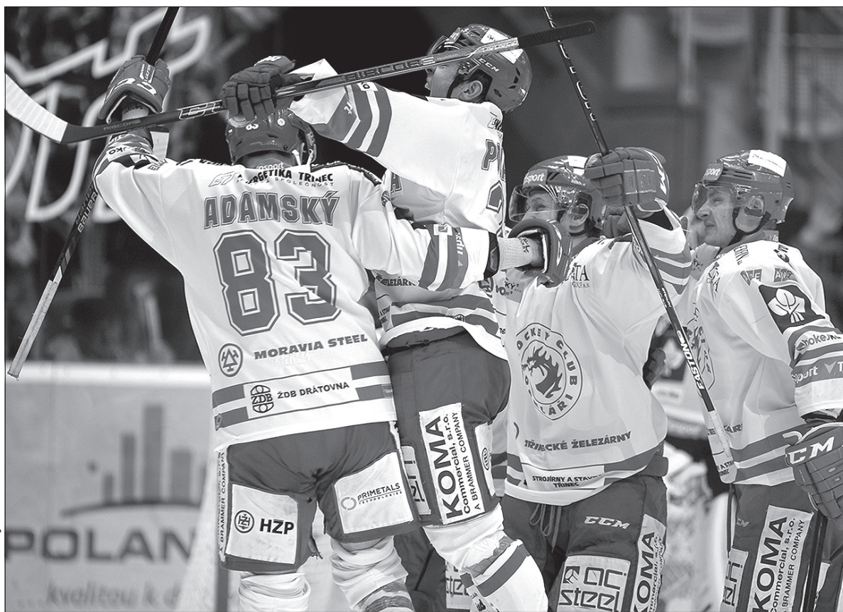
Tak cieszą się Stalownicy. Powody do radości po wygranej z Litwinowem były oczywiste.

Pięć kolejek pozostało do końca rundy zasadniczej Tipsport Ekstraligi hokeja na lodzie. W puli nagród jest piętnaście punktów, przegrać zaś można szansę na udział w fazie pucharowej rozgrywek. Stalownicy Trzyniec po niedzielnym zwycięstwie z Litwinowem (3:0) obronili dziewiątą lokatę, dziś jednak powalczą o nią w bezpośredniej konfrontacji z Kometą Brno plasującą się oczko niżej. Na krawędzi fazy wstępnej play off znajdują się po weekendzie Witkowice, które w niedzielę pokonały Mładą Bolesław (5:3), zaś dziś zmierzą się u siebie ze Zlinem. Atmosfera robi się coraz gorętsza, ważne jednak, by nie