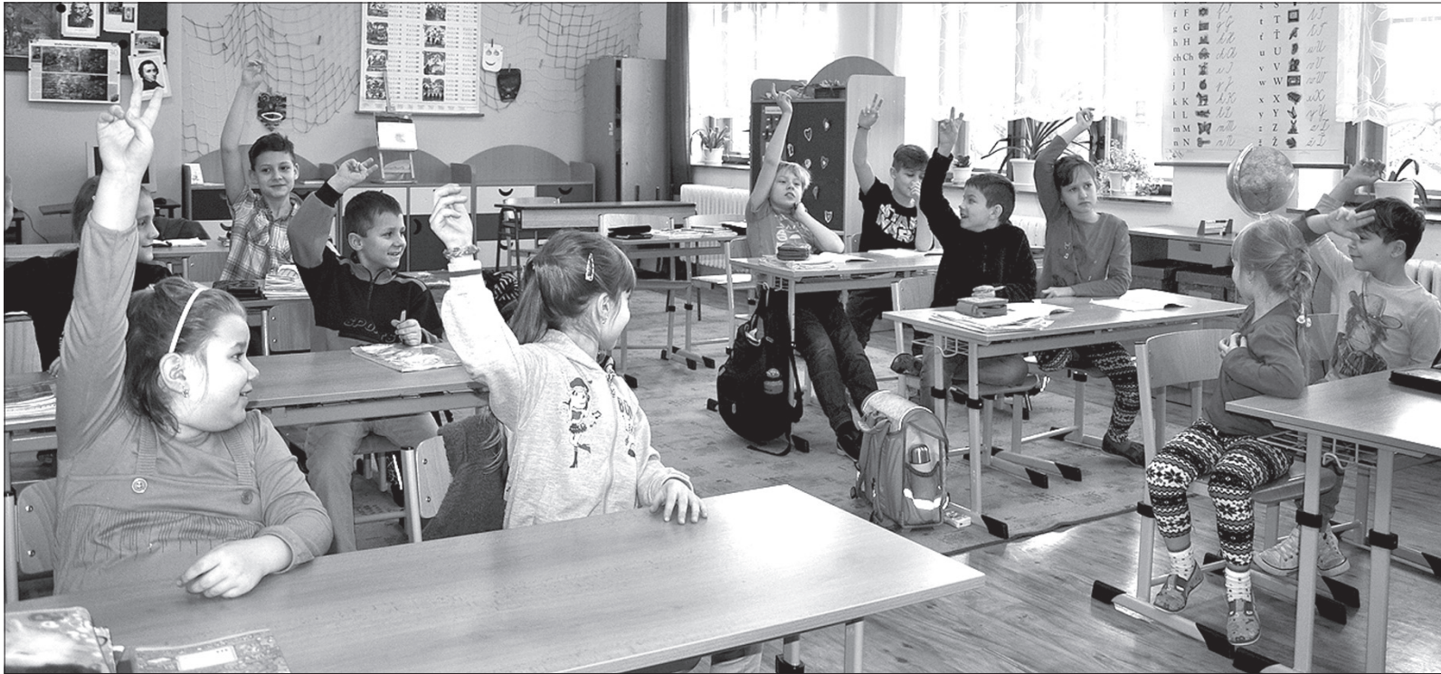
Teraz uczniowie klas 1.-5. polskiej szkoły w Lutyni Dolnej uczą się w jednej klasie. Od września będą się uczyć w dwóch.

Polskiemu szkolnictwu na Zaolziu udało się pobić nowy rekord. Na przyszły rok szkolny zostało zapisanych do klas pierwszych polskich szkół podstawowych 275 dzieci. Nawet po odliczeniu kilku odroczeń obowiązku szkolnego to ciągle o ponad 30 dzieci więcej, niż wynosi liczba tegorocznych pierwszoklasistów. Dzięki temu w niektórych placówkach po wakacjach zostaną otwarte nowe klasy.