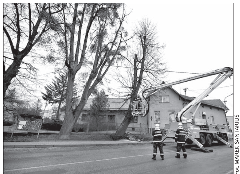
Wycinka starych drzew rozpoczęła się w czwartek.