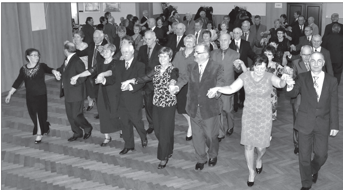
Bal wędryńskich seniorów był tradycyjnie udany.