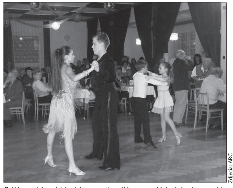
Próbkę swoich umiejętności zaprezentowali tancerze z klubu tańca towarzyskiego „Flodur”.