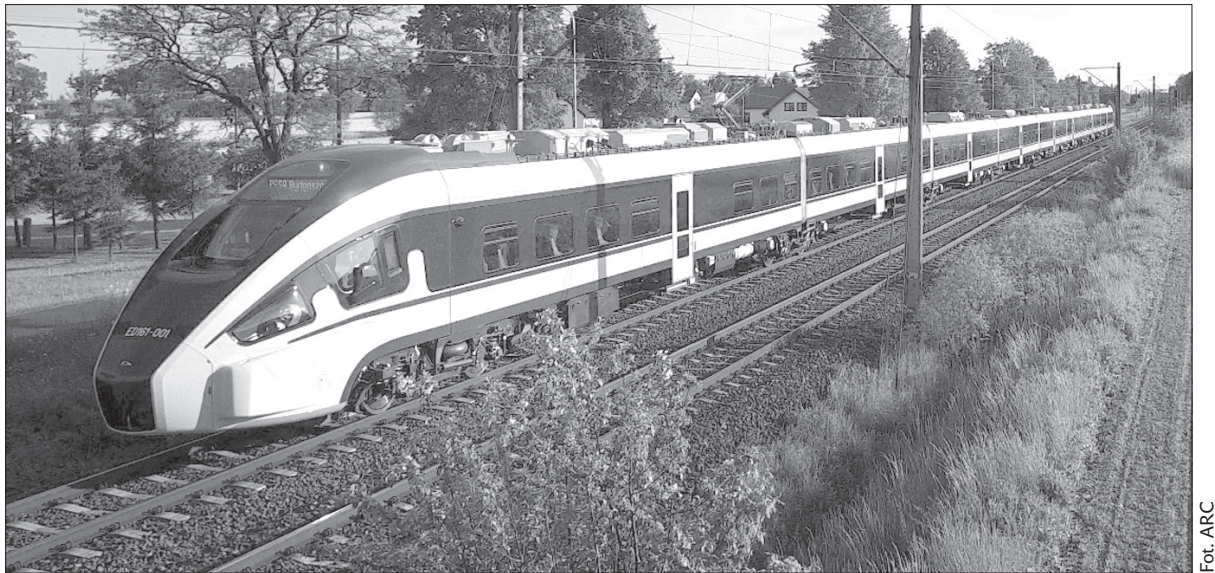
Pesa zachwyca na świecie...

Dart to pierwszy wyprodukowany w Polsce elektryczny zespół trakcyjny o standardzie Inter City. Składy mają 153 m długości. Posiadają 352 miejsca siedzące – 292 w drugiej i 60 w pierwszej klasie. Pociągi stworzone przez bydgoską Pesę dzięki swym charakterystycznym opływo-