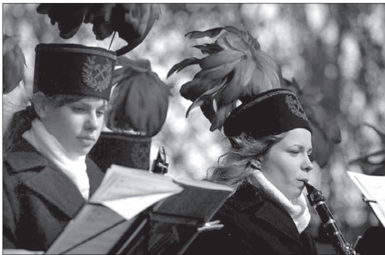
Katowice to również tradycje górnicze w muzyce.