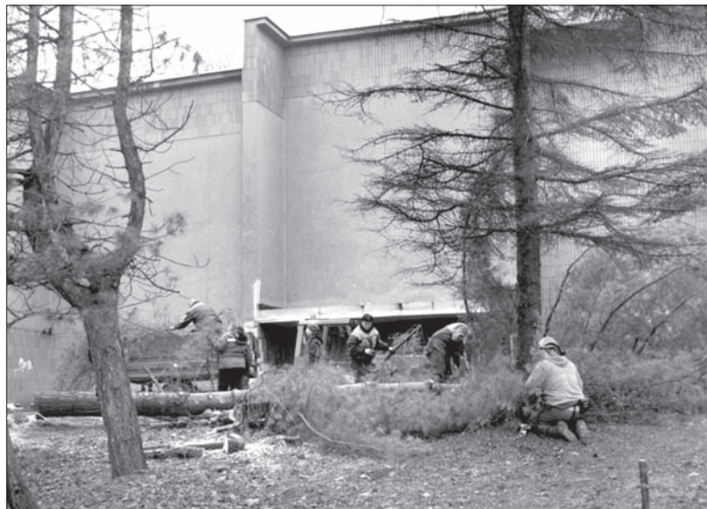
W Orłowej trwa wycinka drzew.

drologów, stan zdrowia większości z nich nie jest zadowalający. Kierownictwo ratusza zapewnia, że projekt rewitalizacji rynku i okolicy przewiduje posadzenie nowych roślin. – Zostanie posadzonych 80 drzew i prawie 8 tys. krzewów. Zostaną one posadzone na głównym placu, którego ozdobą będą 22 drzewa i 865 krzaków, kolejne drzewa zostaną posadzone na placu przed urzędem i domem kultury oraz w parku miejskim – wyjaśnił burmistrz Tomáš Kuča. (dc)