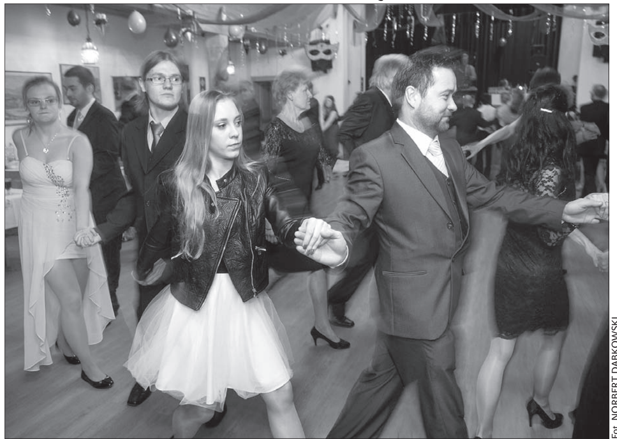
Bal papuciowy w Jabłonkowie.

Wyróżnikiem „Balu Papuciowego” w Jabłonkowie jest konkurs na najlepsze kaptcie. W tegorocznej prezentacji i tańcu konkursowym