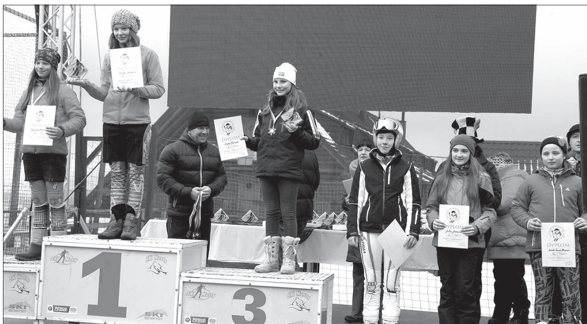
Na podium dziewczyny w kategorii klas 6-7.