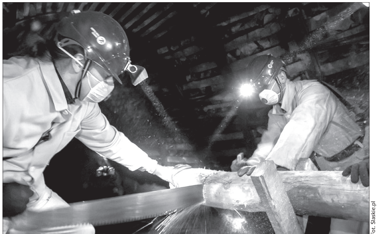
Kopalnia Guido w Zabrze sięga coraz głębiej i uruchamia trasę dla osób spragnionych solidnej porcji wrażeń.

szej rezerwacji. Każdy z uczestników wyjątkowej górniczej szychty przed zjazdem do nieczynnych od lat wyrobisk otrzyma ubiór ochronny: sztygarski strój, flanelową koszulę, gumki, hełm i lampę ułatwiającą przemieszczanie się w mrocznych korytarzach. Wędrówka po najgłębszych zakamarkach kopalni zajmuje jej uczestnikom ok. 3 godzin, w trakcie których czeka na nich wie-