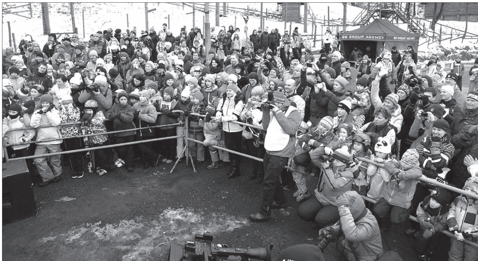
Miłośnicy sportów zimowych na uroczystym apelu.