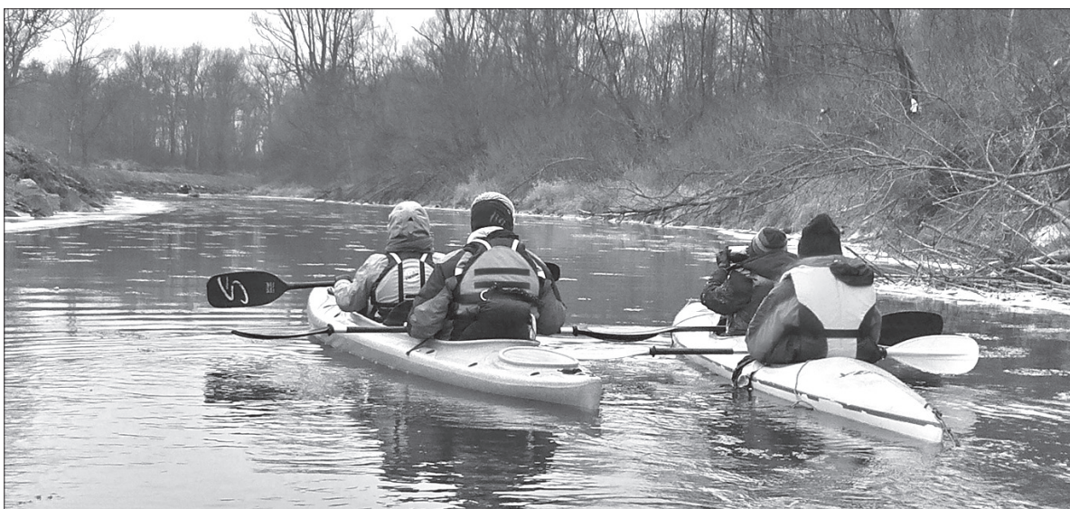
Trasa spływu liczyła niespełna 8 km.