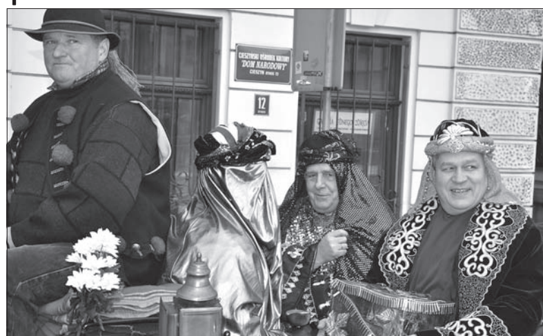
Wczoraj przez ulice ponad 400 polskich miast przeszły Orszaki Trzech Króli. 6 stycznia był świętowany także na ulicach Cieszyna. Główna impreza na Rynku rozpoczęła się po godz. 13.00 i cieszyła się ogromną popularnością. (wot)