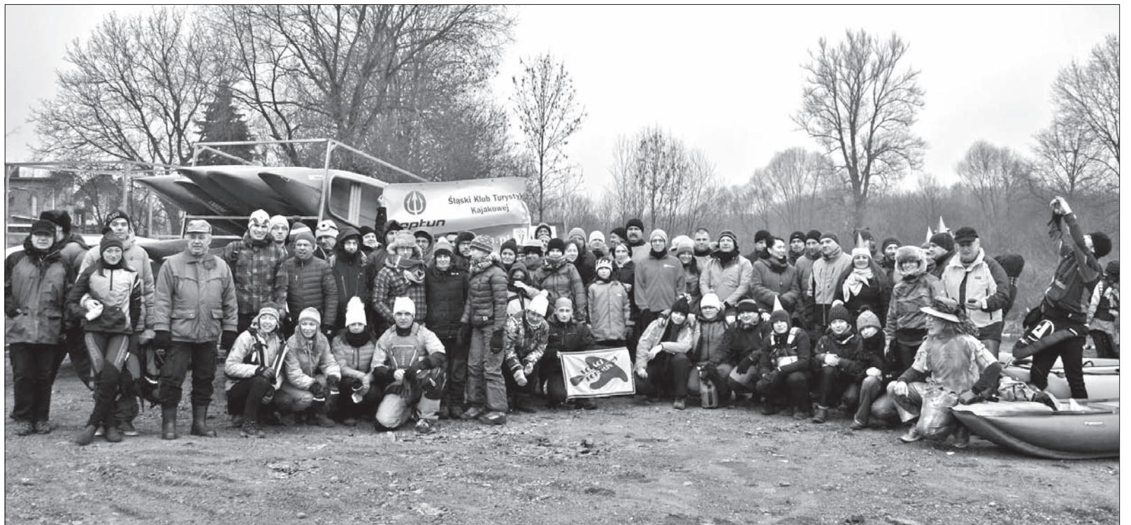
Na starcie spływu w Wierzniowicach.

doczekać gorącej herbaty. Wyciągamy kanadyjkę z wody i wyciągamy w górę, gdzie czekają już samochody. Następuje pakowanie łodzi – najbardziej mroźna chwila dnia, trzęsę się jak osika.