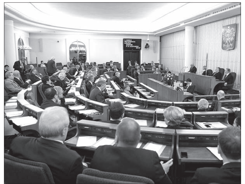
Senat będzie ponownie zajmować się rozdysponowywaniem pieniędzy dla Polonii.