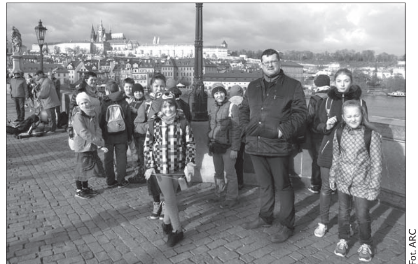
Uczniowie z Trzyńca na Moście Karola w Pradze.

centrum stolicy mieliśmy możliwość obejrzenia Senatu, po którym oprowadził nas sam senator Petr Gawlas. Po zapoznaniu się z cudownymi wnętrzami Pałacu Wallensteina – siedziby Senatu, dzieci mogły nawet usiąść w ławach senatorskich. Później zwiedziliśmy Ambasadę Rzeczypospolitej Polskiej, gdzie również zostaliśmy bardzo mile przyjęci. Na pewno dzieciom podobało się również w muzeum czekolady, gdzie do woli mogły degustować różnego rodzaju przysmaki i zapoznały się z procesem produkcji cukierków czekoladowych. Pod koniec dnia wzięliśmy udział w wernisażu prac połączonym z uroczystym rozdaniem nagród w praskim Domu Mniejszości Narodowych. Do Trzyńca wróciliśmy zmęczeni, ale pełni wrażeń i miłych wspomnień. (md)