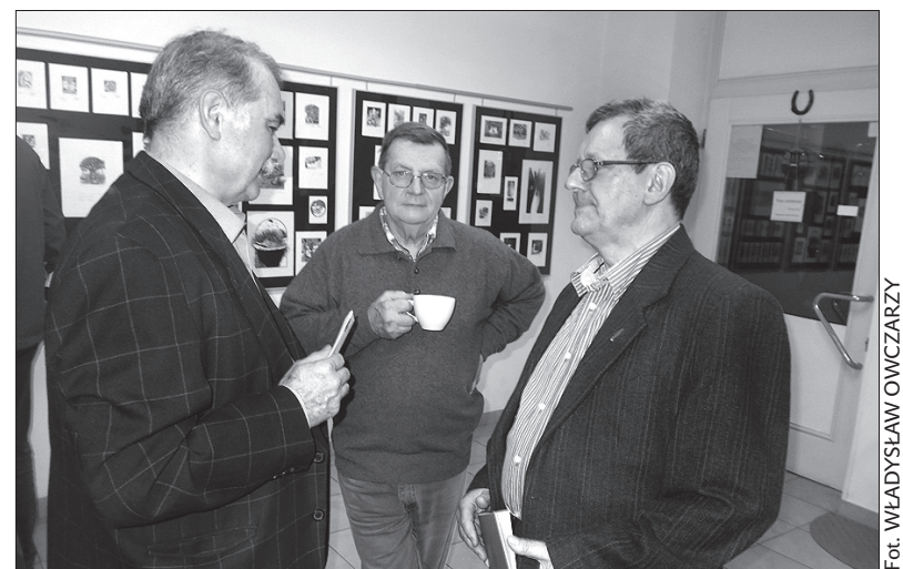
Artysta (pierwszy z prawej) w rozmowie z gośćmi wernisazu.