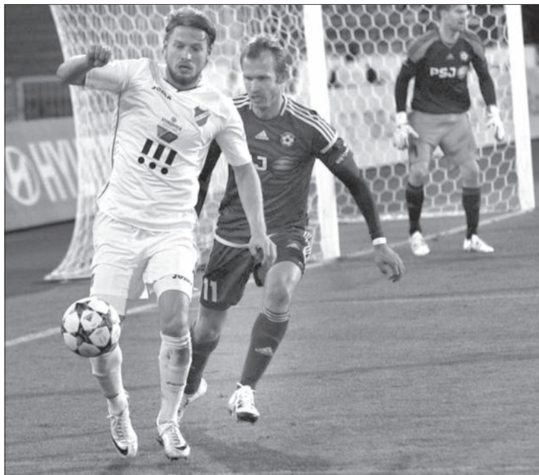
Banik może już powoli zamawiać bilety do drugiej ligi.

W niedzielę Ostrawa zmierzy się ze Spartą. Notowania Banika sięgnęły dna. Jeśli nie zdarzy się cud, w przyszłym sezonie Ostrawa zaprezentuje się w drugiej lidze, ale nawet rozgrywki FNL wcale nie muszą oznaczać wygranej w loterii. Doświadczenia innych, utytułowanych klubów z przeszłości wskazują raczej na nerwówkę również w drugiej najwyższej klasie rozgrywek. Wystarczy spojrzeć na losy takich klubów, jak GKS Katowice, Polonia Warszawa czy Widzew Łódź – to przykłady polskich drużyn, które