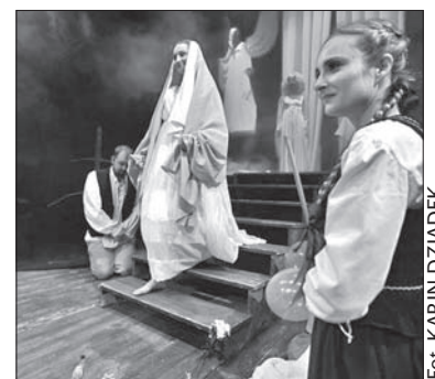
Zdjęcie ze spektaklu „Powsinogi beskidzkie” Emila Zegadłowicza.