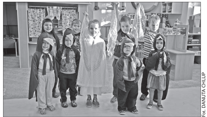
Przedшкоolaki z Cierlicka przygotowują się do spotkania z Mikołajem. Jemu i rodzicom przedstawią program o Pani Zimie.