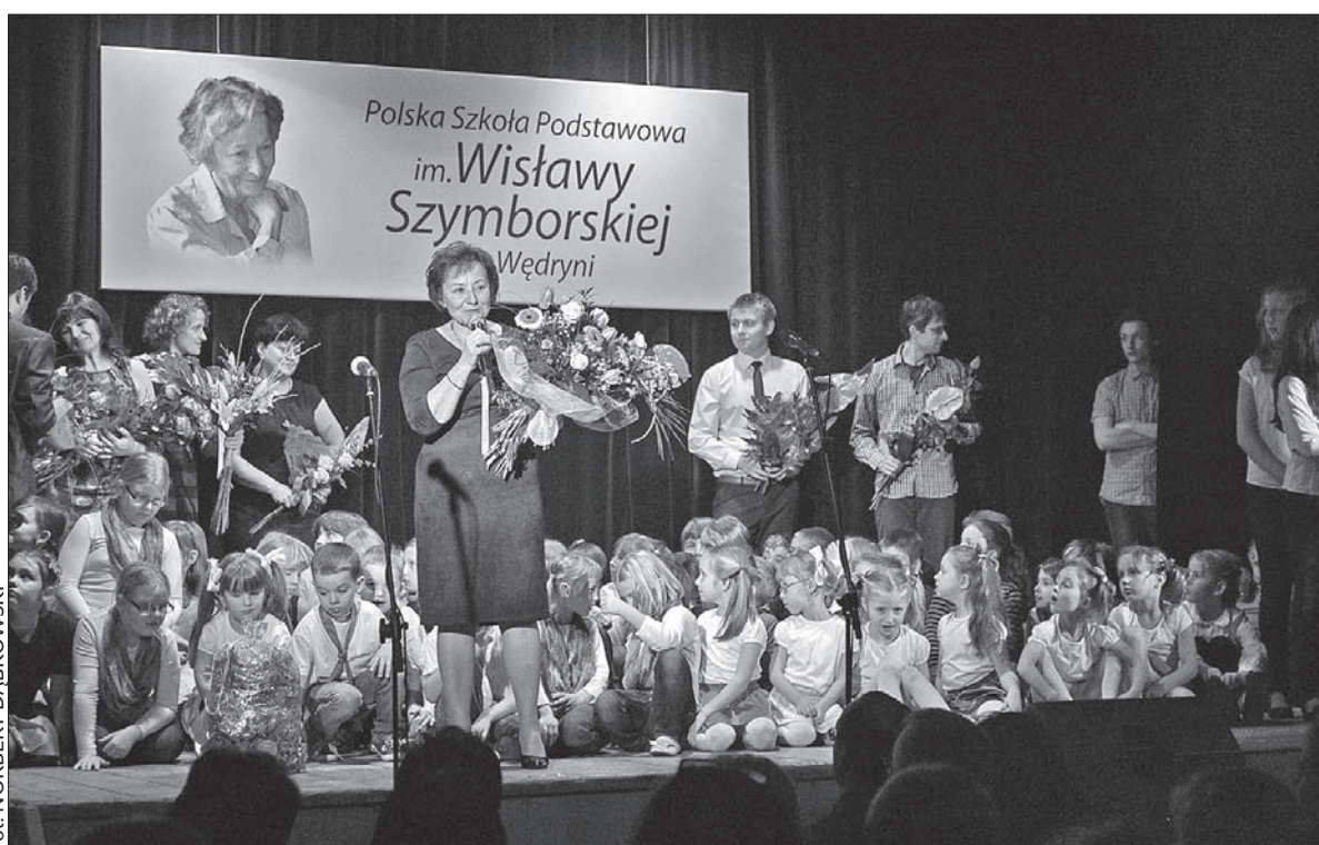
Polska Szkoła Podstawowa im. Wisławy Szymborskiej w Wędryni – tak brzmi nowa oficjalna nazwa wędryńskiej polskiej podstawówki.