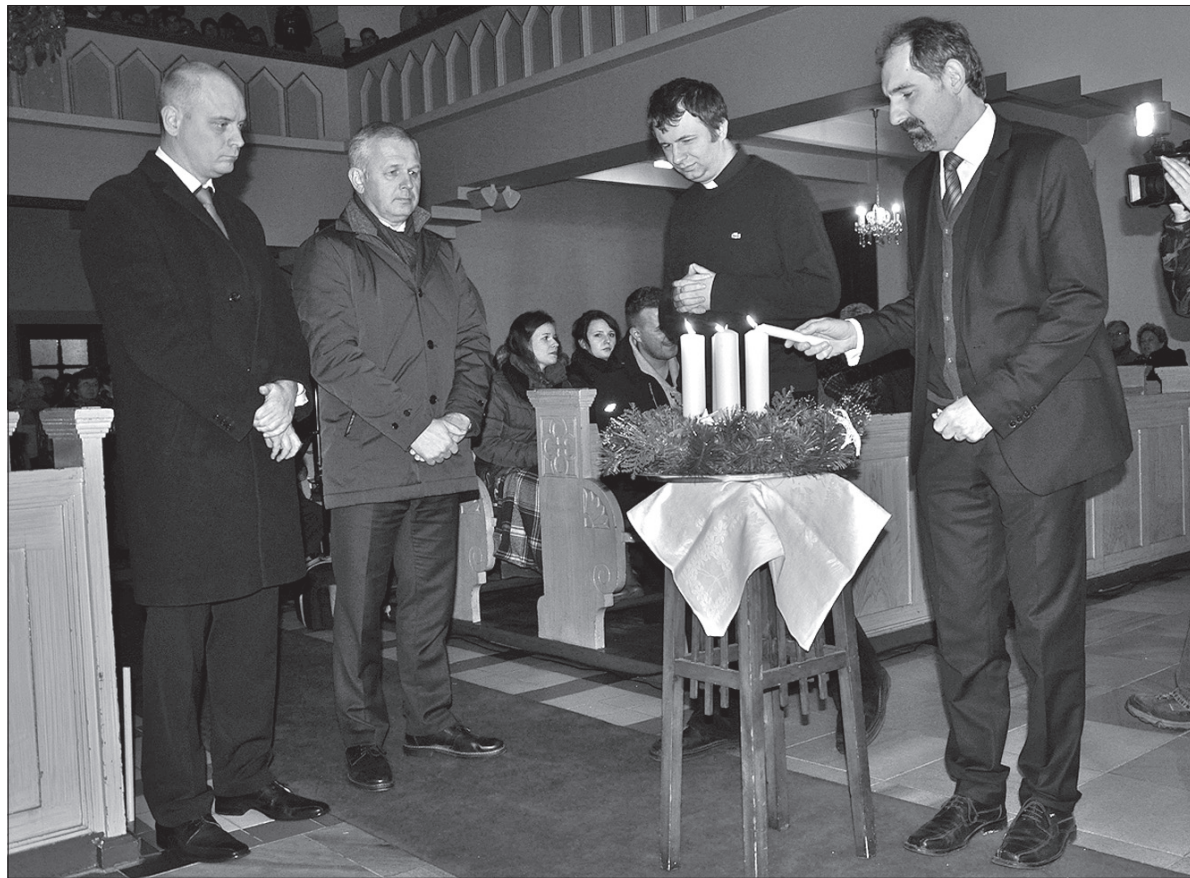
Uroczyste zapalenie świec na wieńcu adwentowym.