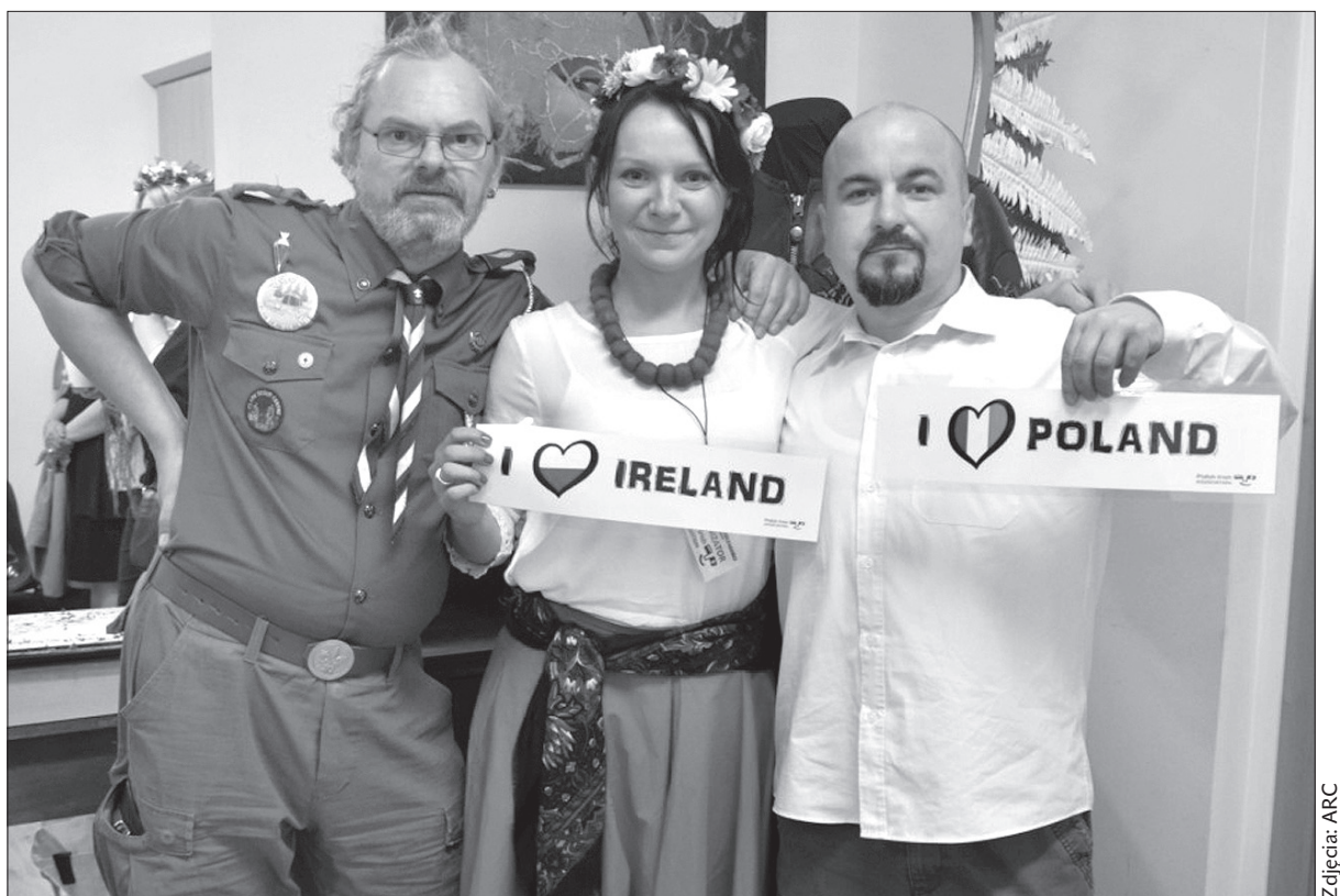
Polacy mieszkający w Irlandii też potrafią świętować i dobrze się bawić.

Organizatorzy szczególną uwagę poświęcili dzieciom, na które czekały liczne gry, zabawy i warsztaty – od starego niedźwiedzia po warsztaty plastyczne. (r)