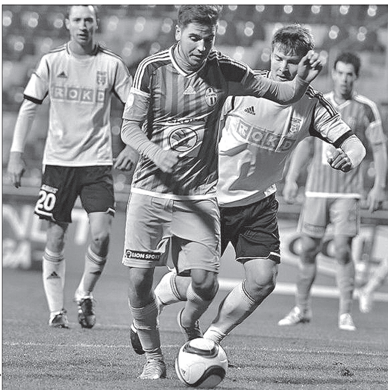
Mlada Boleslav przesądziła o wygranej z Karwiną w drugiej połowie.

– Wynik z pierwszego meczu, czyli nasza przegrana 0:1, stawiała w rewanżu w uprzywilejowanej