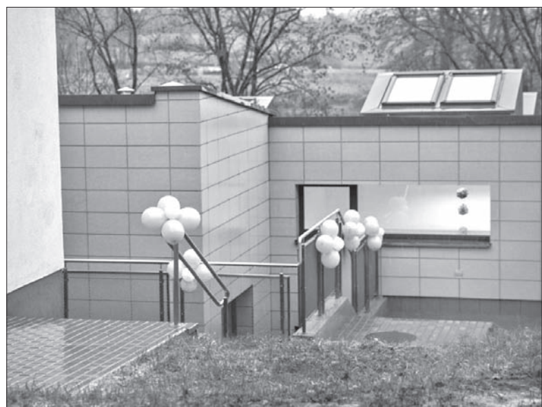
Przedszkola w rejonie wileńskim powstają jak przysłowiowe grzyby po deszczu.

Obecnie w przedszkolu działają dwie grupy przedszkolne i jedna grupa wczesnoszkolna. Budowę przedszkola rozpoczęto w 2014 roku.