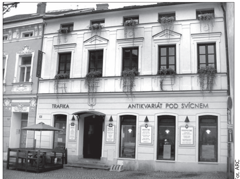
Piękna kamienica zwana „Pod świecznikiem” we Frydku-Mistku jeszcze w czasach komuny skazana była na stopniową likwidację. Na szczęście znaleźli się ludzie, którzy uratowali zabytkowy obiekt. Nowy rozdział zaczęto pisać pod koniec ubiegłego tysiąclecia. W 2000 roku kamienica została na nowo otwarta i w tym roku świętuje swoje 15-lecie. Wtedy to otwarto tutaj antykwariat i kawiarnię. Od tego czasu dołączyły do nich galeria, klub „Pavlač” i restauracja wegetariańska. Kamienica znana jest jednak przede wszystkim z wielu ciekawych imprez: wieczorów poetyckich, wystaw, koncertów. To w niej też zrodził się pomysł założenia jednej z najważniejszych imprez – charytatywnego festiwalu Sweetsen Fest. (kor)