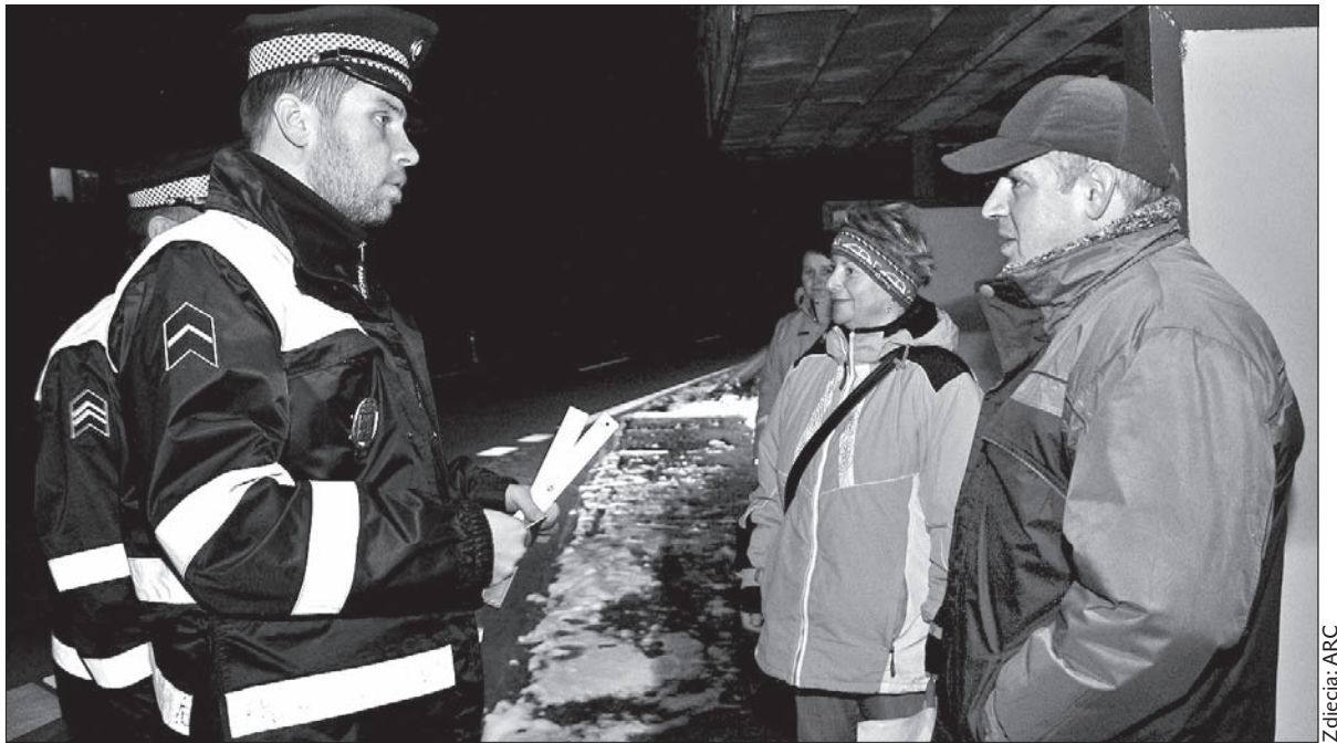
Czeskokoczińska akcja ruszyła w poniedziałek.

Czeskokoczińska akcja ruszyła w poniedziałek, a jej celem jest zwrócenie pieszym uwagi na to, że jeżeli nie będą na drodze dobrze widoczni, mogą po zmierzchu zostać potrąceni przez przejeżdżające obok nich samochody. – Wybraliśmy kilka miejsc na obrzeżach miasta, gdzie drogi są niedostatecznie oświetlone. Tam będziemy wcześniej rano lub wieczorem rozmawiać z przechodniami