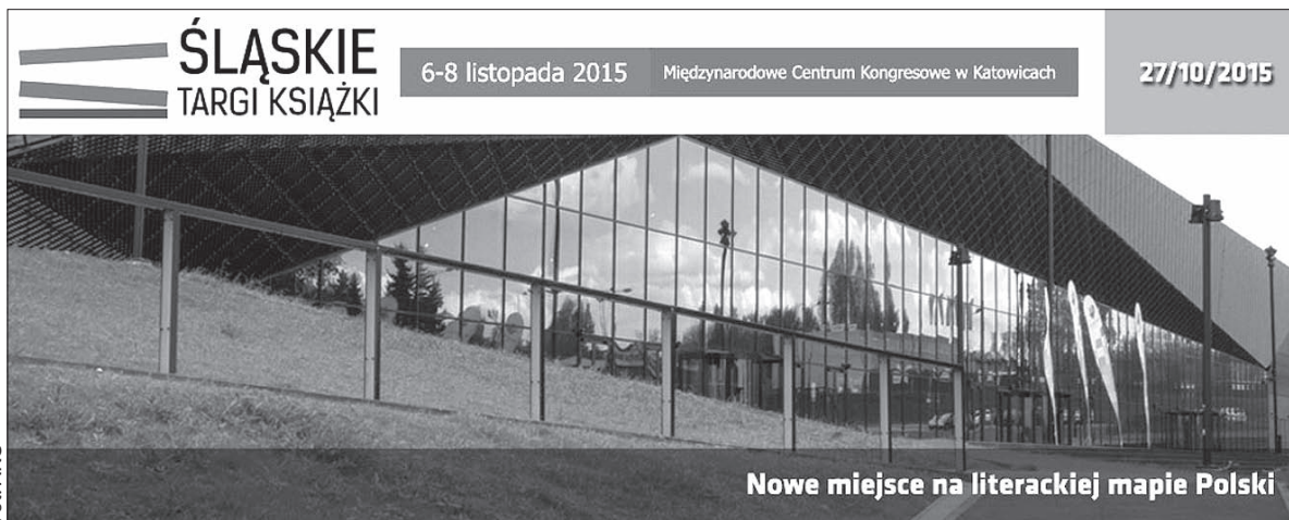
Nowe miejsce na literackiej mapie Polski – także z zaolziańskim akcentem.