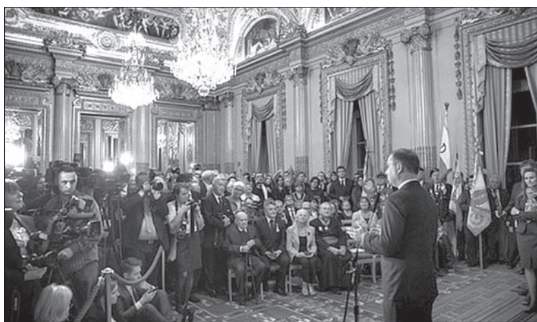
Prezydent RP Andrzej Duda podczas spotkania z Polonią w Paryżu.