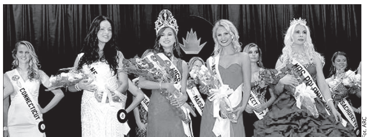
Polki zachwycają urodą na całym świecie.