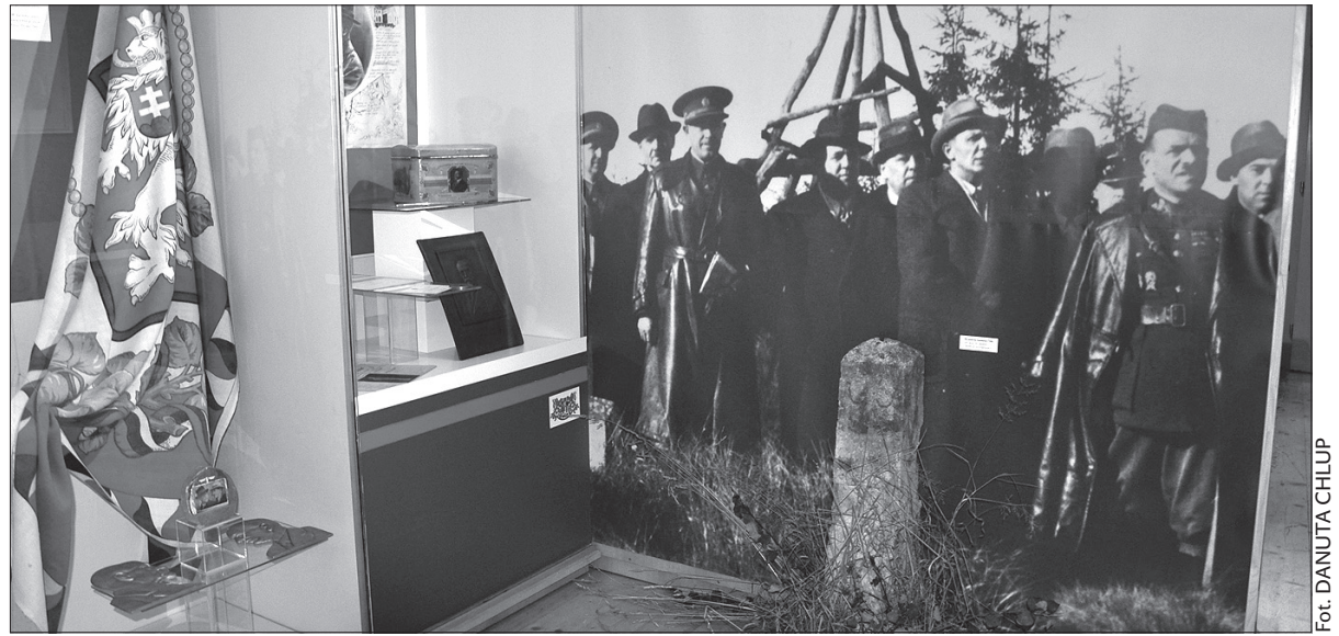
Kamień graniczny z granicy czechosłowacko-polskiej i gablota poświęcona T.G. Masarykowi.

Kustosze jabłonkowskiego muzeum wyjaśniła, że ze względu na ograniczone możliwości lokalowe placówki, podjęte przez muzeum tematy zostały tylko zasygnalizowane. Do autora ekspozycji zwróciliśmy się z pytaniem, czy – mimo wszystko – nie można było tak ważnych tematów, rzutujących również na dzisiejsze współżycie Czechów i Polaków w tym regionie, potraktować bardziej kompleksowo? Zasugerowaliśmy, że w przypadku, gdy w jabłonkowskiej