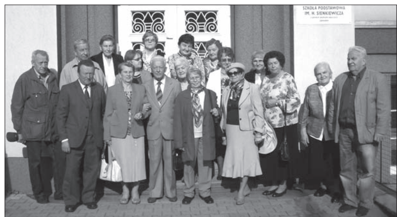
Pamiątkowe zdjęcie uczestników spotkania w Jabłonkowie.

Na poszukiwania pierścienia św. Kingi wybrało się do Wieliczki 54 członków MK PZKO w Hawierzowie-Błędowicach. Nasza grupa składała się z przedstawicieli różnych pokoleń. Zebrałiśmy się wczesnym rankiem w sobotę 10 października i wyruszyliśmy autokarem w kierunku Wieliczki, gdzie podobno po raz ostatni widziano pierścień. Po przyjeździe do kopalni soli opiekę nad nami, poszukiwaczami, przejęły panie przewodniczki, które prowadząc nas w dół po 360 schodach rozpoczęły wykład o kopalni soli i tradycjach solankowych w okolicach Krakowa. W trakcie schodzenia spotkaliśmy orszak królowej Kingi, akurat w momencie, gdy górnik z kopalni Wieliczka oddawał swej młodej królowej jej pierścień zaręczynowy znaleziony w pokładach soli. Wszystkich poszukiwaczy zachwycała sala św. Kingi z rzeźbą „Ostatniej