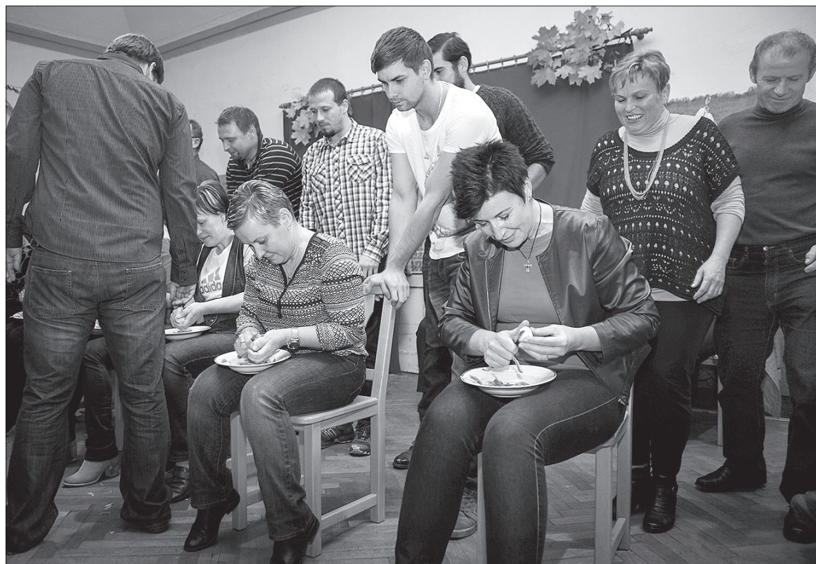
Drużynowa rywalizacja w obieraniu ziemniaków.