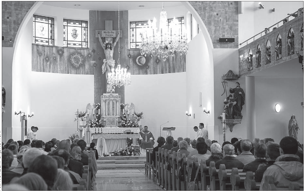
Kościół w Jabłonkowie po remoncie prezentuje się okazale.

zakończone. Oficjalne poświęcenie świątyni w nowej odsłonie nastąpi dopiero po zamontowaniu nowego