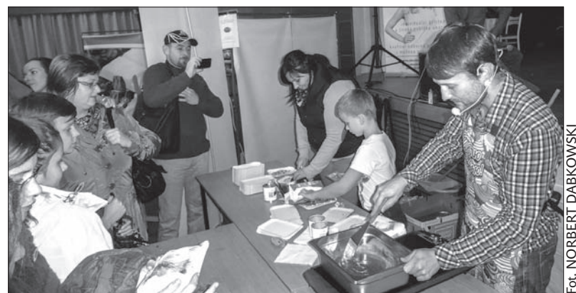
Bardzo słodka i smaczna impreza odbyła się w trzynieckim Domu Kultury „Trisia”. Festiwal Czekolady trwał od piątku do niedzieli. Na miejscu można było zobaczyć wiele rzeczy wykonanych z czekolady – narzędzia, akcesoria, rewolwer. Przez trzy dni festiwal odwiedziło ok. 4000 osób, amatorów czekolady, która... lala się strumieniami. (endy)