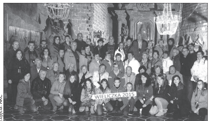
Zadowoleni uczestnicy wycieczki w podziemiach.