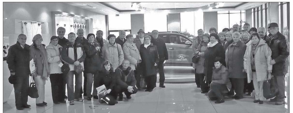
Seniorzy byli zachwyceni tym, co zobaczyli w Noszowicach.

Oprócz comiesięcznych spotkań organizujemy również tradycyjną wigilijkę i wycieczkę. Była chata chlebowa, browar i nasze Beskidy i... 12 października wyruszyliśmy do fabryki samochodów Hyundai w Noszowicach, by zobaczyć coś nowego. Najpierw film – budowa i wyposażenie fabryki trwało 18 miesięcy. Ubieramy kamizelki i dostajemy nagłośnienie, siadamy do małych pociągów – elektryczna „ciuchcia” i oglądamy po kolei cały proces produkcji. Jesteśmy zaskoczeni szybkim automatyzacją. W ubiegłym roku opuściło fabrykę 307 000 samochodów. Na pewno warto zwiedzić to miejsce. Później pojechaliśmy nad zaporę Morawka, ale pogoda nas nie rozpieszczała. Zapraszamy naszych