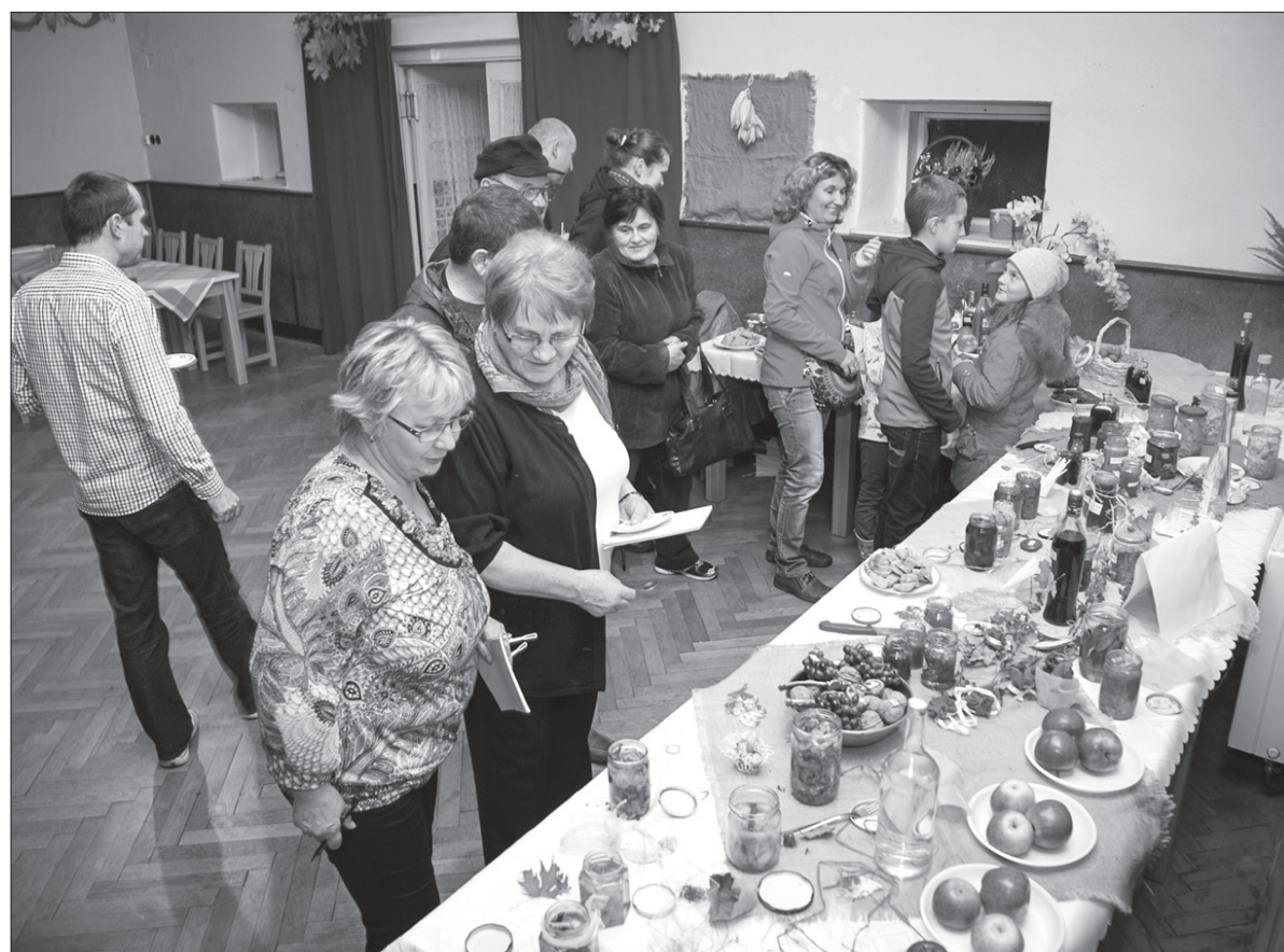
Degustacja plonów i przetworów.