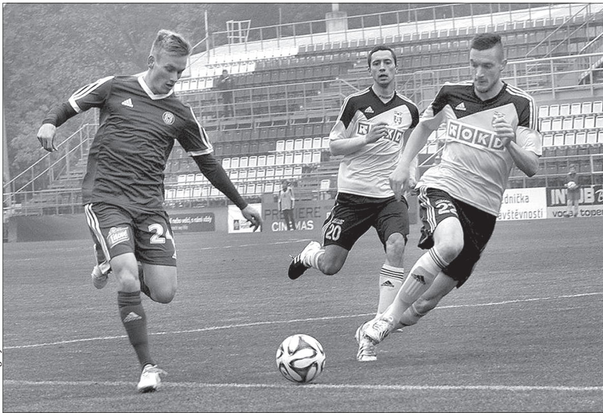
Karwiniacy sensacyjnie przegrali w weekend z rezerwami Sigmy Olomuniec.

szą przegrana w sezonie. Piosenkę „To nie tak miało być” zaśpiewał cały zespół Jozefa Webera. – Wszyscy zagrali tragikomicznie. Przegraliśmy zasłużenie – podsumował krótko fatalny występ faworyta trener nadolziańskiego klubu. Łabędzim śpiewem był gol Budínskiego, który nie wiedział, co zrobić z futbolówką, więc uderzył i trafił do celu. Jeśli karwiniacy chcą walczyć o awans do 1. ligi, muszą się ustrzec tego rodzaju wpadek.