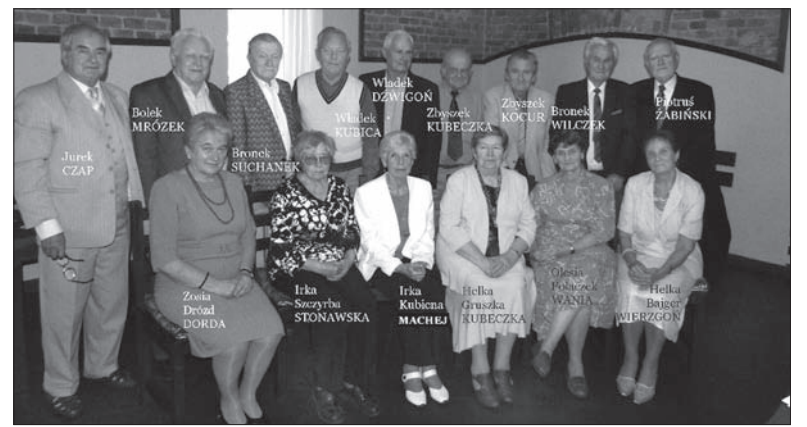
Absolwenci Polskiego Gimnazjum w Orłowej.

Na początku października spotkało się grono 15 osób klasy maturalnej z roku 1955 Polskiego Gimnazjum im. Juliusza Słowackiego w Orłowej, by uczcić 60-lecie zdania matury. Z 42 uczniów żyją jeszcze 24 osoby, a ci, którzy zjawili się na spotkaniu, czuli potrzebę (pomimo różnego rodzaju fizycznych niedomagań) powspominania odległych wydarzeń, kiedy po raz pierwszy usiedli w ławkach sławnej Alma Mater, skróconego okresu nauki do matury i różnych dalszych kolei losu własnych i kolegów. W wyniku ówczesnej reformy czechosłowackiego szkolnictwa z roku 1953, byliśmy pierwszymi absolwentami, jednak nie tradycyjnego gimnazjum, ale nowego, przywleczzonego ze wschodu tworu – jedenastoletniej szkoły średniej. Jednak, niezależnie od nazwy, duch dawnej szkoły został nam przez pedagogów „starej daty” tak głęboko zaszczepiony, że potrafiliśmy pielęgnować i nieść go przez następne lata aż do czasów współczesnych. Jesteśmy przekonani, że kolejne pokolenia ab-