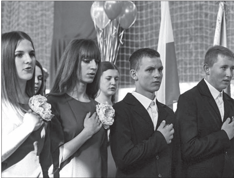
Inauguracja roku szkolnego w polskim gimnazjum w Trokach.

O zgodę samorządu na rozpoczęcie procesu akredytacji programu kształcenia średniego i uzyskanie statusu gimnazjum Szkoła Średnia w Trokach z polskim językiem nauczania walczyła od 2013 roku. Władze trockiego samorządu, które dały zgodę na rozpoczęcie procesu akredytacji programu kształcenia średniego czterem innym szkołom, w tej jednej sprawie wciąż wyjadały jakieś przeszkody. Radni nie chcieli słyszeć ani głosu rodziców, ani nauczycieli, ani opinii Ministerstwa Oświaty i Nauki, które uznało, że szkoła trocka spełnia wymogi akredytacji. Społeczność szkolna walczyła o szanse dla swojej placówki i w sądach, i na pikietach. Dopiero w maju 2014 r. Rada Samorządu Rejonu Trockiego wyraziła zgodę na rozpoczęcie akredytacji programu kształcenia