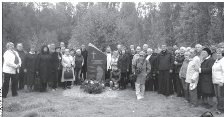
»Memorial« otwarto 11 listopada 1989 roku.

Konsulat generalny RP w Irkucku/Stowarzyszenie »Wspólnorta Polska«