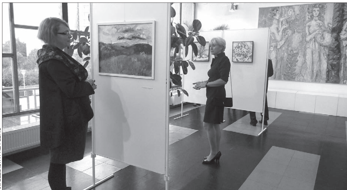
Wystawę poplenerową Stowarzyszenia Artystów Plastyków w RC można oglądać do 25 października w Teatrze Cieszyńskim.

Przypomnijmy, że organizatorami całorocznego cyklu spotkań dyskusyjnych w AVION-ie są Biblioteka Miejska w Czeskim Cieszynie oraz Zamek Cieszyn. Projekt jest wspierany finansowo przez Konsulat Generalny Rzeczypospolitej Polskiej w Ostrawie. Organizatorzy proszą o wcześniejszą rezerwację miejsc. (kor)