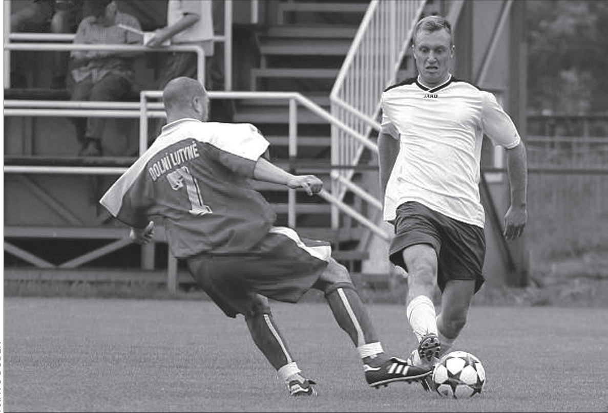
Piłkarze Stonawy grają w tym sezonie poniżej oczekiwań.

Hojdysz to były zawodowy piłkarz, który w swojej karierze bro-