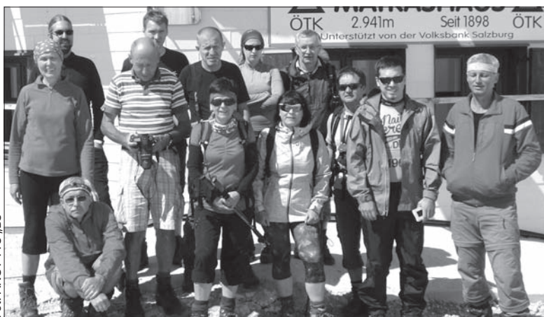
Grupa Zaolzian w czasie alpejskich wojaży.