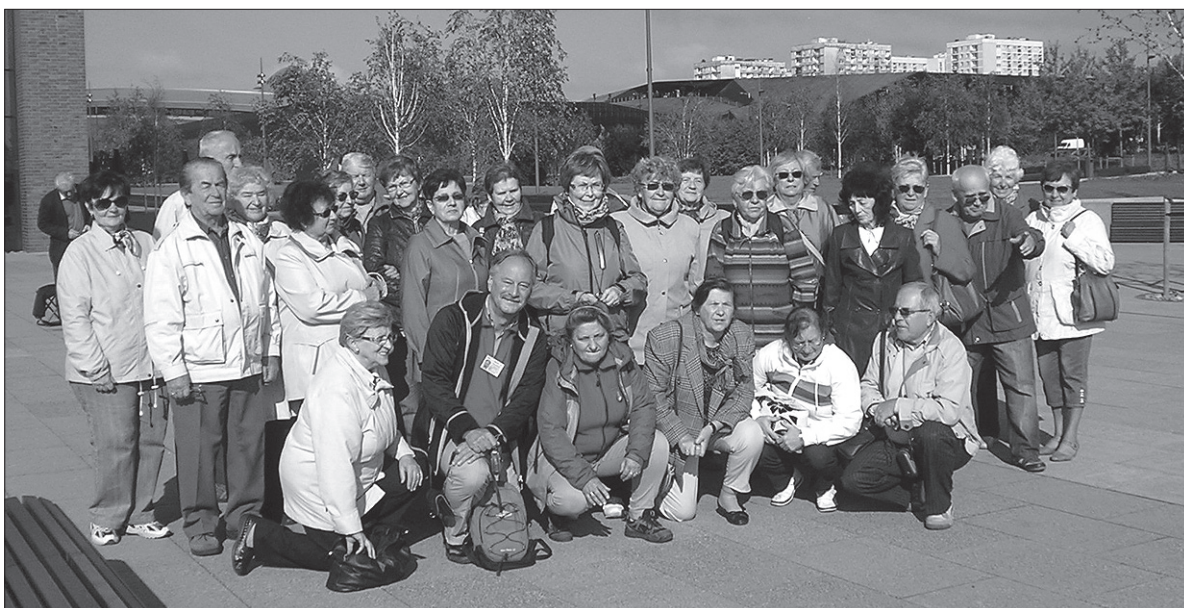
Tym razem emerytowani nauczyciele wybrali się na wycieczkę do Katowic.