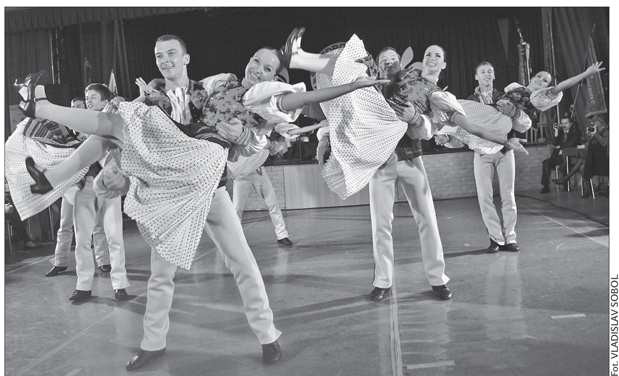
Publiczność zauroczył w sobotę w Suchej Górnej m.in. słowacki zespół PŮLS.