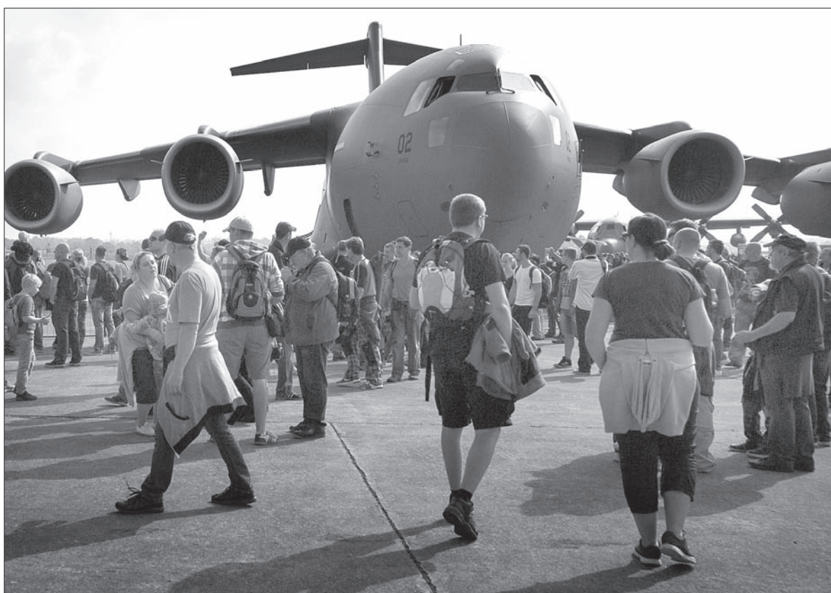
Boeing C-17 Globemaster.