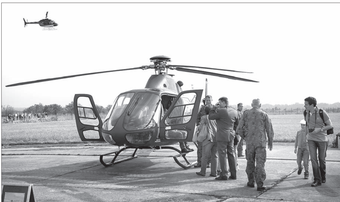
Helikopter SW-4 Puzczyk 41. Bazy Lotnictwa Szkolnego Polskich Sił Powietrznych.