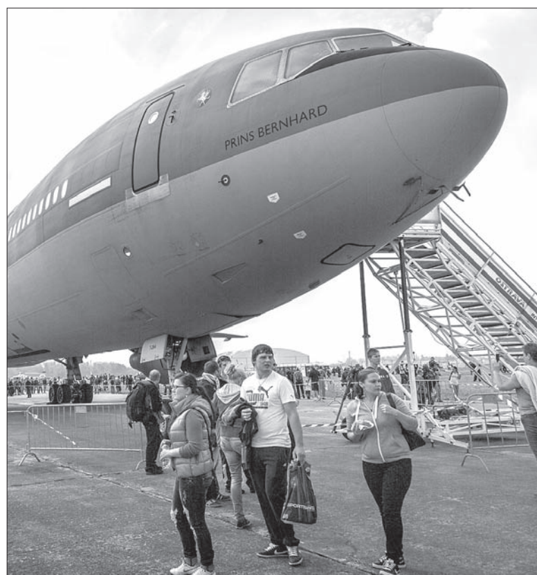
Dni NATO przyciągnęły wielu młodych wielbicieli latających maszyn.