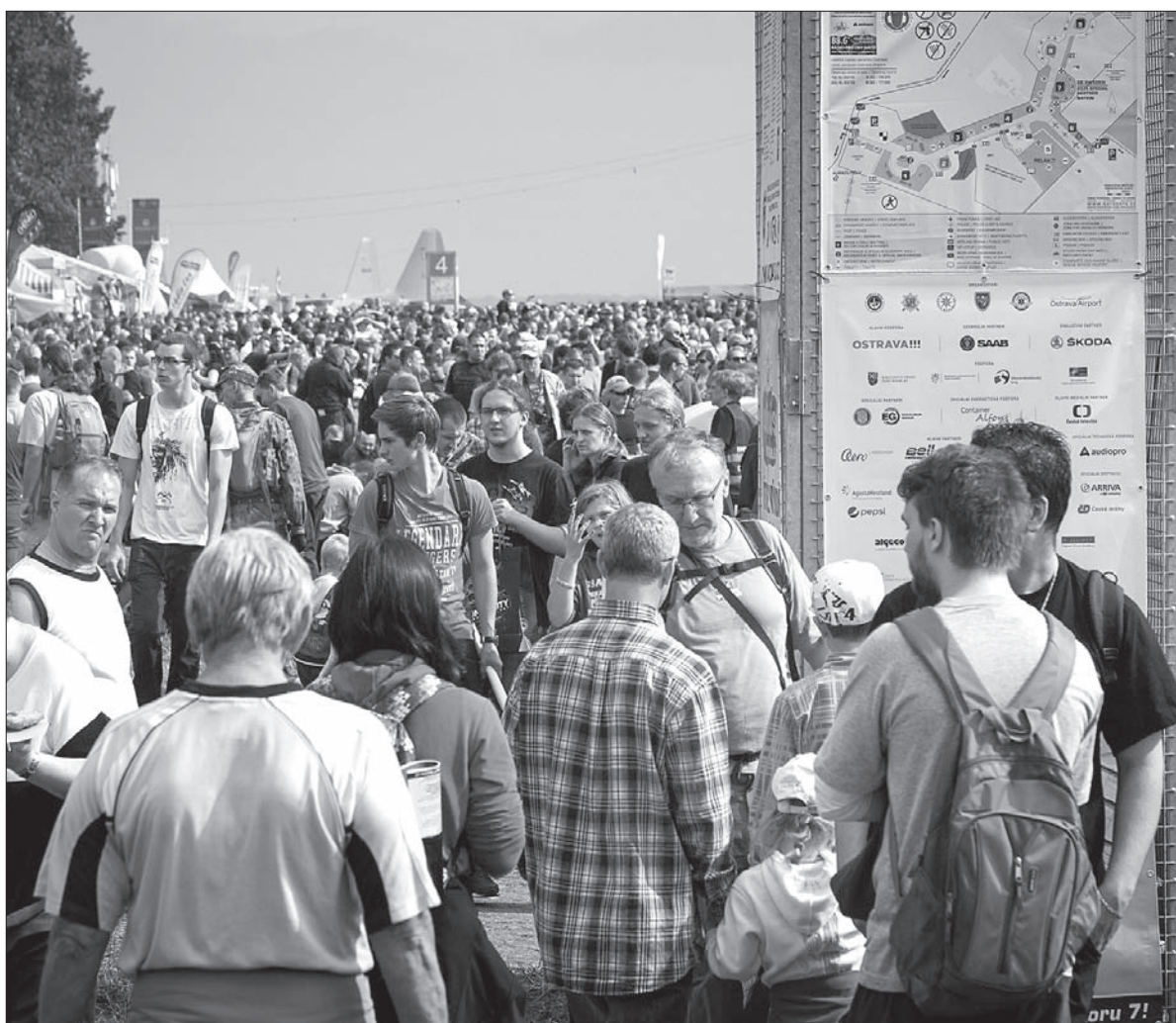
Tłumy na lotnisku w Mosznowie.