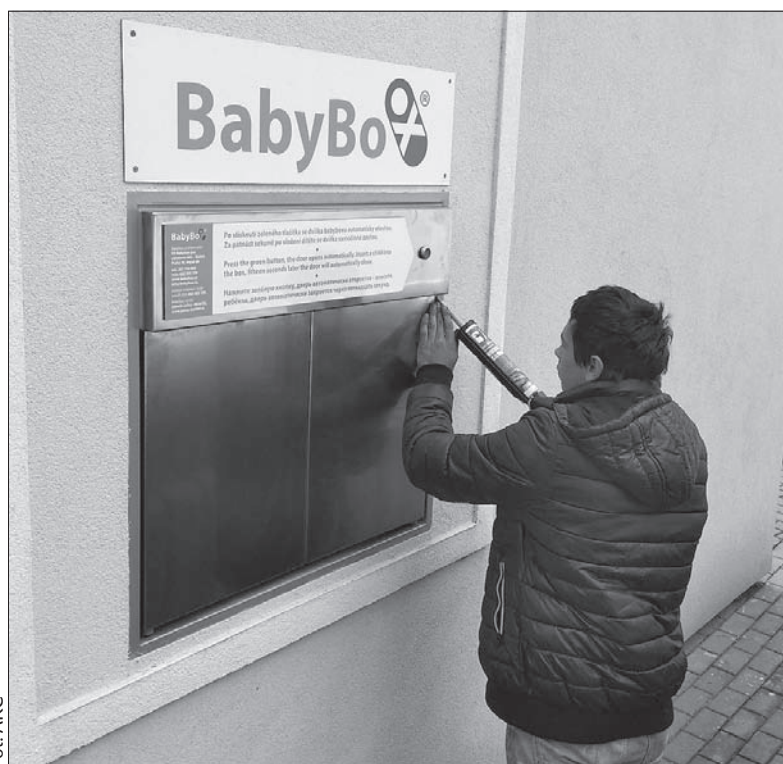
Wczoraj na budynku Dyrekcji Szpitala Trzyniec zainstalowano okno życia. Czynne będzie od 1 października br.

Ostatnim miastem w naszym regionie, gdzie zainstalowano okno życia, był rok temu Hawierzów. Wczoraj dołączył do niego Trzyniec. Znajduje się ono w murze budynku dyrekcji Szpitala Trzyniec, przed wjazdem do szpitala, zaraz po prawej stronie. – Wybór miejsca jest zawsze bardzo waż-