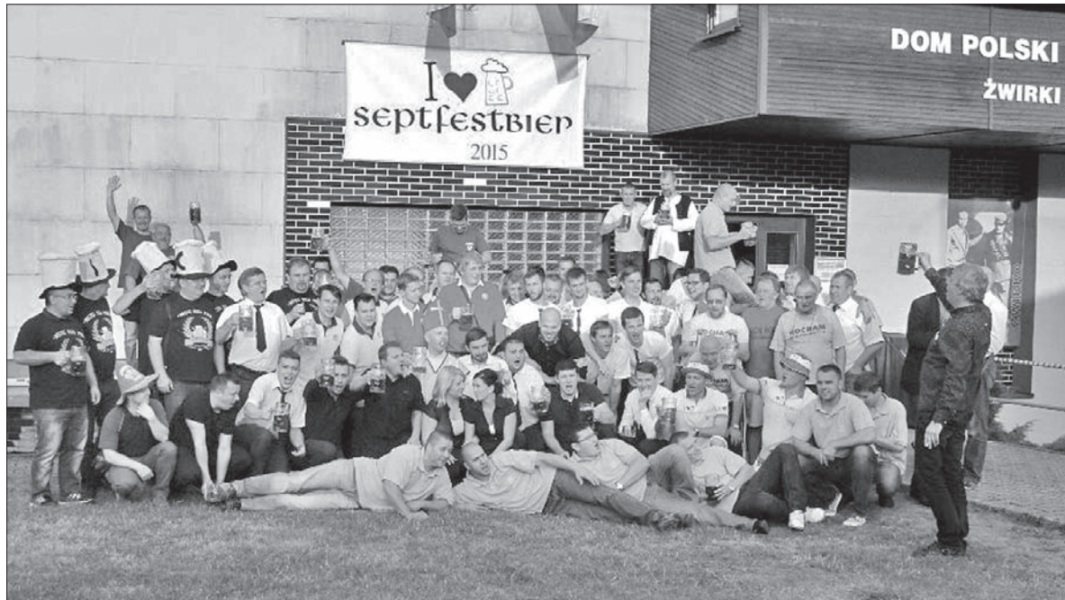
Uczestnicy Septfestbiera przed Domem Żwirki i Wigury w Cierlicku-Kościelcu.