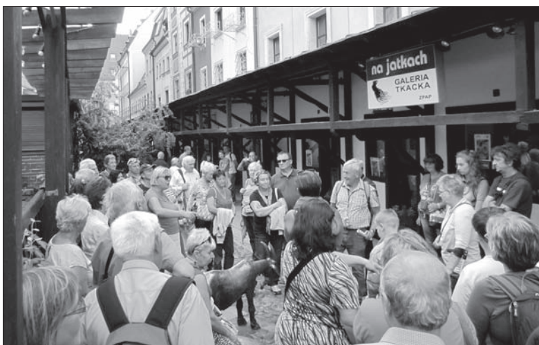
Wrocławskie zaułki zachwyciły uczestników wycieczki.

W drodze powrotnej nasz autokar zatrzymał się w małej wiosce Olszowa, tuż obok autostrady. Tam rozprzestrzeniła się Park Miniatur Sakralnych. Jest to pierwszy tego typu obiekt na Opolszczyźnie. Główną atrakcją tego parku jest przepiękny ogród o powierzchni 20 tysięcy metrów kwadratowych, w którym znajduje się kilkanaście miniatur najbardziej znanych obiektów sakralnych na świecie. Są to ważne obiekty sakralne, cenne zabytki oraz miejsca licznych pielgrzymek w Polsce i na świecie. W odróżnieniu od innych parków miniatur, te w Olszowej wykonane są wyłącznie w skali 1:25, a największa miniatura ma wysokość prawie 5 metrów. (P.T)