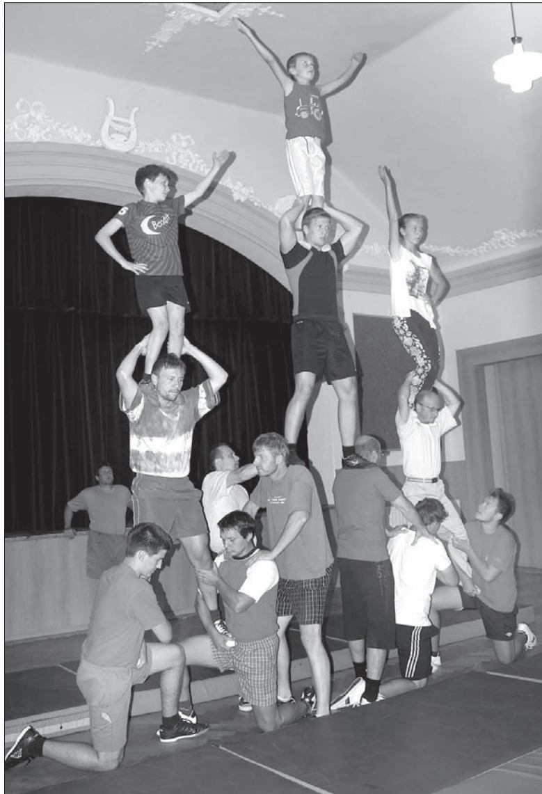
Próby „Gimnastów” odbywają się w „Czytelni”.