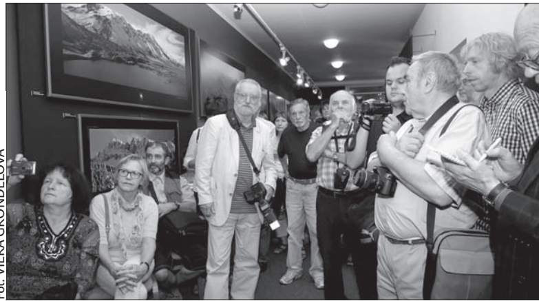
Wernisz wystawy fotografii górskich w Muzeum Ostrawskim.

Outdoorowych, który rozpocznie się w Ostrawie 9 października. Muzeum jest otwarte w dni powszednie od godz. 9.00 do 17.00, w soboty w godz. 9.00-13.00, a w niedziele w godz. 13.00-17.00. W święto państwowe 28 września placówka będzie nieczynna. (dc)