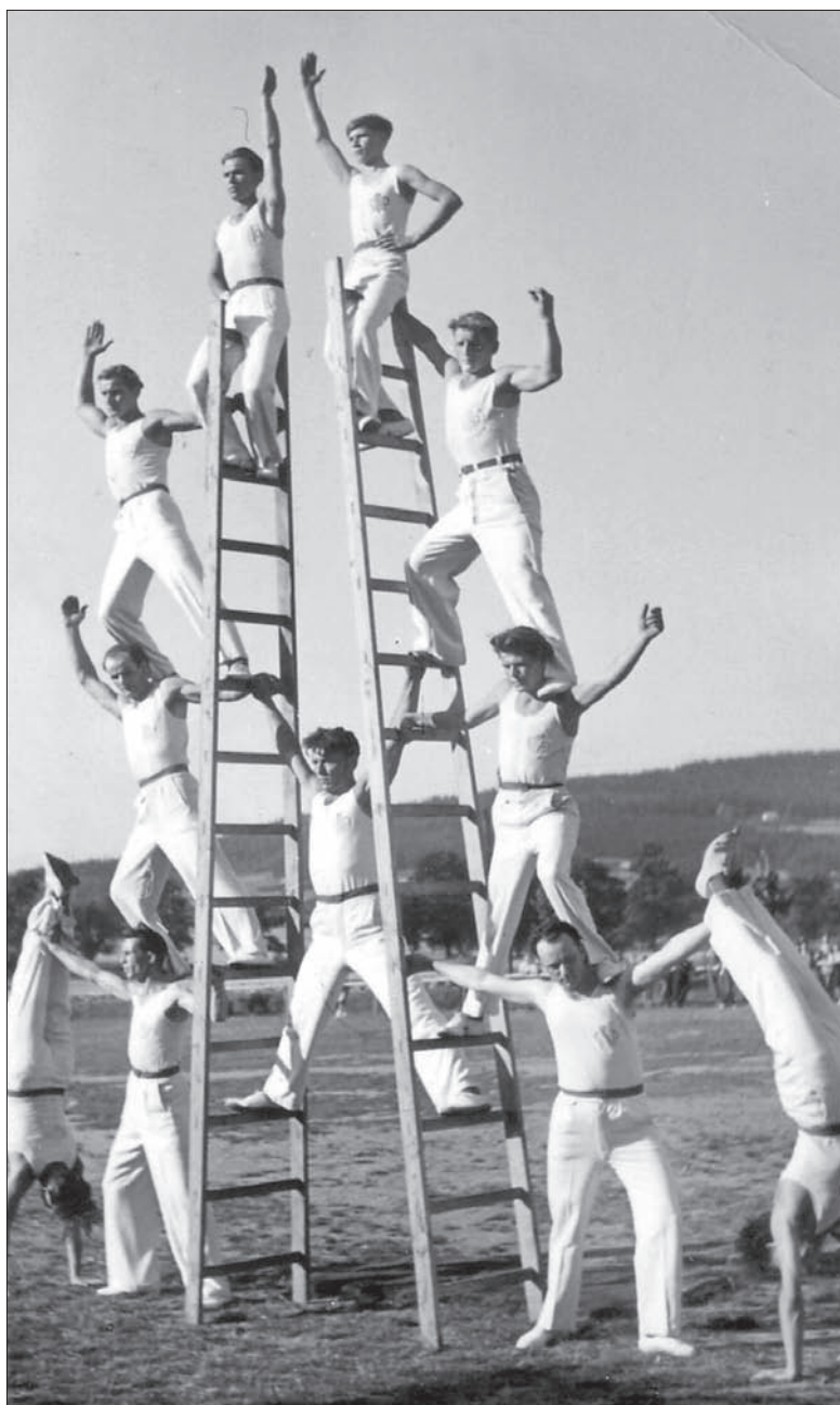
Układy z drabinami były bardzo efektowne, zrezygnowano z nich m.in. z powodu komplikacji przy transporcie. Na zdjęciu występ w 1949 roku.